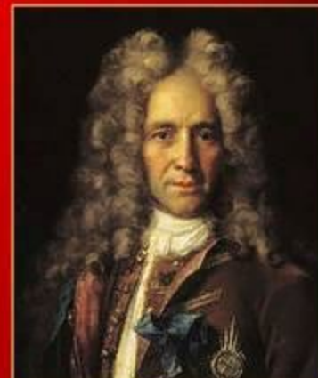
Г. И. Головкин – канцлер, президент Коллегии иностранных дел