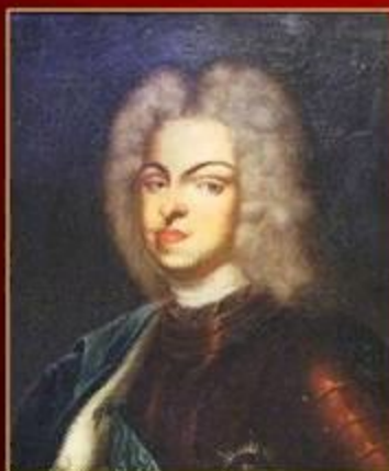
Карл Фридрих – герцог Шлезвиг- Гольштейн-Готторпский