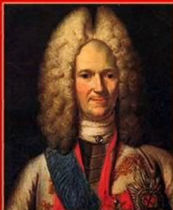
А. Д. Меншиков – генерал-фельдмаршал, президент Военной коллегии, генерал-губернатор Санкт-Петербурга