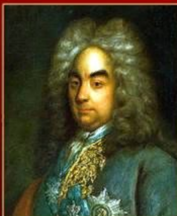
П. А. Толстой – действительный тайный советник, начальник Тайной канцелярии