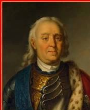
Ф. М. Апраксин – генерал-адмирал, президент Адмиралтейств- коллегии