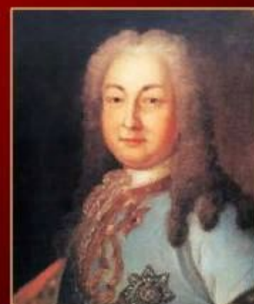
А. И. Остерман – вице-канцлер, президент Коммерц-коллегии