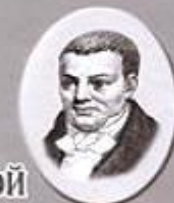
СВЯТОЙ ДОКТОР ГААЗ