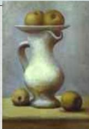
Кувшин с яблоками. Пикассо