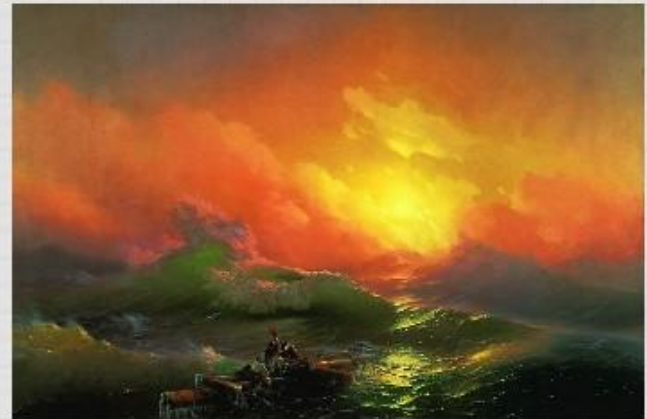
Девятый вал. И.Айвазовский