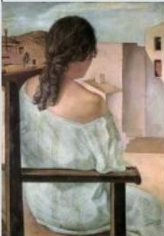
Девушка сидящая спиной. С.Дали