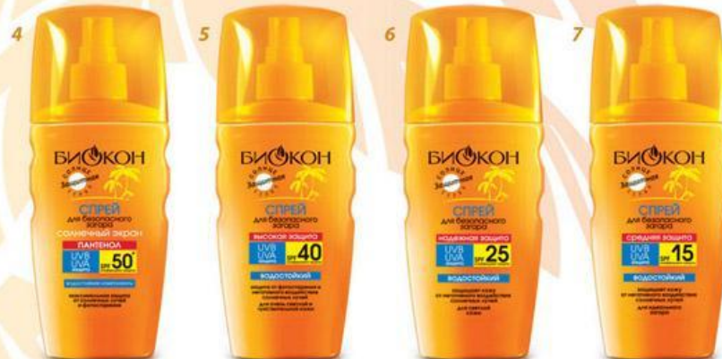
СПРЕИ ДЛЯ БЕЗОПАСНОГО ЗАГАРА