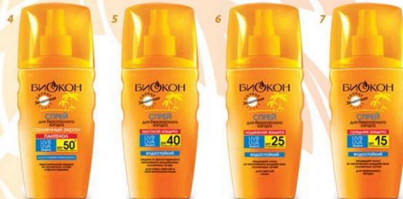
СПРЕИ ДЛЯ БЕЗОПАСНОГО ЗАГАРА