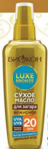
СУХОЕ МАСЛО для загара нежирное UVA UVB 20 SPF СУХОЕ МАСЛО 20 SPF для загара СРЕДНЯЯ ЗАЩИТА