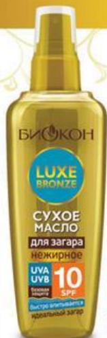
СУХОЕ МАСЛО для загара нежирное UVA UVB 10 SPF СУХОЕ МАСЛО 10 SPF для загара НИЗКАЯ ЗАЩИТА