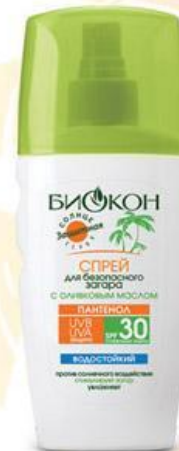
СПРЕЙ SPF 30 для безопасного загара с оливковым маслом