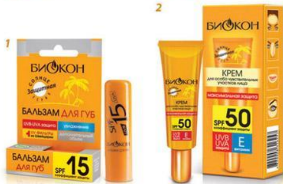
СРЕДСТВА ДЛЯ ЛИЦА