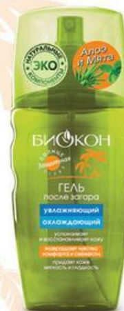
Гель после загара увлажняющий, охлаждающий

Сухое масло LUXE BRONZE – это ЗАЩИТА ОТ СОЛНЦА + КОМФОРТ И КРАСОТА КОЖИ!