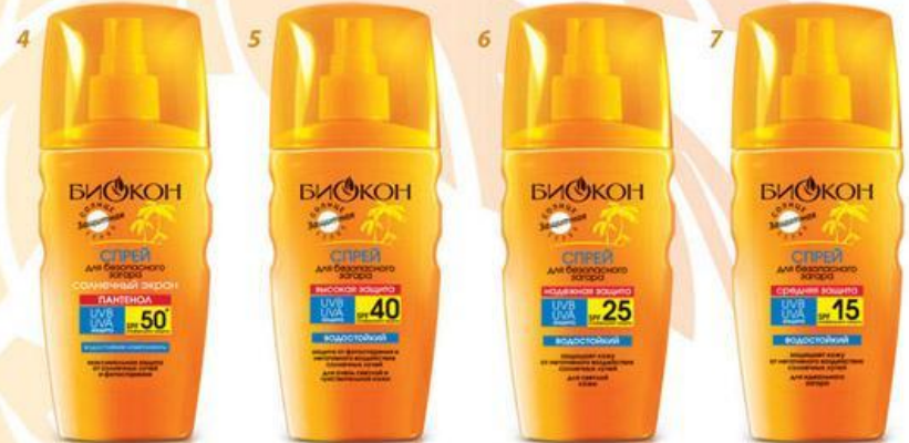
СПРЕИ ДЛЯ БЕЗОПАСНОГО ЗАГАРА