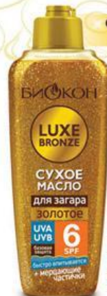
СУХОЕ МАСЛО для загара ЗОЛОТОЕ UVA UVB 6 SPF СУХОЕ МАСЛО 6 SPF для загара БАЗОВАЯ ЗАЩИТА