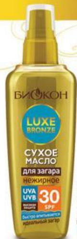
СУХОЕ МАСЛО для загара нежирное UVA UVB 30 SPF СУХОЕ МАСЛО 30 SPF для загара ВЫСОКАЯ ЗАЩИТА

Сухое масло LUXE BRONZE – это ЗАЩИТА ОТ СОЛНЦА + КОМФОРТ И КРАСОТА КОЖИ!