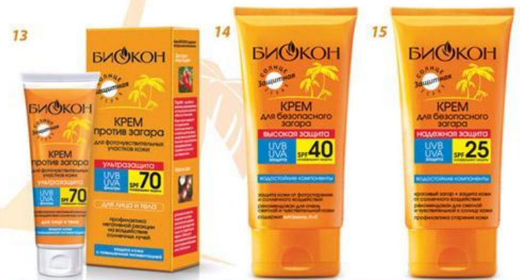
КРЕМЫ ДЛЯ БЕЗОПАСНОГО ЗАГАРА