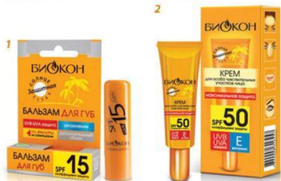
СРЕДСТВА ДЛЯ ЛИЦА