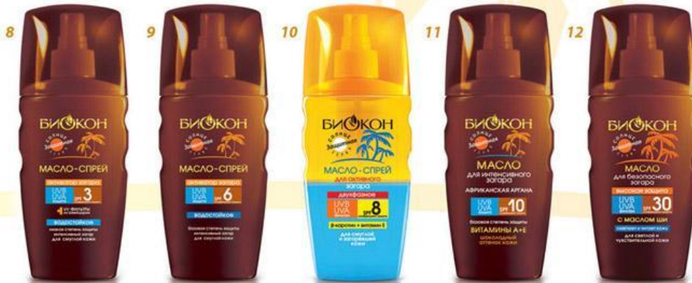
МАСЛА ДЛЯ ЗАГАРА