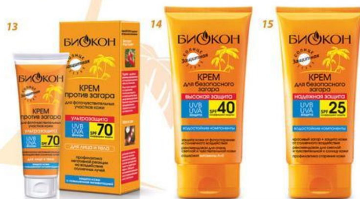
КРЕМЫ ДЛЯ БЕЗОПАСНОГО ЗАГАРА