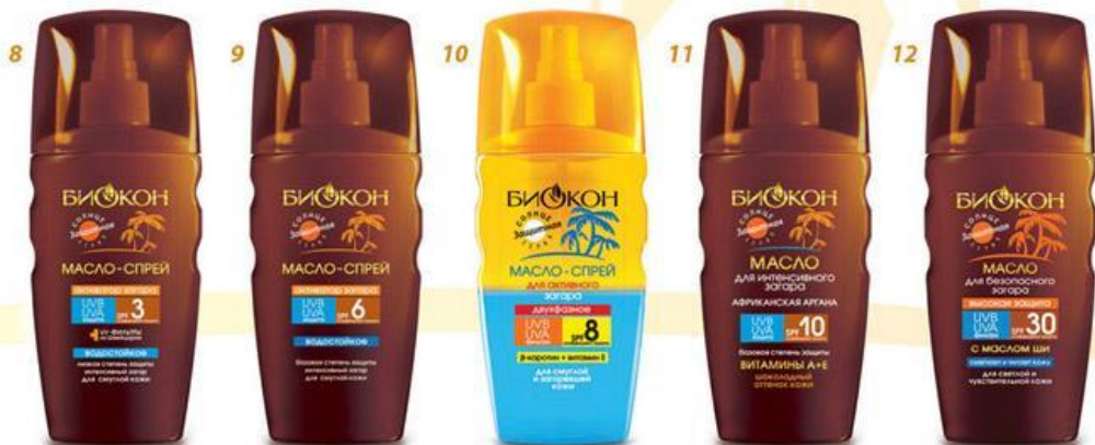
МАСЛА ДЛЯ ЗАГАРА