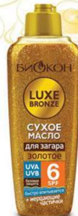
СУХОЕ МАСЛО для загара ЗОЛОТОЕ UVA UVB 6 SPF СУХОЕ МАСЛО 6 SPF для загара БАЗОВАЯ ЗАЩИТА