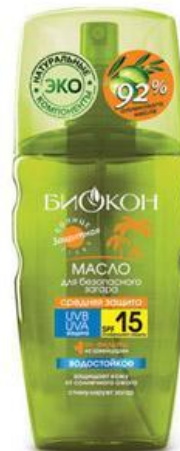
Оливковое масло для безопасного загара водостойкое, SPF 15