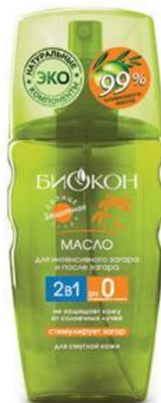
Оливковое масло для и после загара 2 в 1 увлажняющее, SPF 0