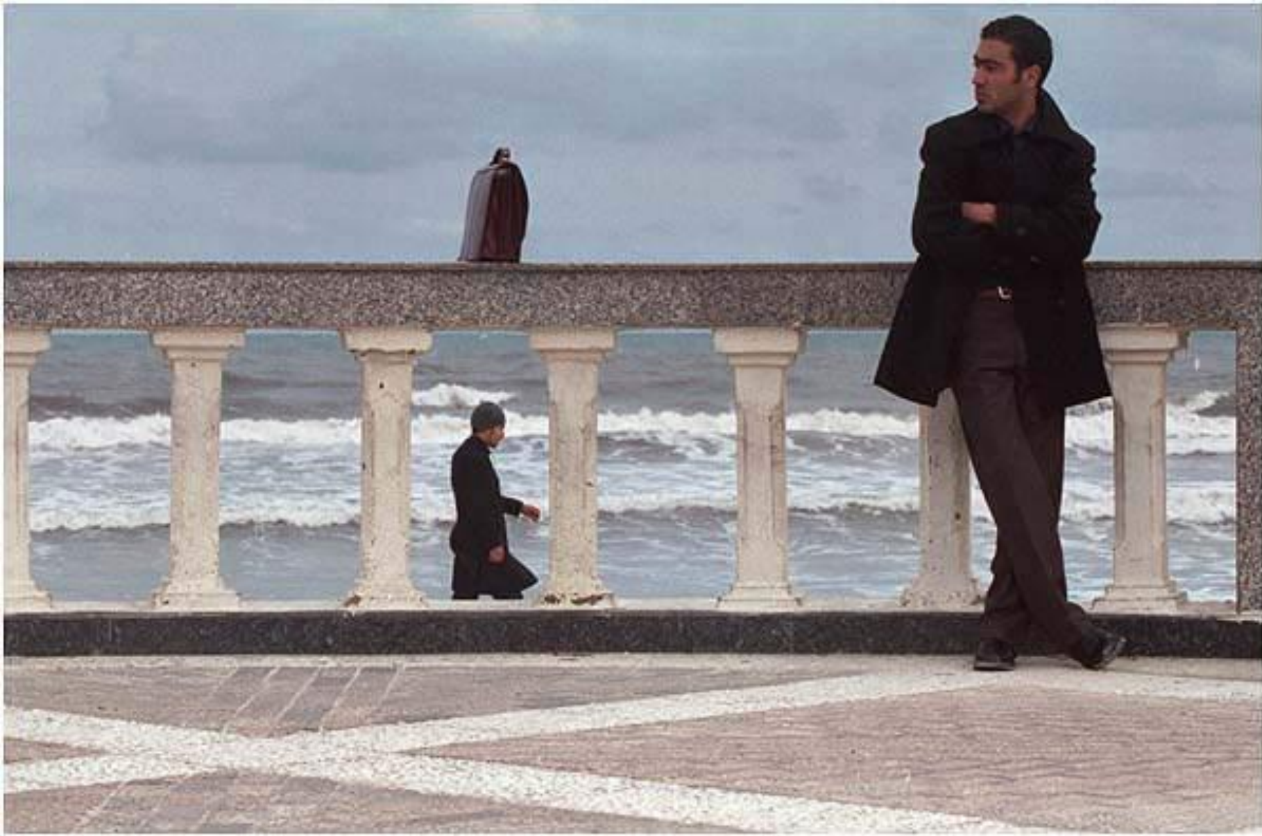
Набережная в колониальном стиле январь 2001