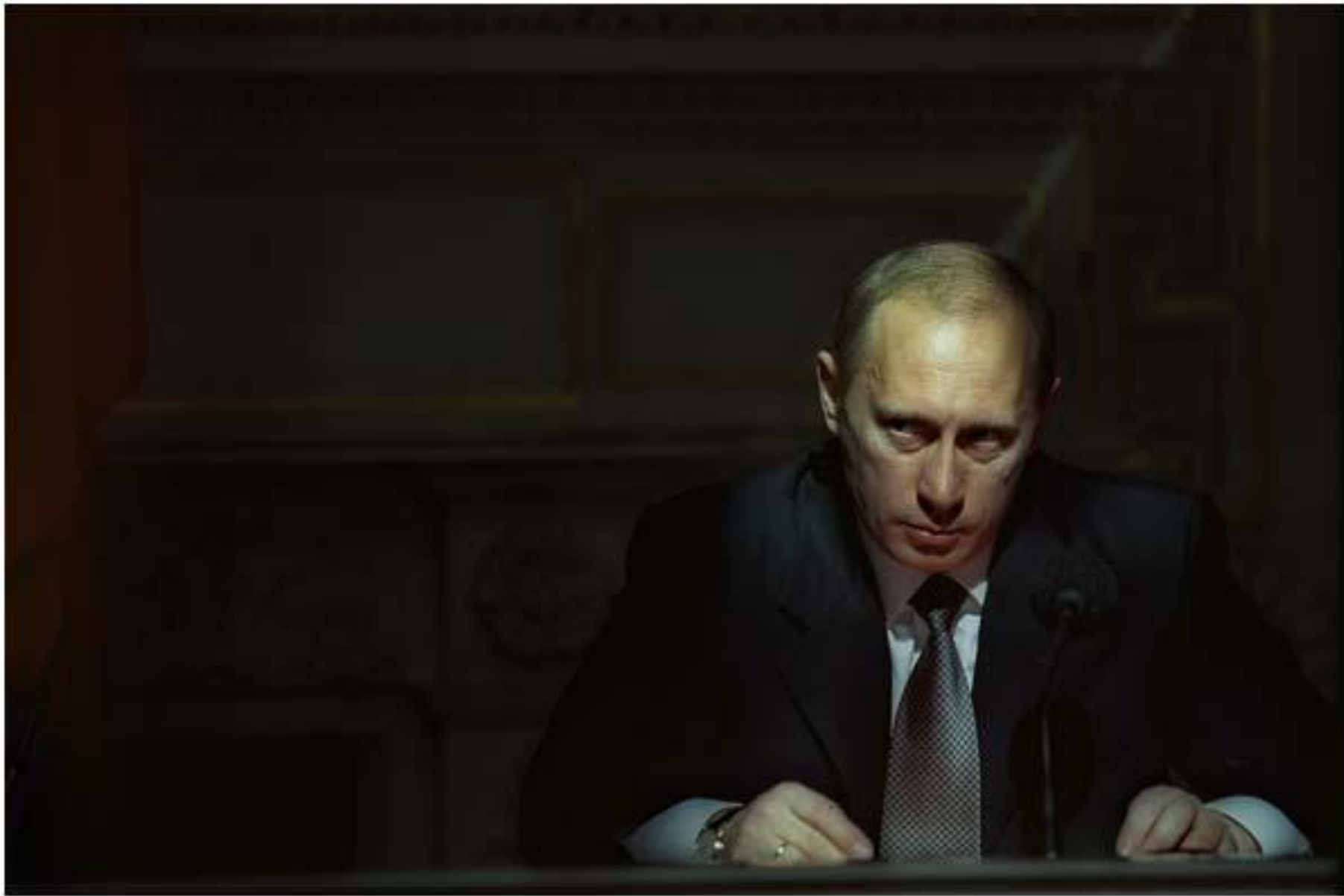
Владимир Путин май 2001