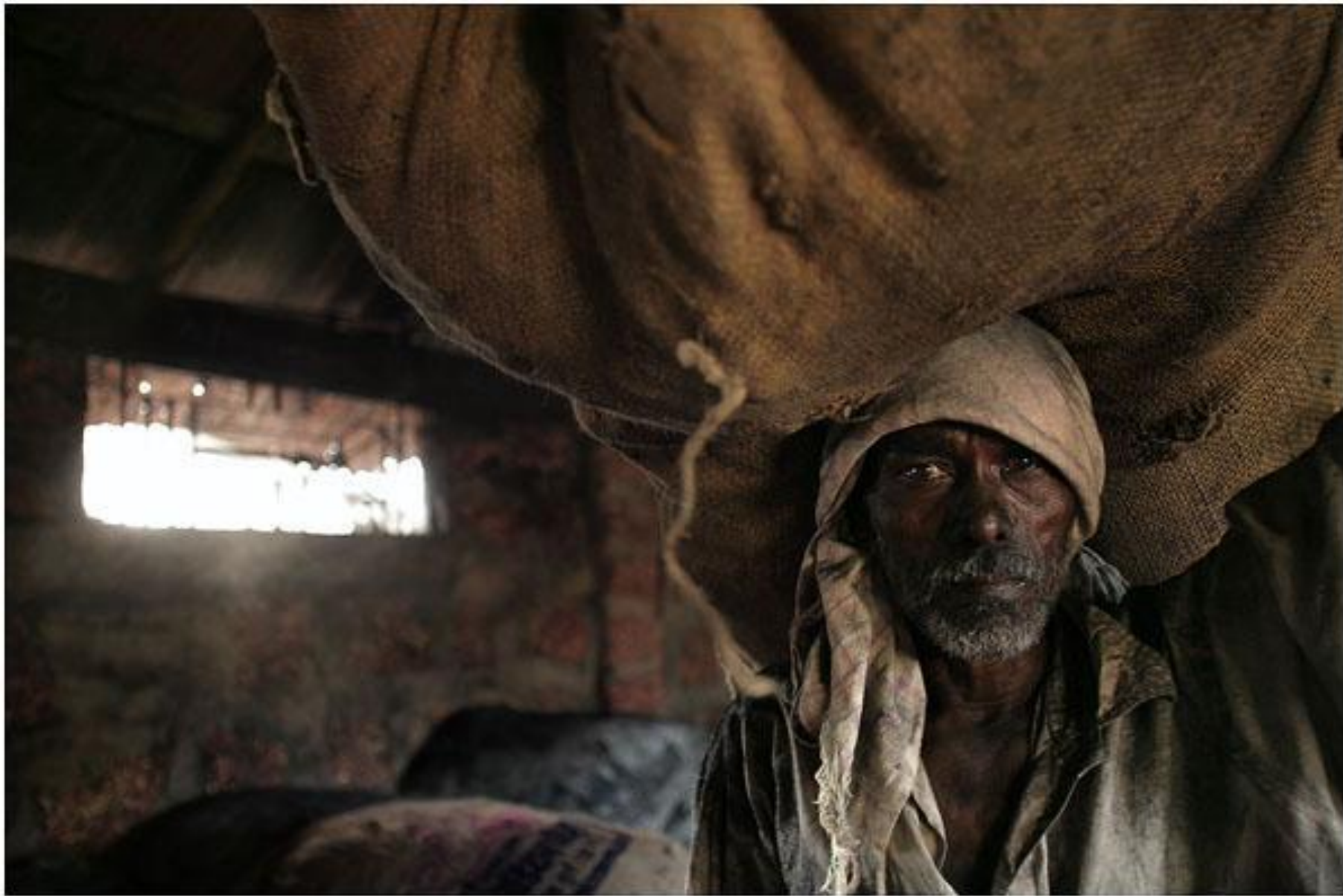
Грузчик ноябрь 2006