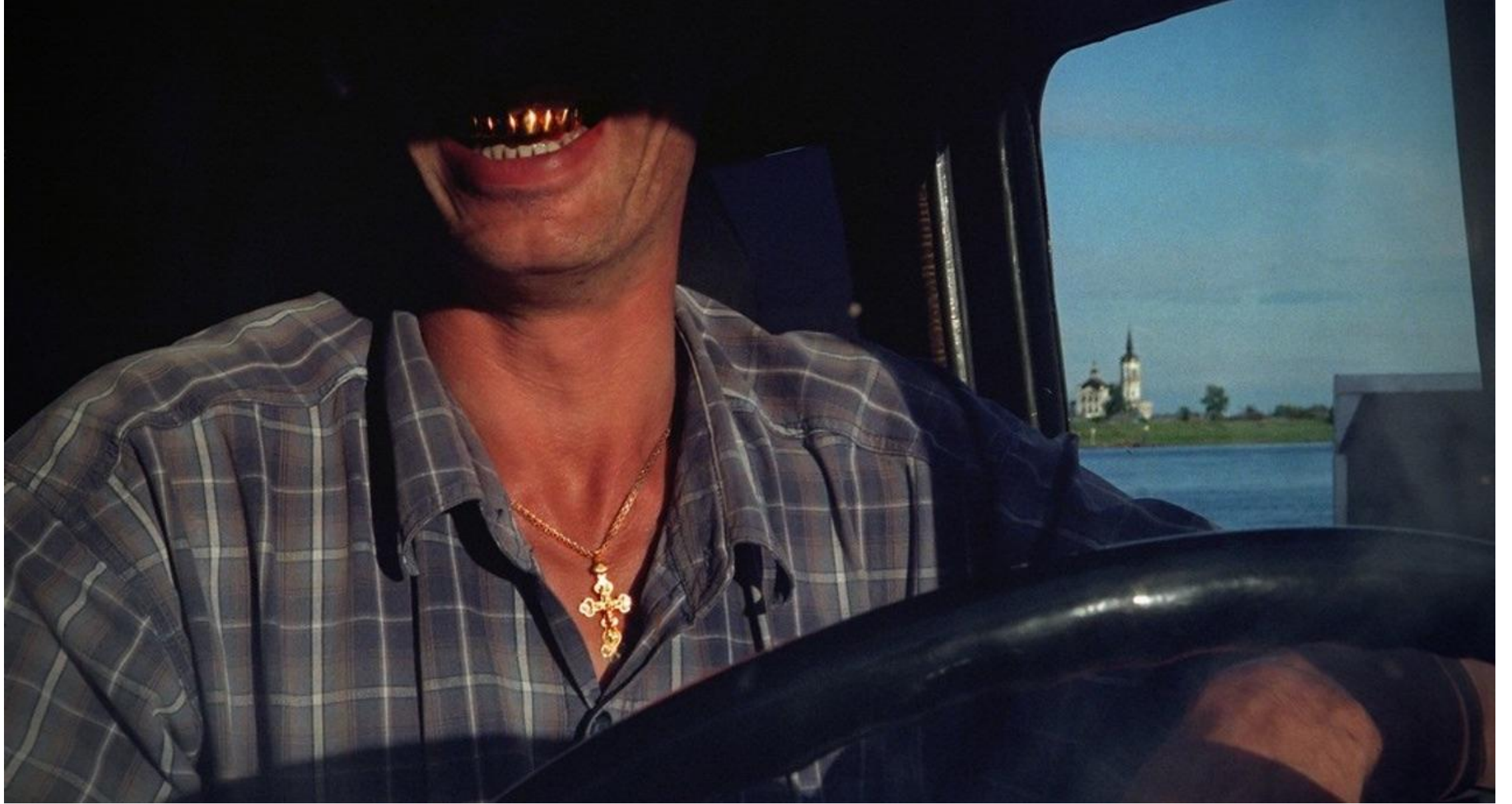
Переправа июль 2005