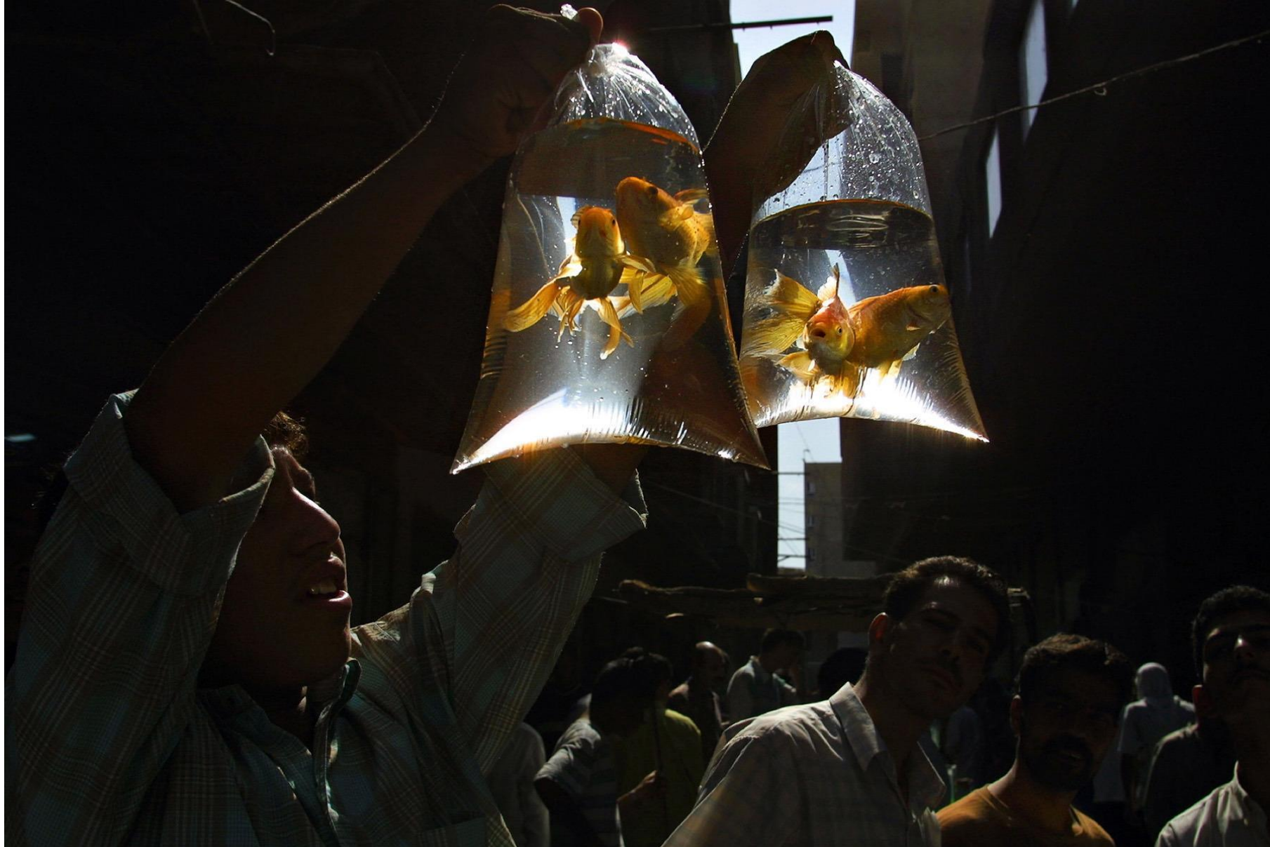
Продавец золотых рыбок сентябрь 2002