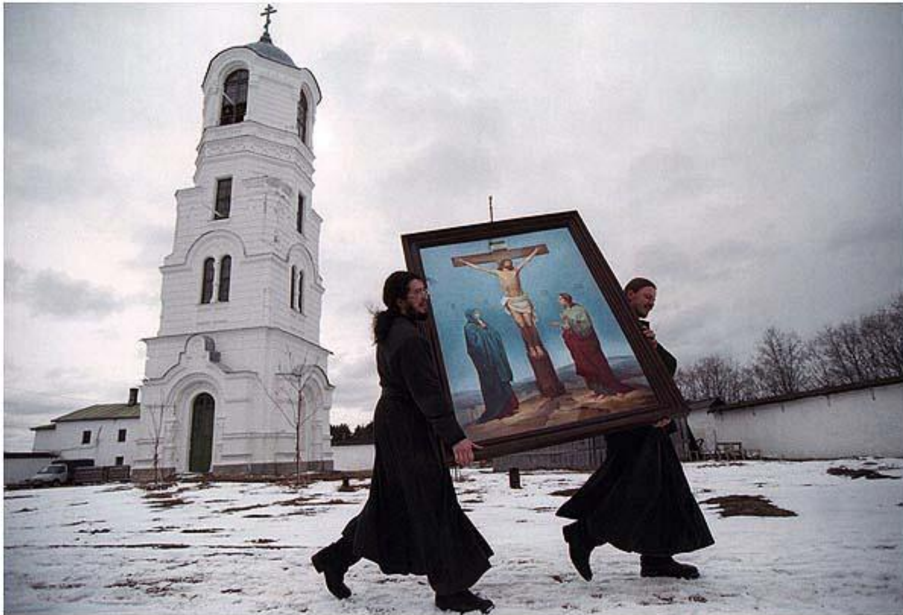
Монахи, несущие распятие апрель 2001