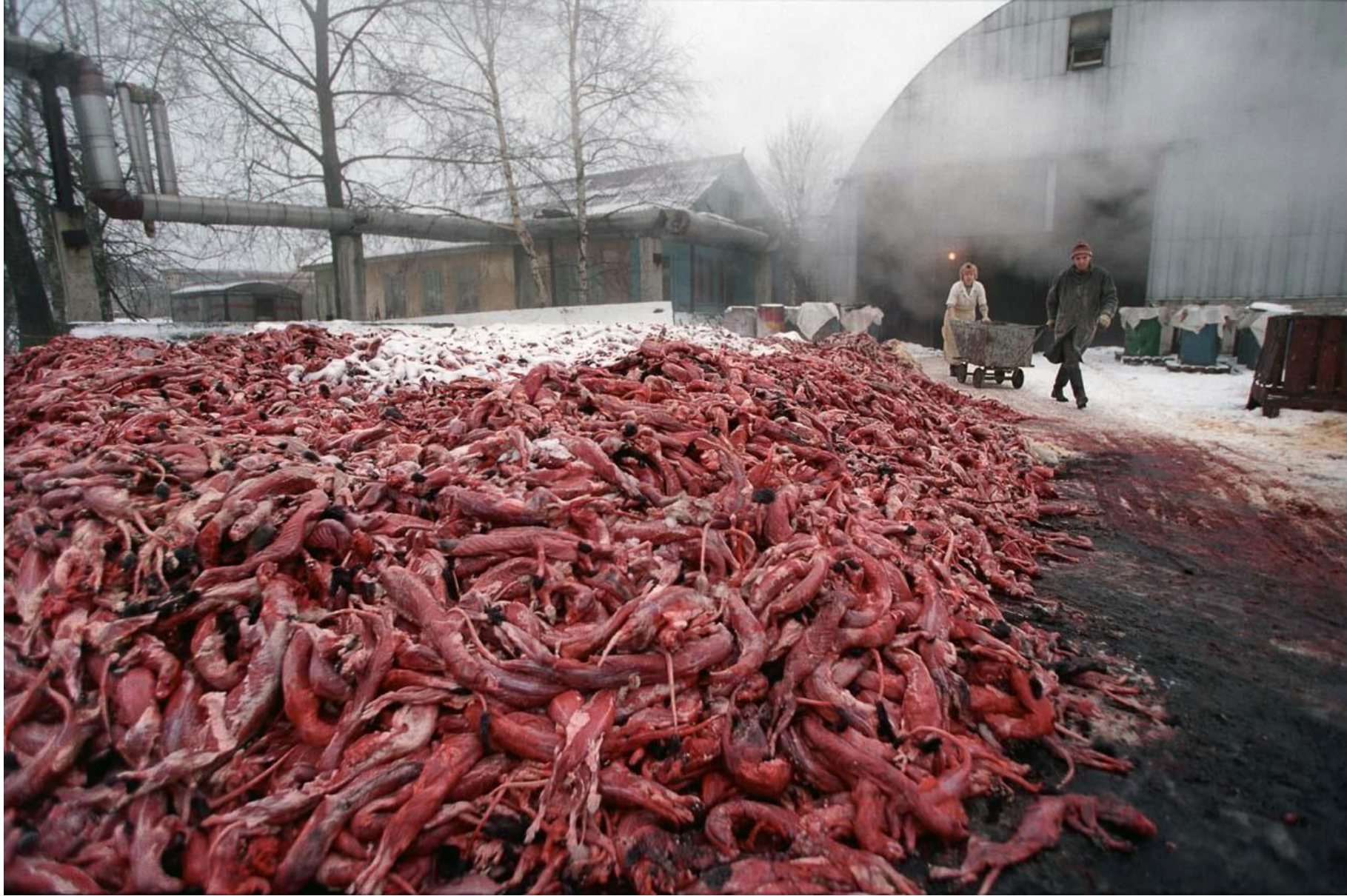
Зверосовхоз "Пионер" ноябрь 2002