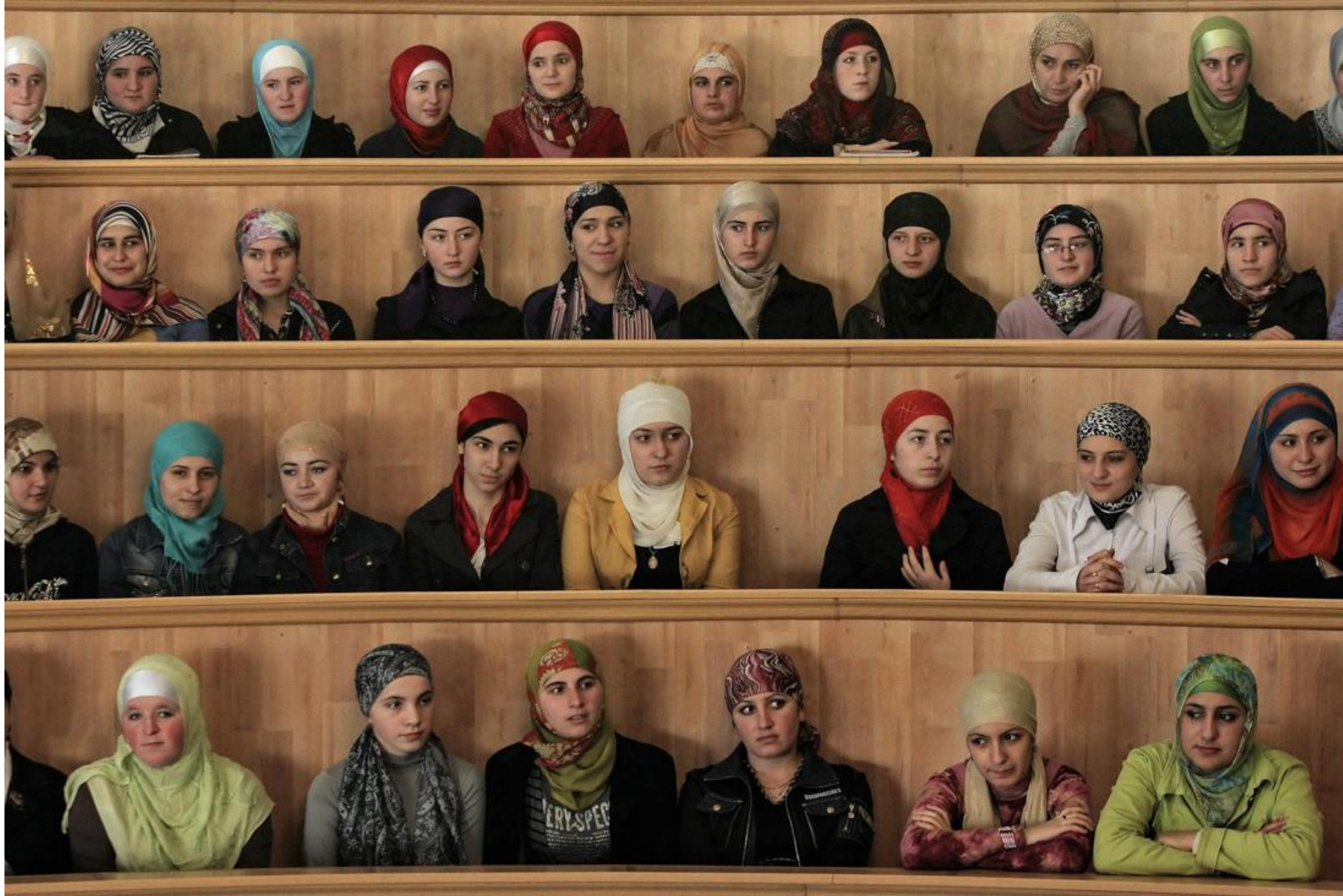
Теологический колледж апрель 2008