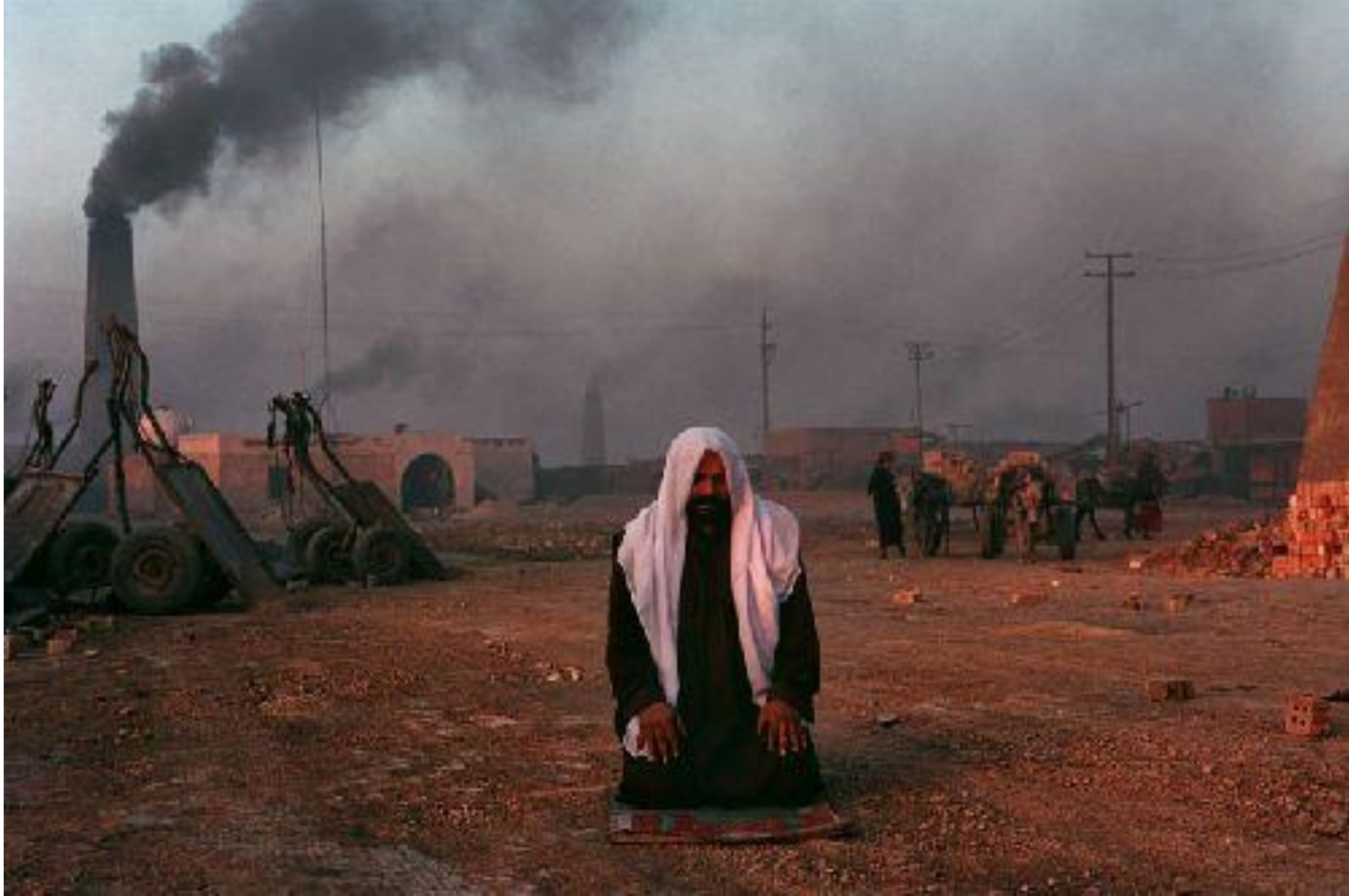
Кирпичный завод декабрь 2002