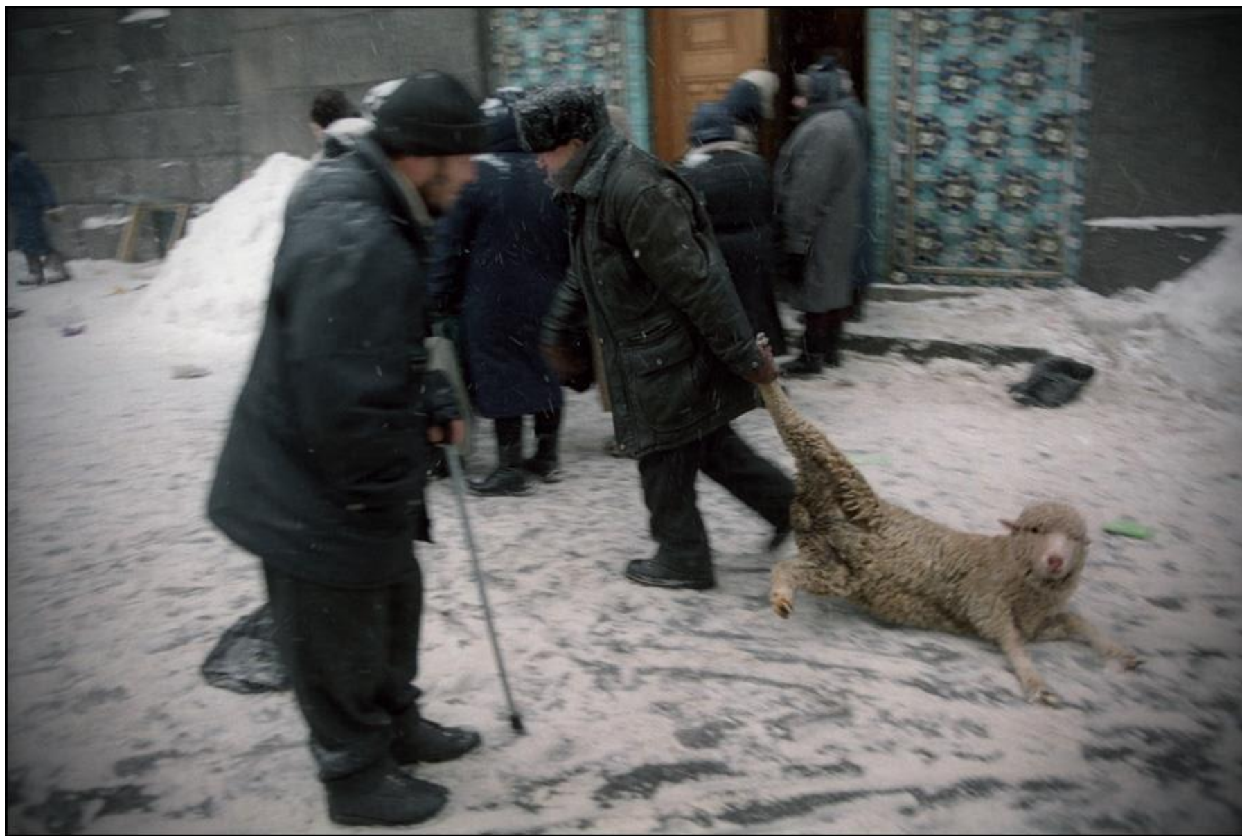
Курбан-Байрам февраль 2004