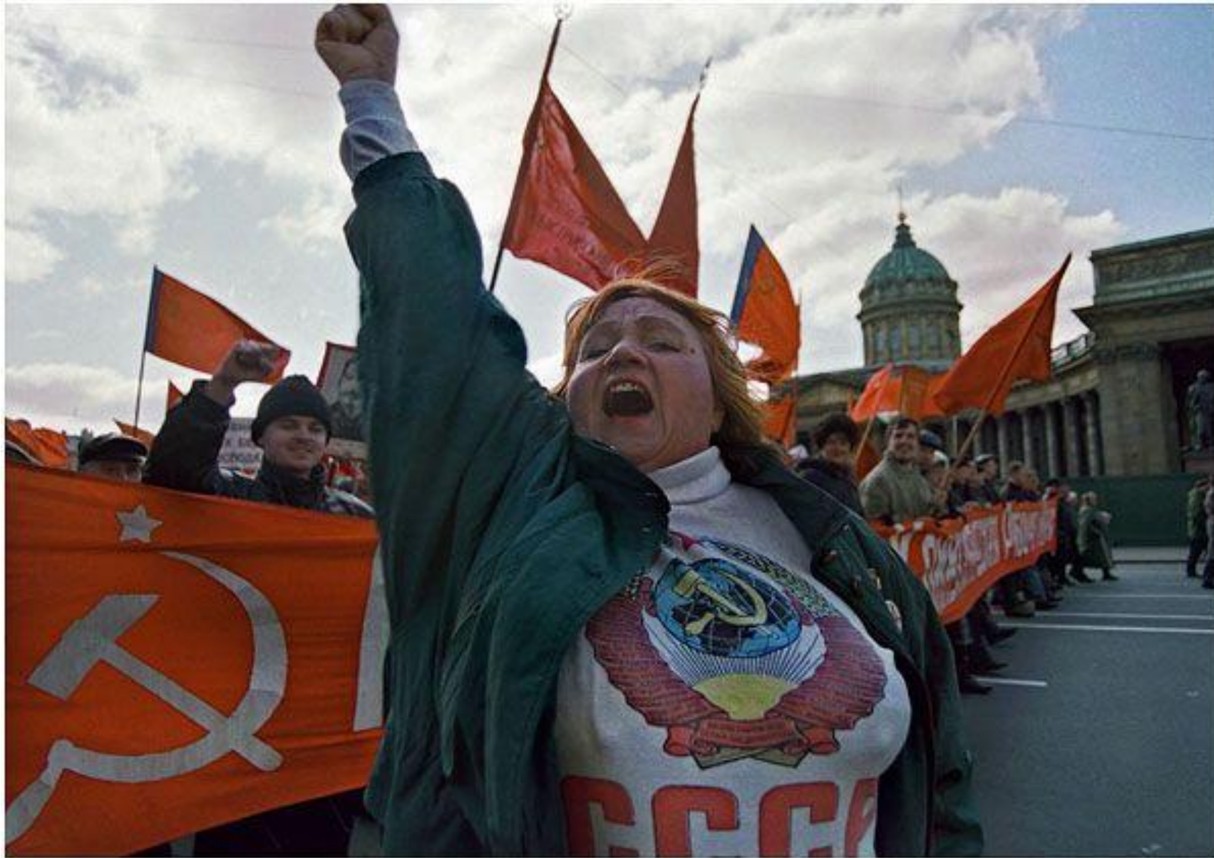
1-е Мая май 2000