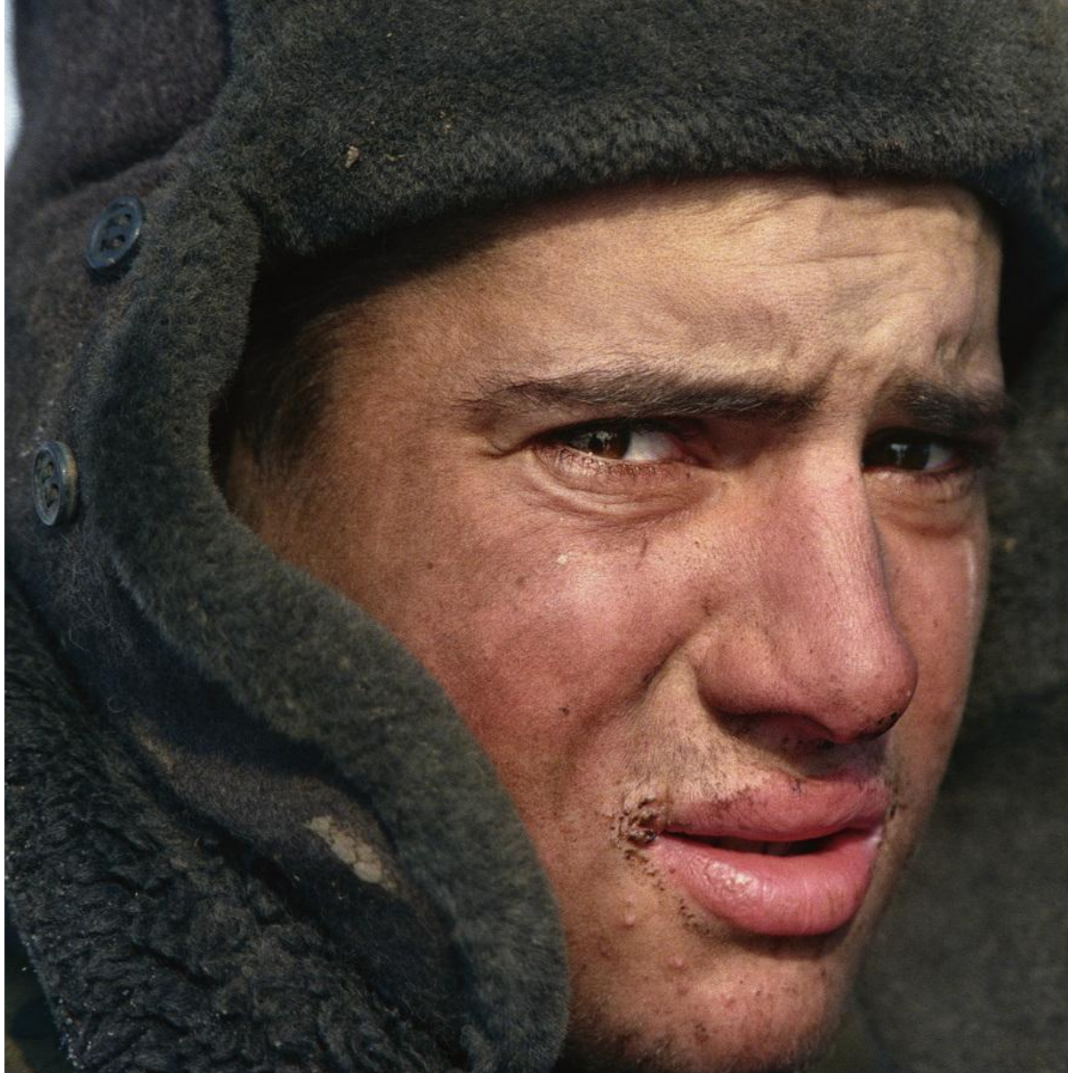
Солдतिक январь 2000