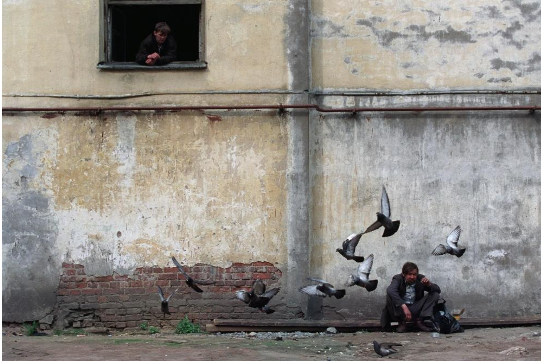
Кормление голубей май 2001