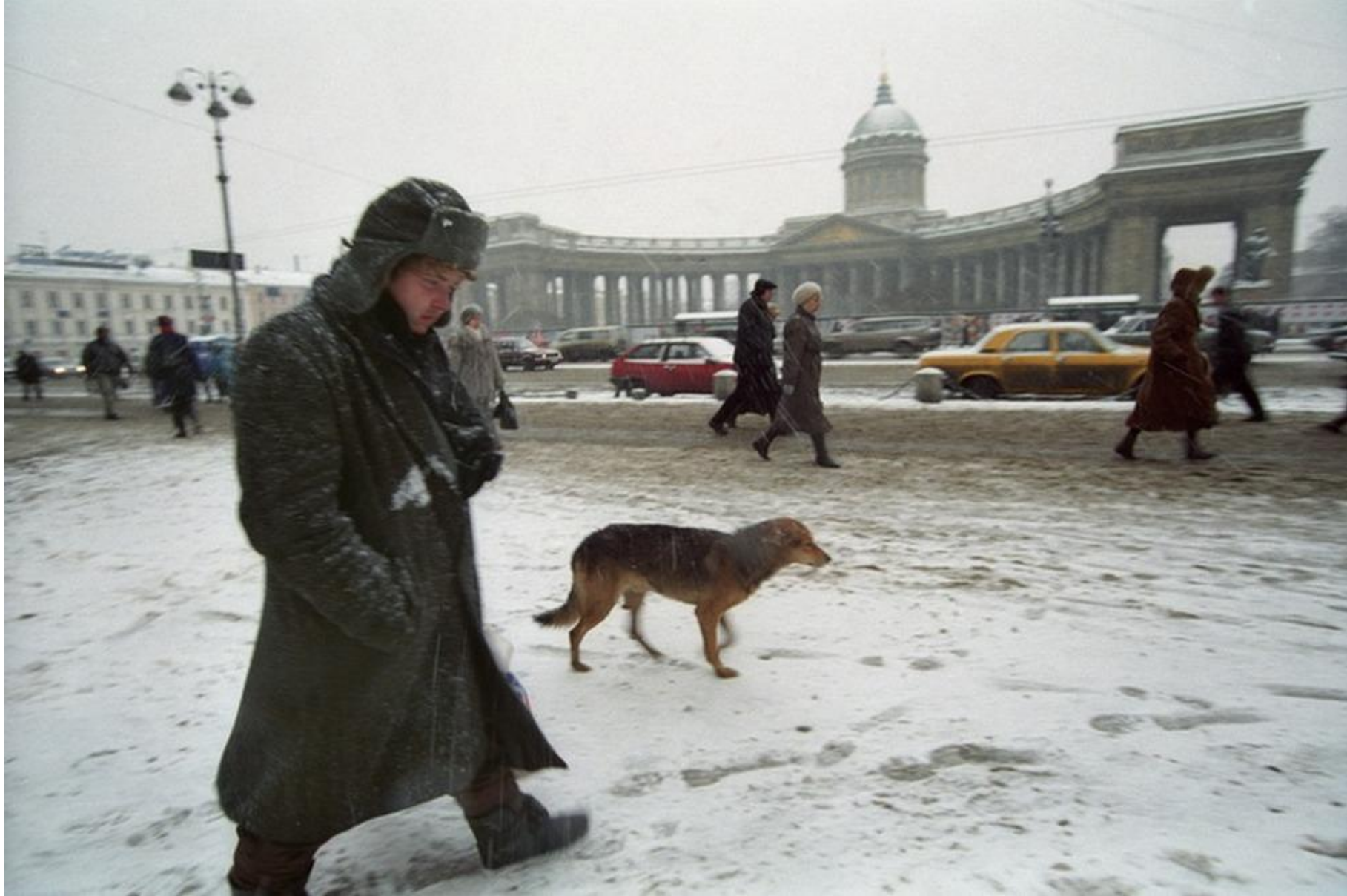
Невский ноябрь 2000