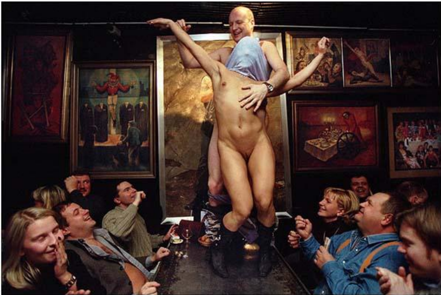
Сотрудники банка отмечают день рождения сослуживца март 2001