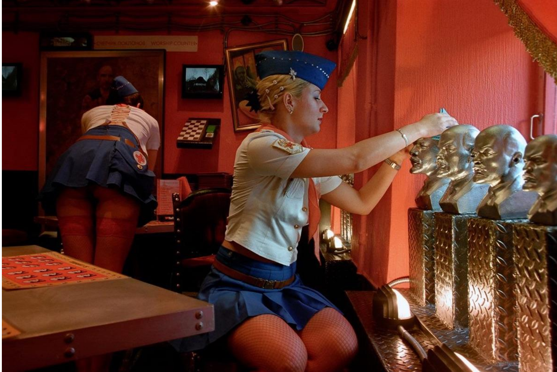
Ресторан "Зов Ильича" ноябрь 2003