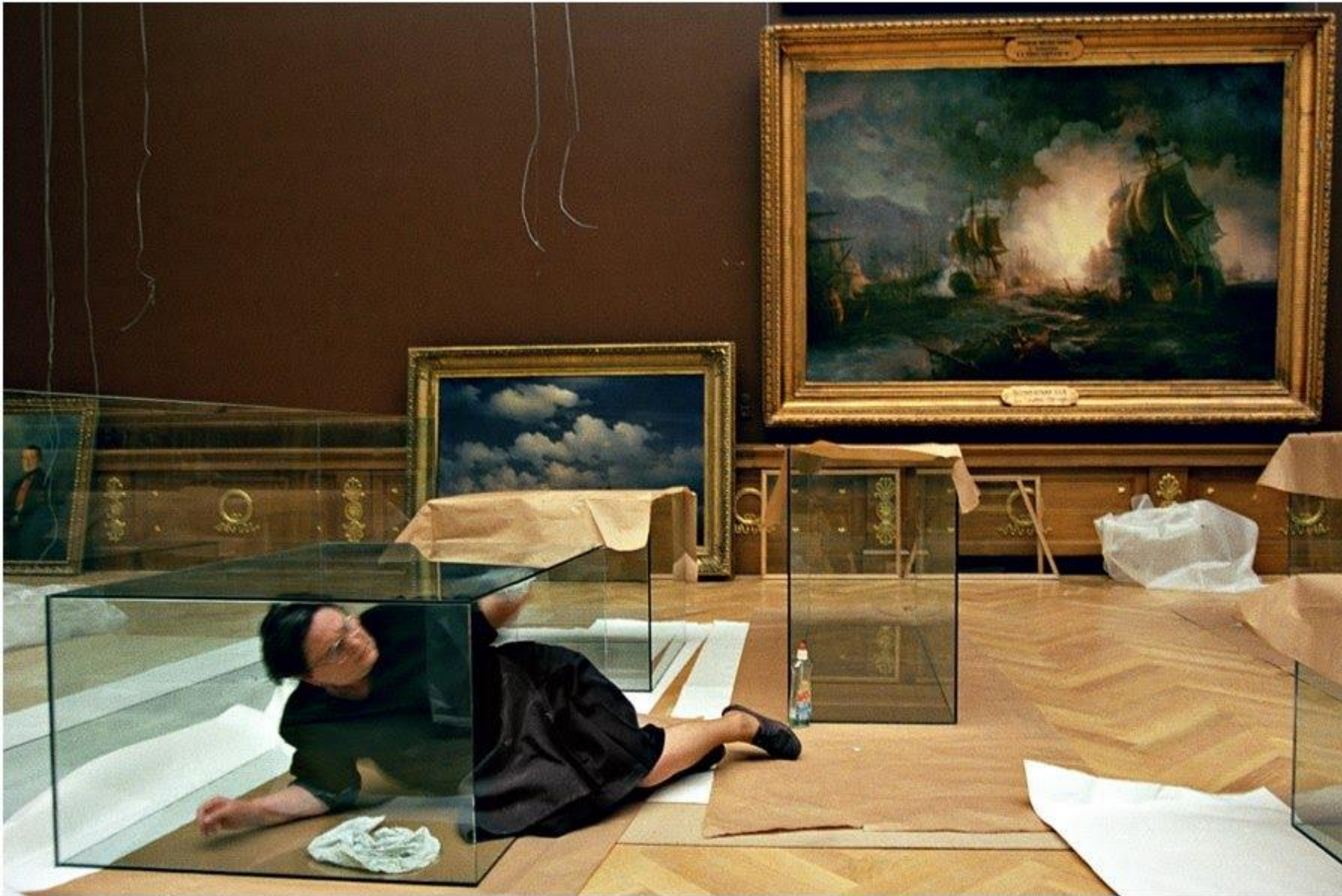
Русский музей. Подготовка к открытию выставки Айвазовского август 2000