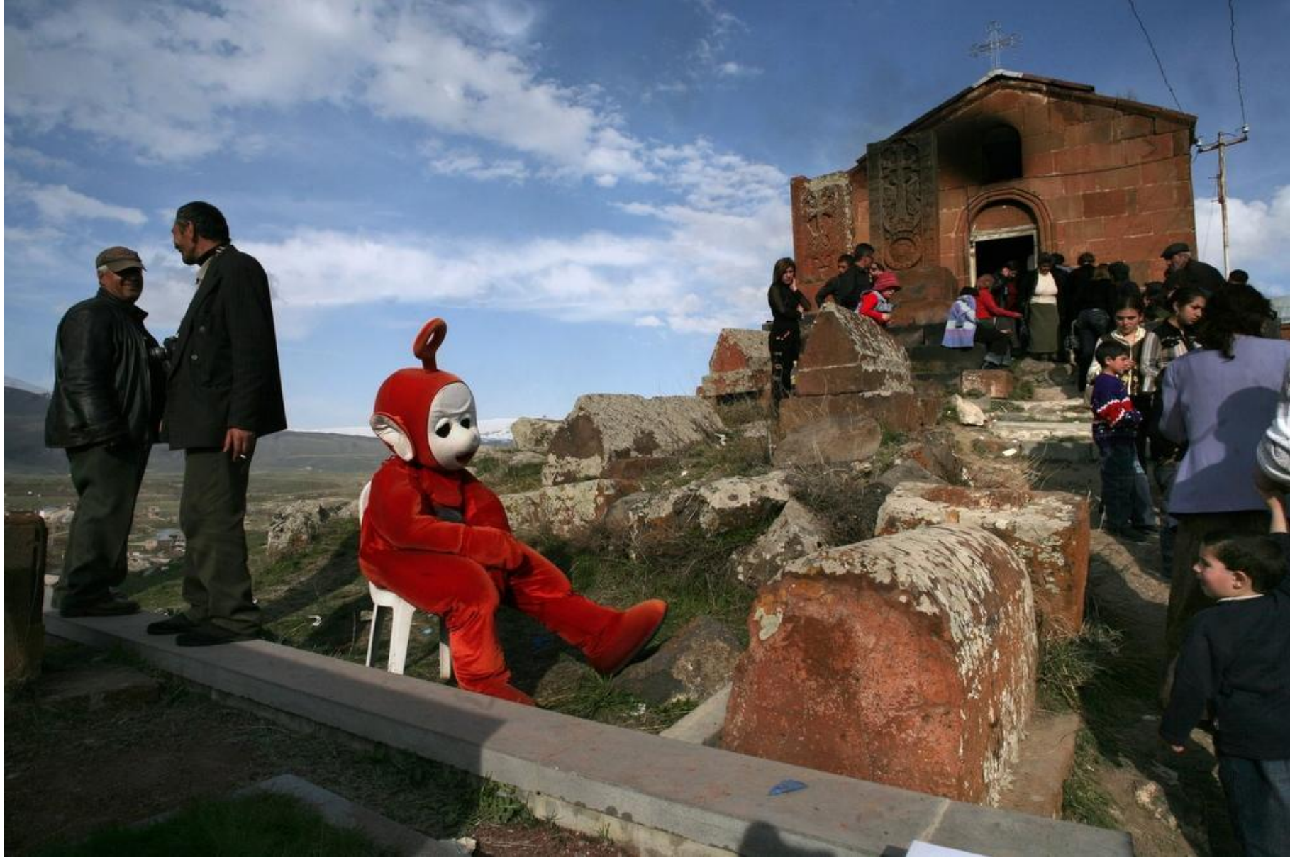
Сельская церковь май 2007