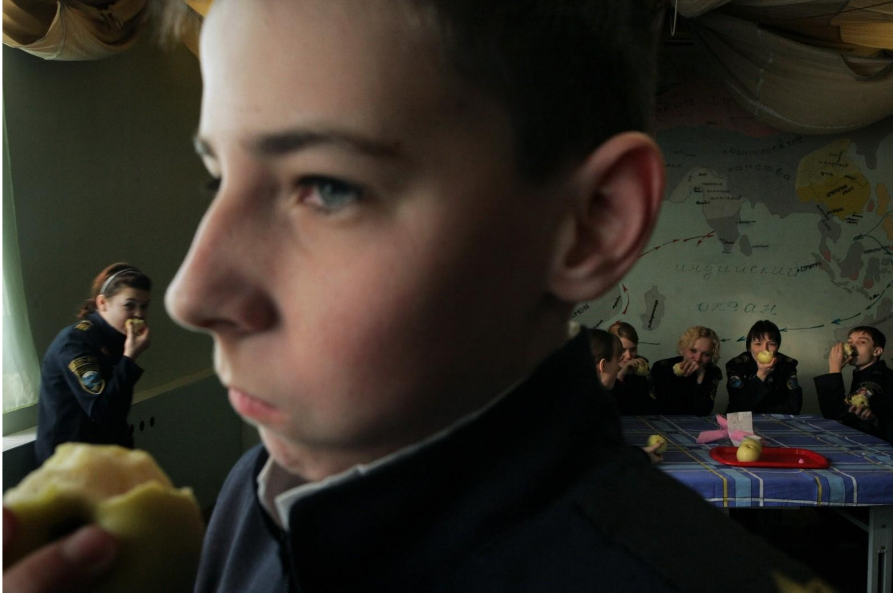
Полдник в кадетской школе январь 2008