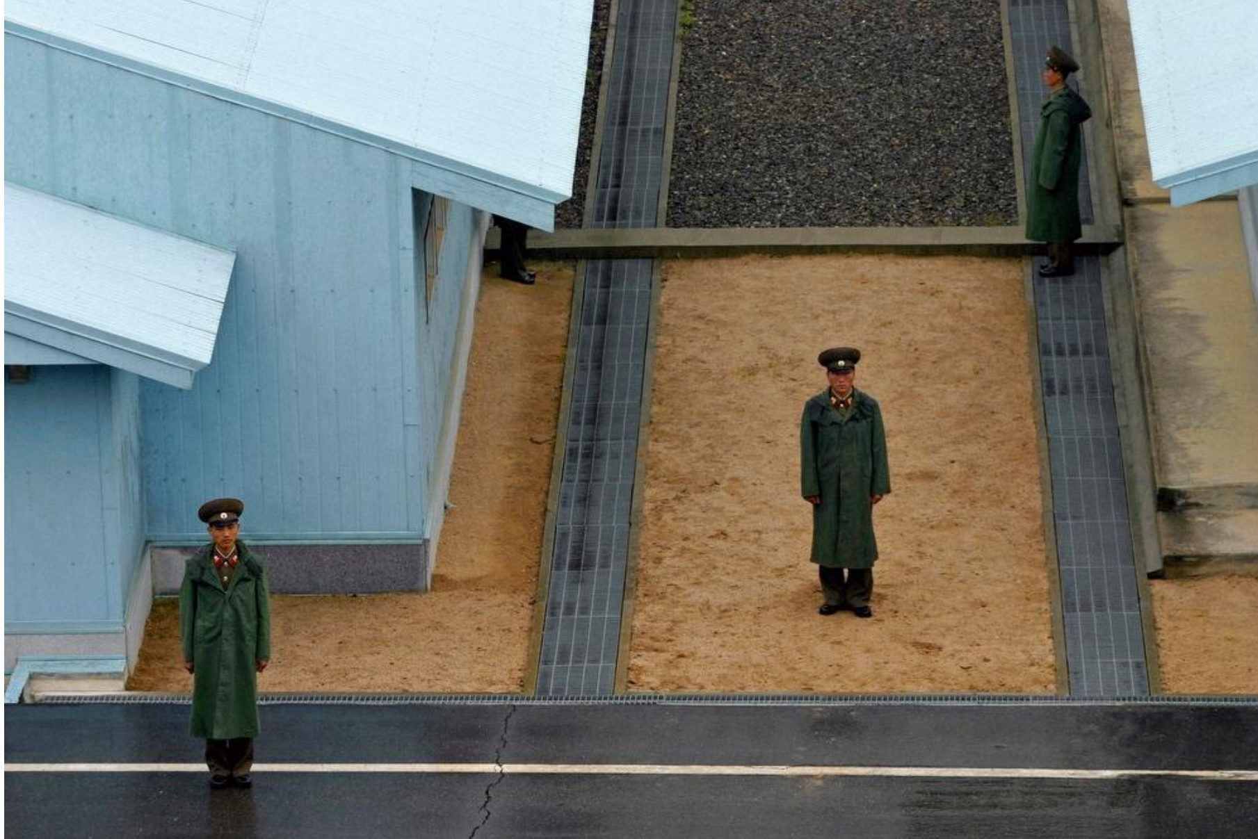
38-я параллель. Северокорейские пограничники июнь 2005