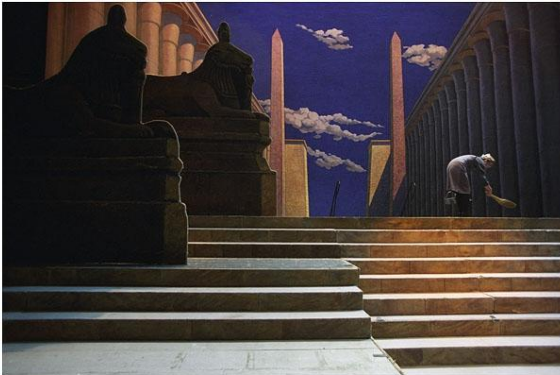
Мариинский театр март 2002