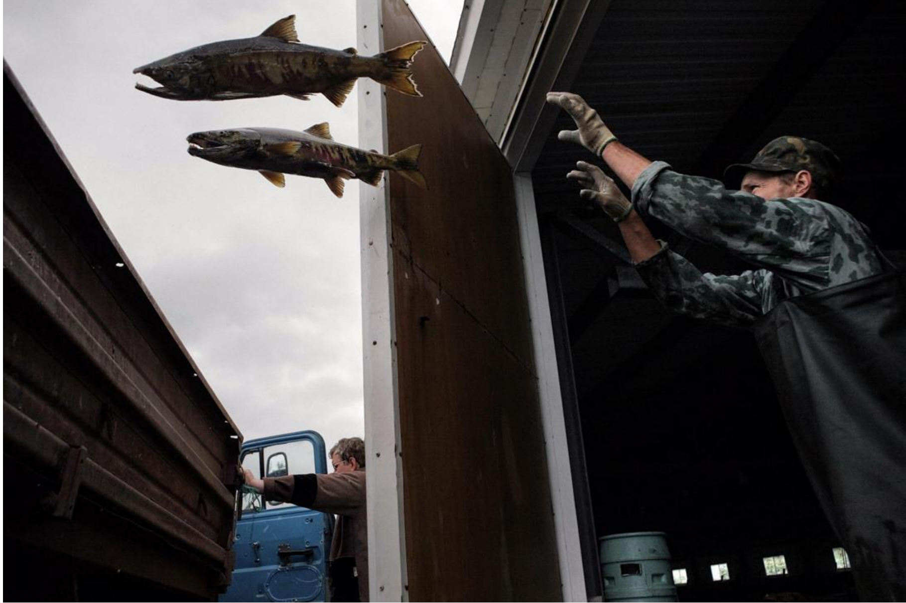
Рыбоводный завод август 2006