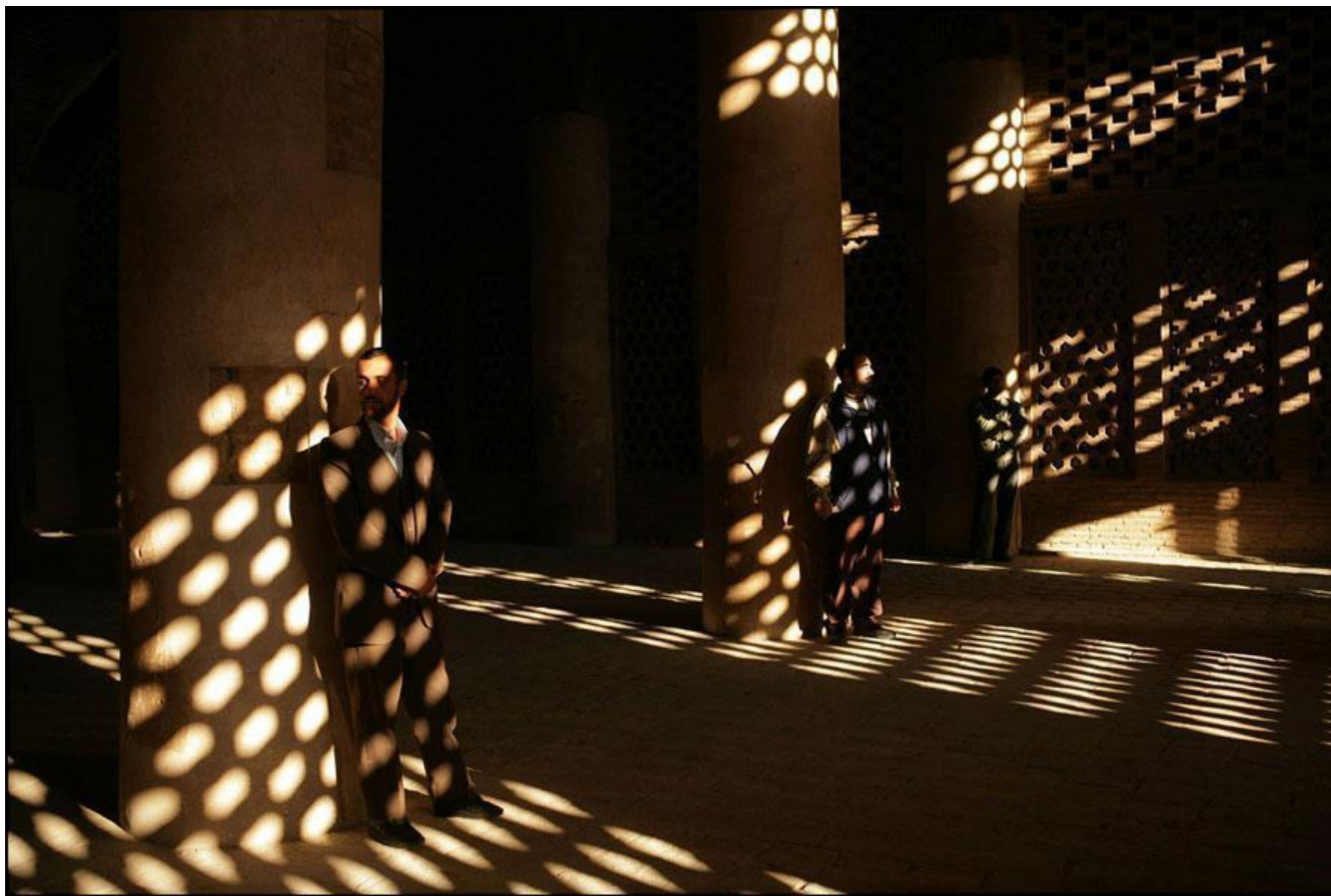
Храмовая полиция декабрь 2006