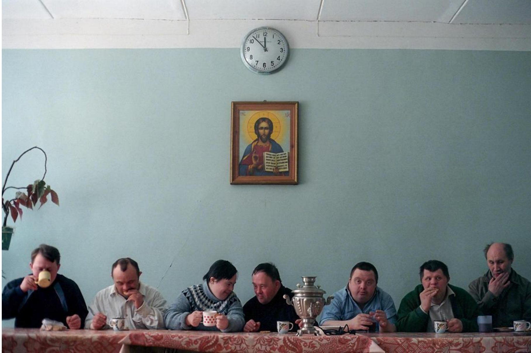
Чаепитие труппы самодеятельного "Наивного театра" при Психо-неврологическом интернате N7 апрель 2003