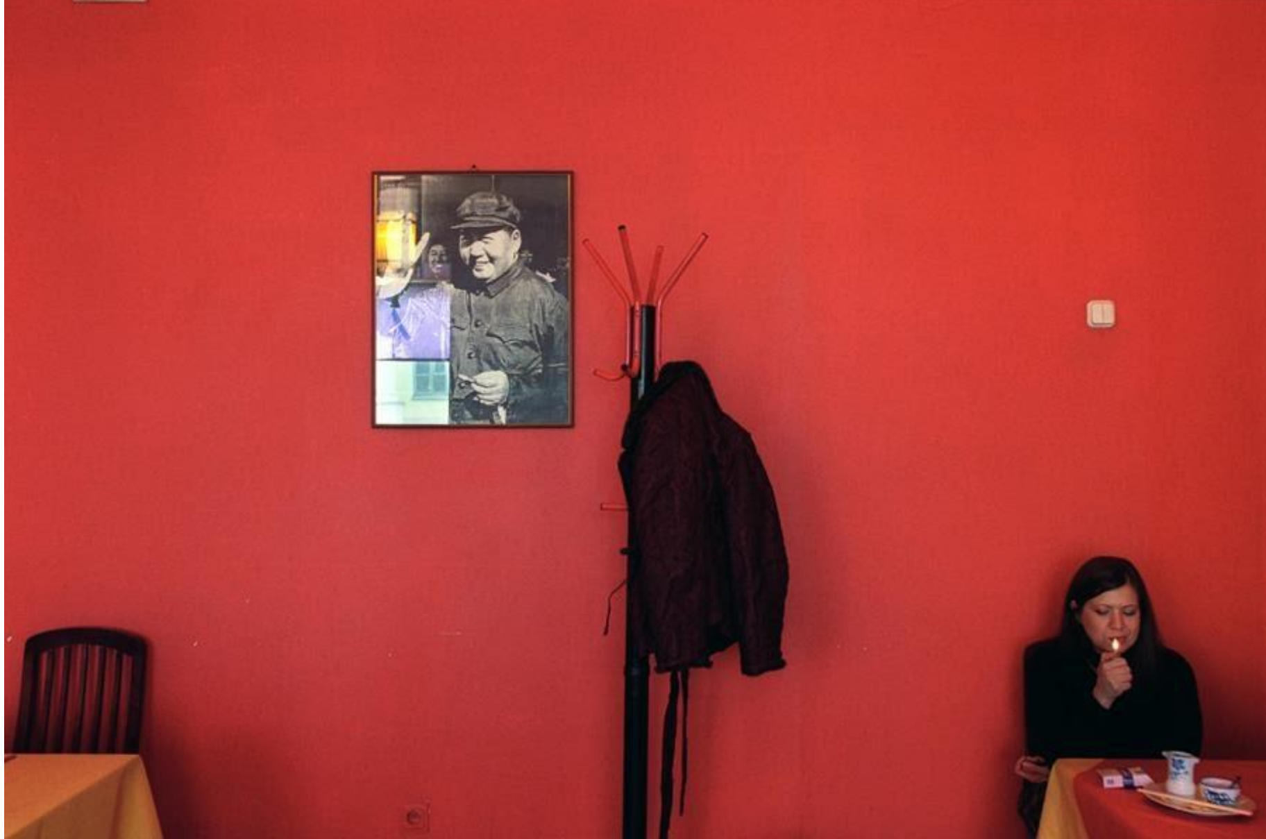
Ресторан Мао февраль 2002