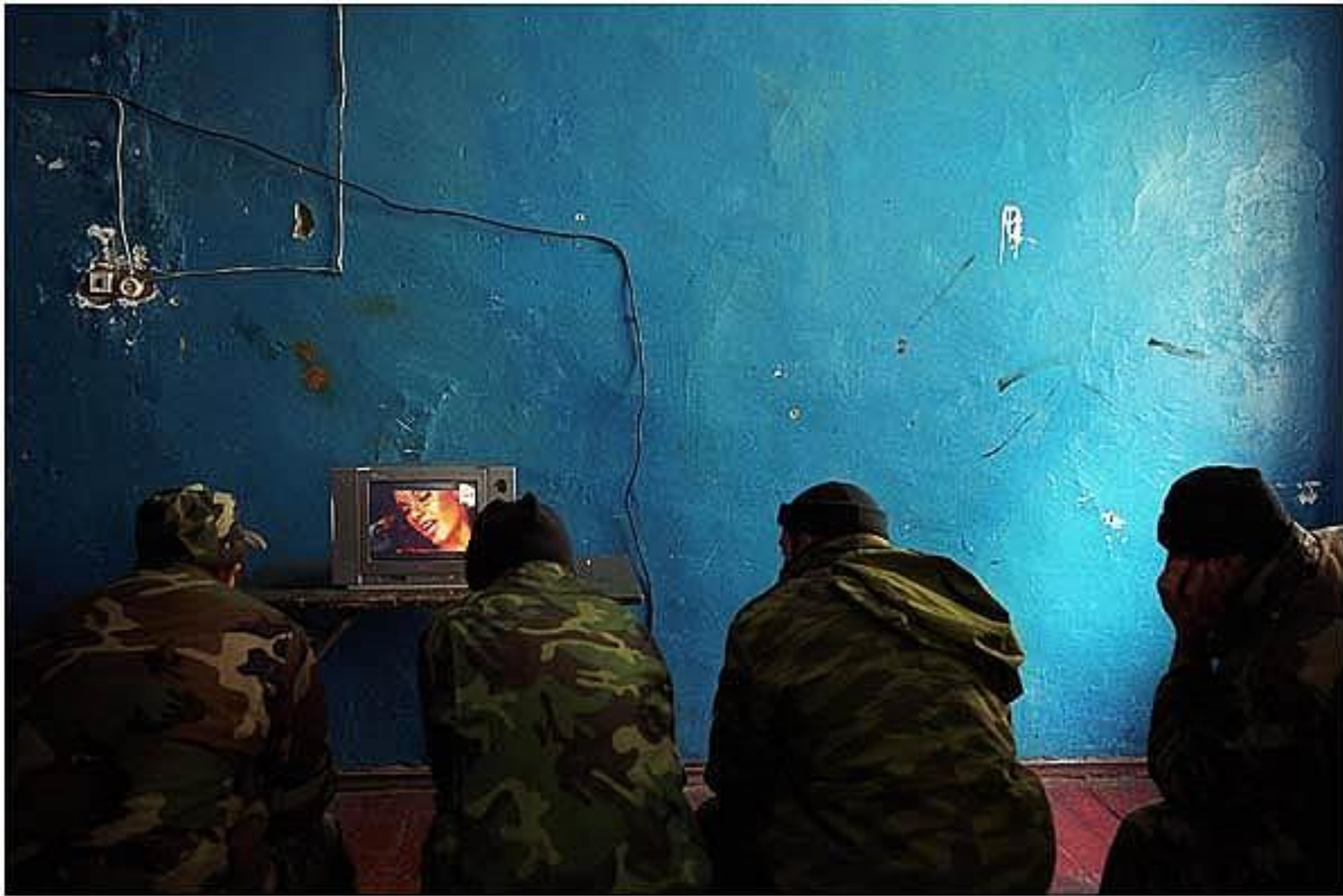
Застава февраль 2005