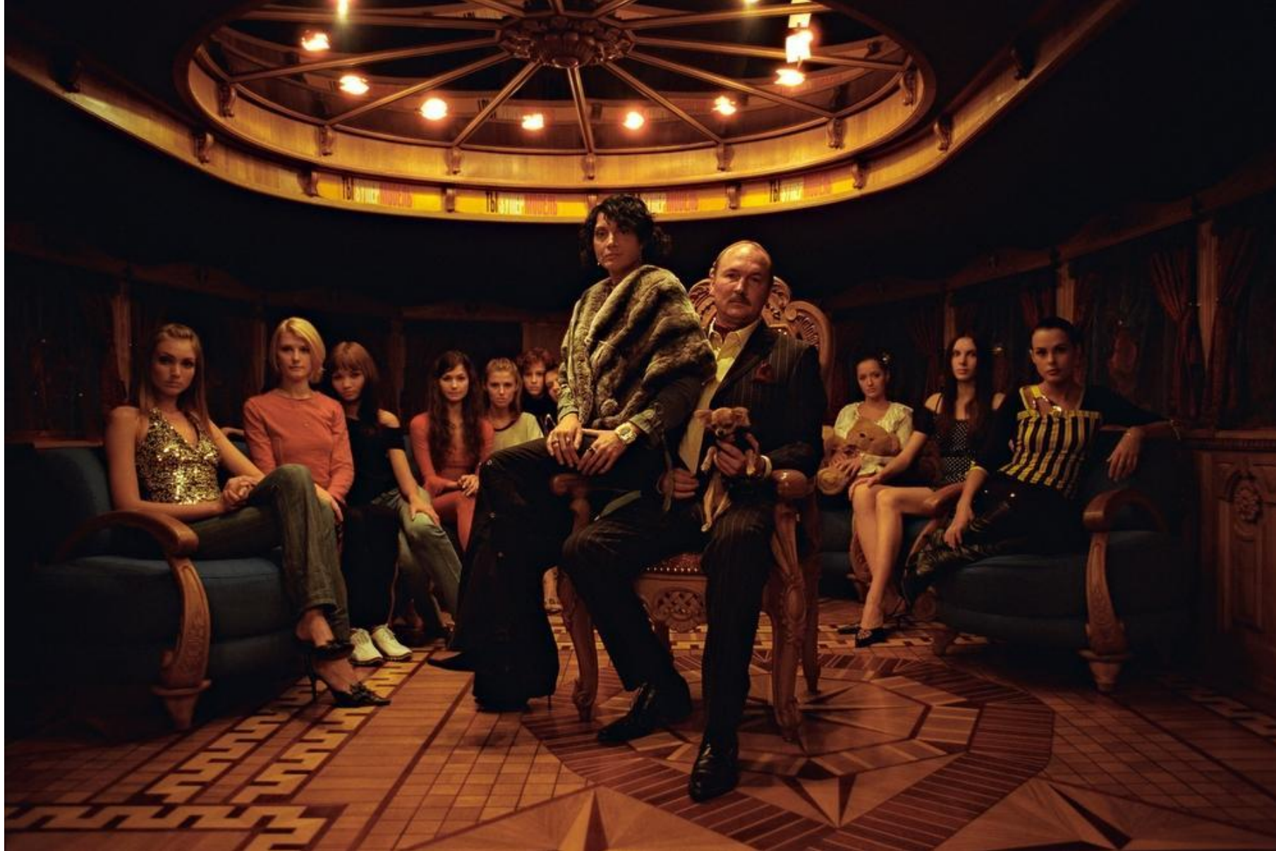
Московский бизнесмен и его жена на борту собственного теплохода октябрь 2004