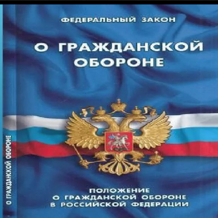
Федеральный закон "О гражданской обороне" от 12.02.1998 N 28-ФЗ

Федеральный Закон «О гражданской обороне» определяет задачи в области гражданской обороны и правовые основы их осуществления.