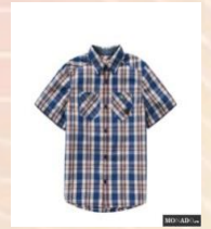
das Kleid das T-Shirt die Schuhe die Socken die Mütze das Hemd