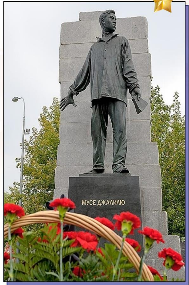
Памятник Мусе Джалилю в Москве

В 1956 году посмертно был удостоен звания Героя Советского Союза, в 1957 году стал лауреатом Ленинской премии. В 1966 году отмечался первый юбилей поэта, организованный в колхозе, названном его именем, на его родине, в селе Мустафино, где присутствовали многие знаменитые писатели и родственники из разных стран.