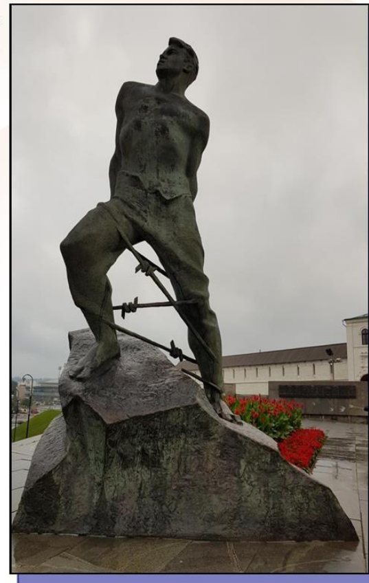
Памятник Муса Джалиль в Татарстане, Казань