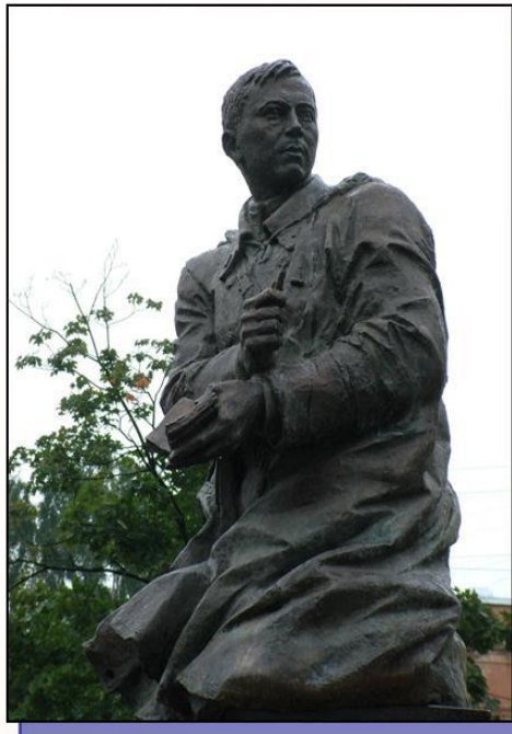
Памятник Муса Джалиль в Санкт-Петербурге

Хотя стихи «Варварство» и «Чулочки» должны изучаться в школе наряду с «Букварём» и таблицей умножения. Перед расстрелом фашисты согнали всех перед ямой и заставили раздеться. Трёхлетняя малышка посмотрела немцу прямо в глаза и спросила: «Дядя, а чулочки мне снимать?» Мурашки по коже, и кажется, что в одном маленьком стихотворении собрана вся боль советского народа, пережившего ужасы войны. И как глубоко передал эту боль великий и талантливый поэт Муса Джалиль.