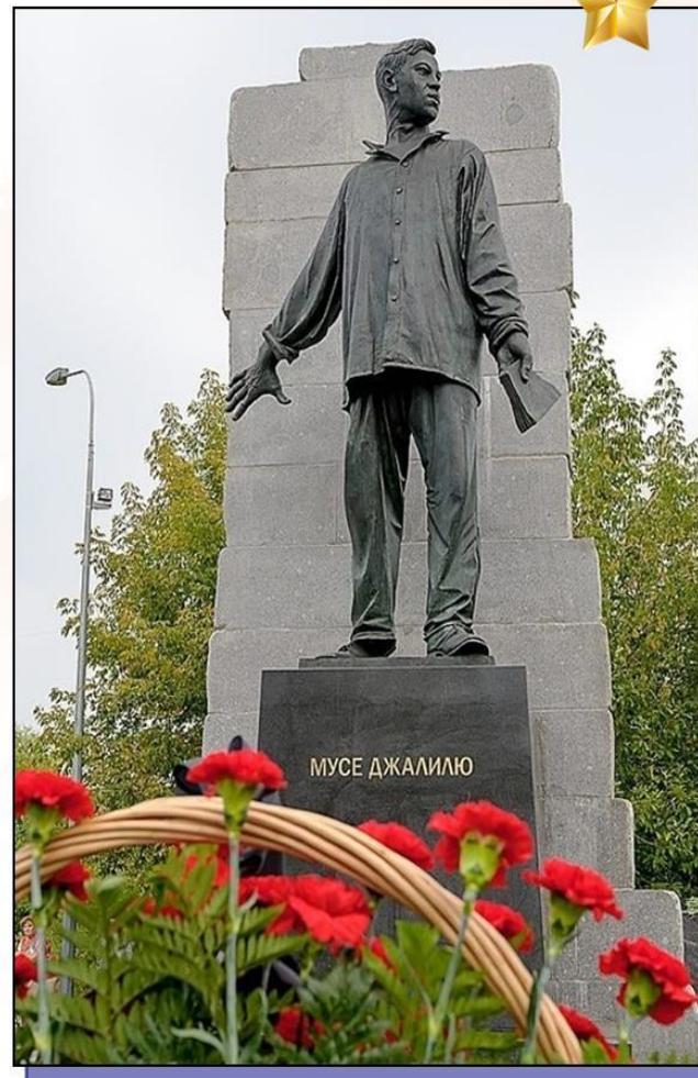
Памятник Мусе Джалилю в Москве

В 1956 году посмертно был удостоен звания Героя Советского Союза, в 1957 году стал лауреатом Ленинской премии. В 1966 году отмечался первый юбилей поэта, организованный в колхозе, названном его именем, на его родине, в селе Мустафино, где присутствовали многие знаменитые писатели и родственники из разных стран.