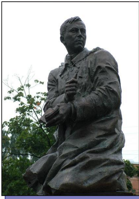
Памятник Муса Джалиль в Санкт-Петербурге

Хотя стихи «Варварство» и «Чулочки» должны изучаться в школе наряду с «Букварём» и таблицей умножения. Перед расстрелом фашисты согнали всех перед ямой и заставили раздеться. Трёхлетняя малышка посмотрела немцу прямо в глаза и спросила: «Дядя, а чулочки мне снимать?» Мурашки по коже, и кажется, что в одном маленьком стихотворении собрана вся боль советского народа, пережившего ужасы войны. И как глубоко передал эту боль великий и талантливый поэт Муса Джалиль.