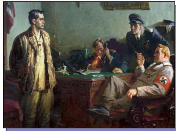
Картина Хариса Абдрахмановича Якупова «Перед приговором», на которой изображен поэт Муса Джалиль, казненный фашистами в берлинской тюрьме в 1944 году.

В конце лета 1943 года подпольщики готовили побег многих заключённых. Но нашёлся предатель. Немцы арестовали Джалиля. За то, что он был участником и организатором подполья, немцы казнили его 25 августа 1944 года. Казнь прошла в берлинской тюрьме Плётцензее на гильотине.