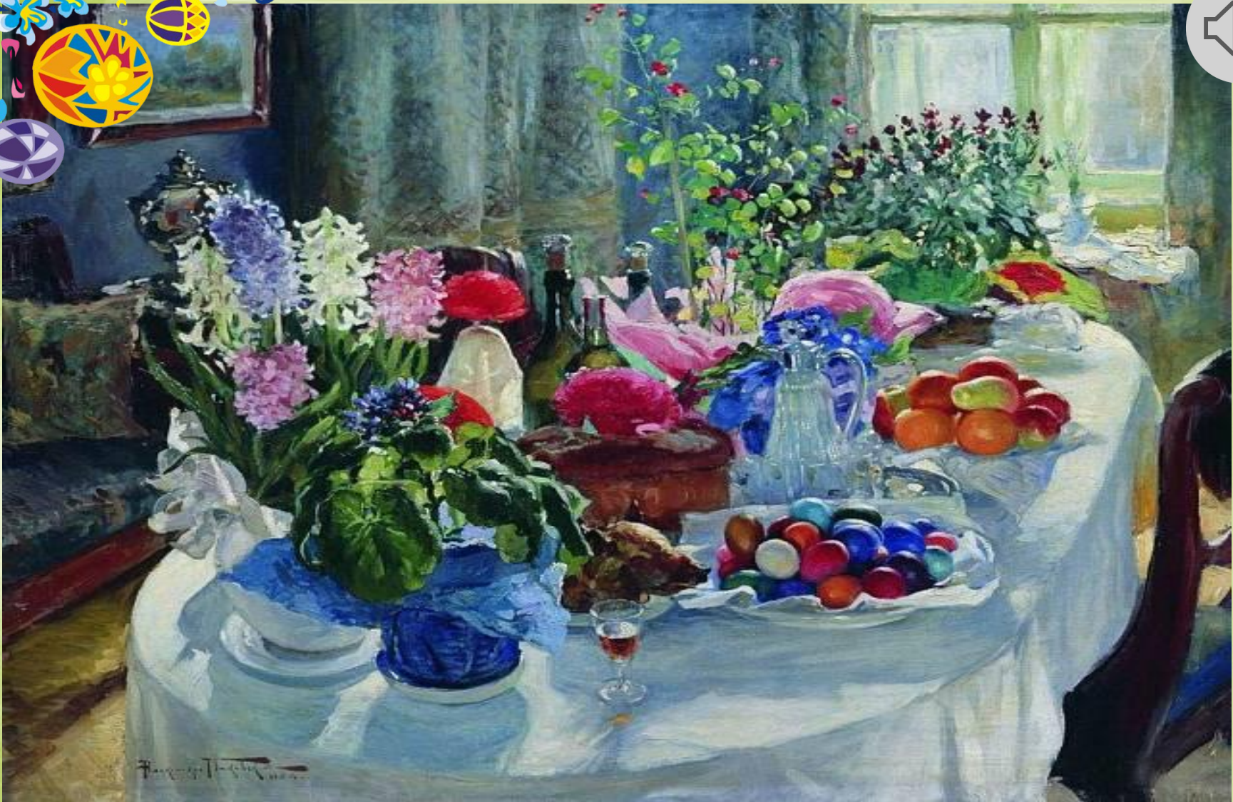
Пасхальный стол отличался праздничным великолепием, был обильным и очень красивым