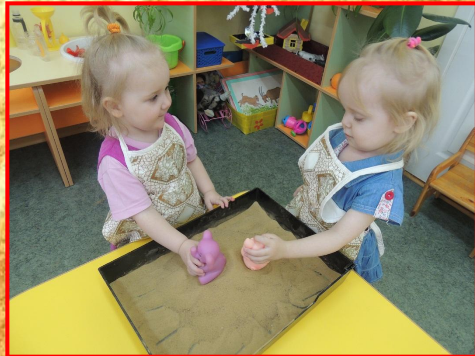
«Игрушки катаются с горки»