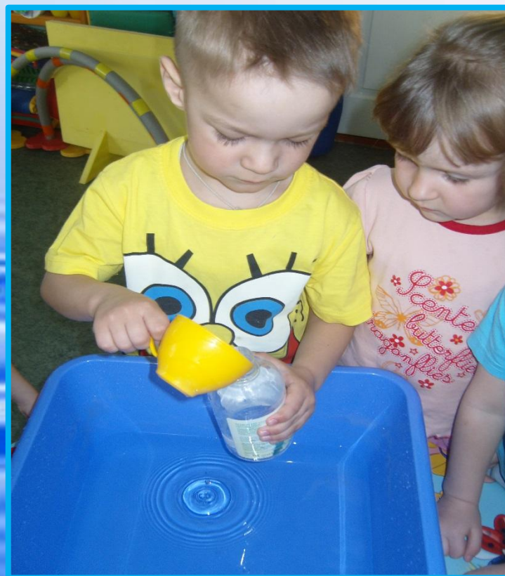
« Переливалочки »