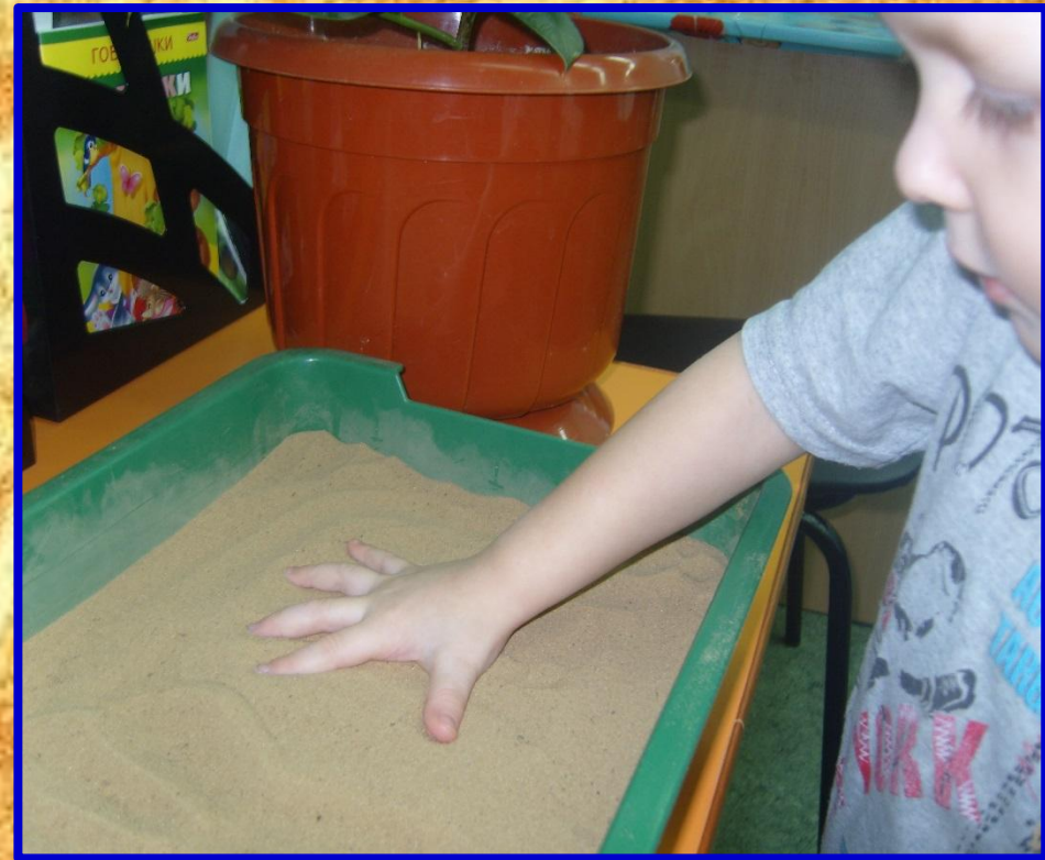
«Отпечатки наших рук»