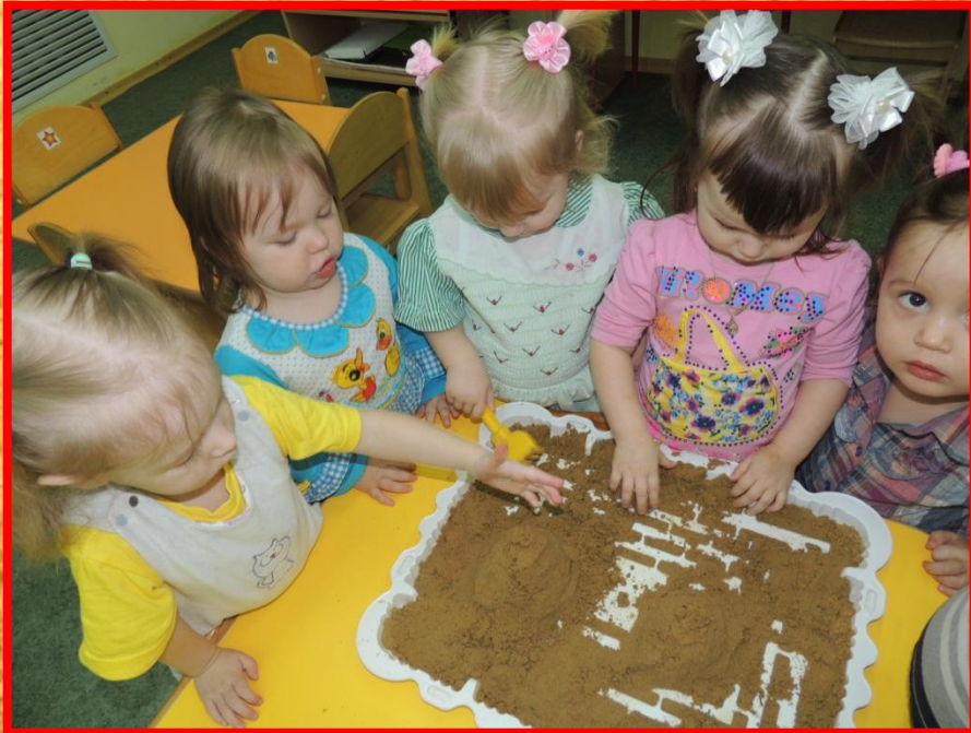
«Чья горка больше»