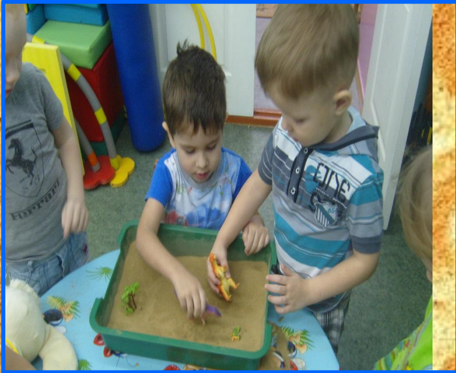
«Норки для зверюшек»