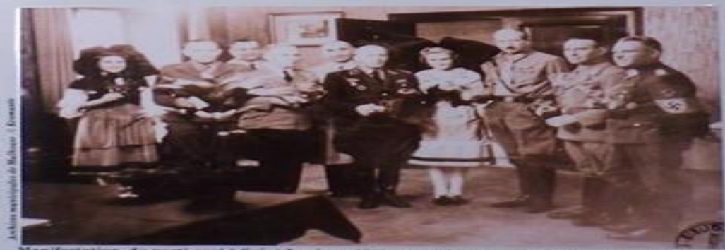
Manifestation du parti nazi à Saint-Louis en 1942, avec l'Obergruppenführer des SA August Veranmlung der NSDAP in St-Louis 1942 mit dem Obergruppenführer der SA August Wilhelm Prinz von Preußen