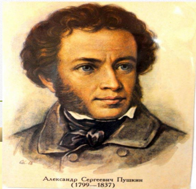
Александр Сергеевич Пушкин (1799—1837)