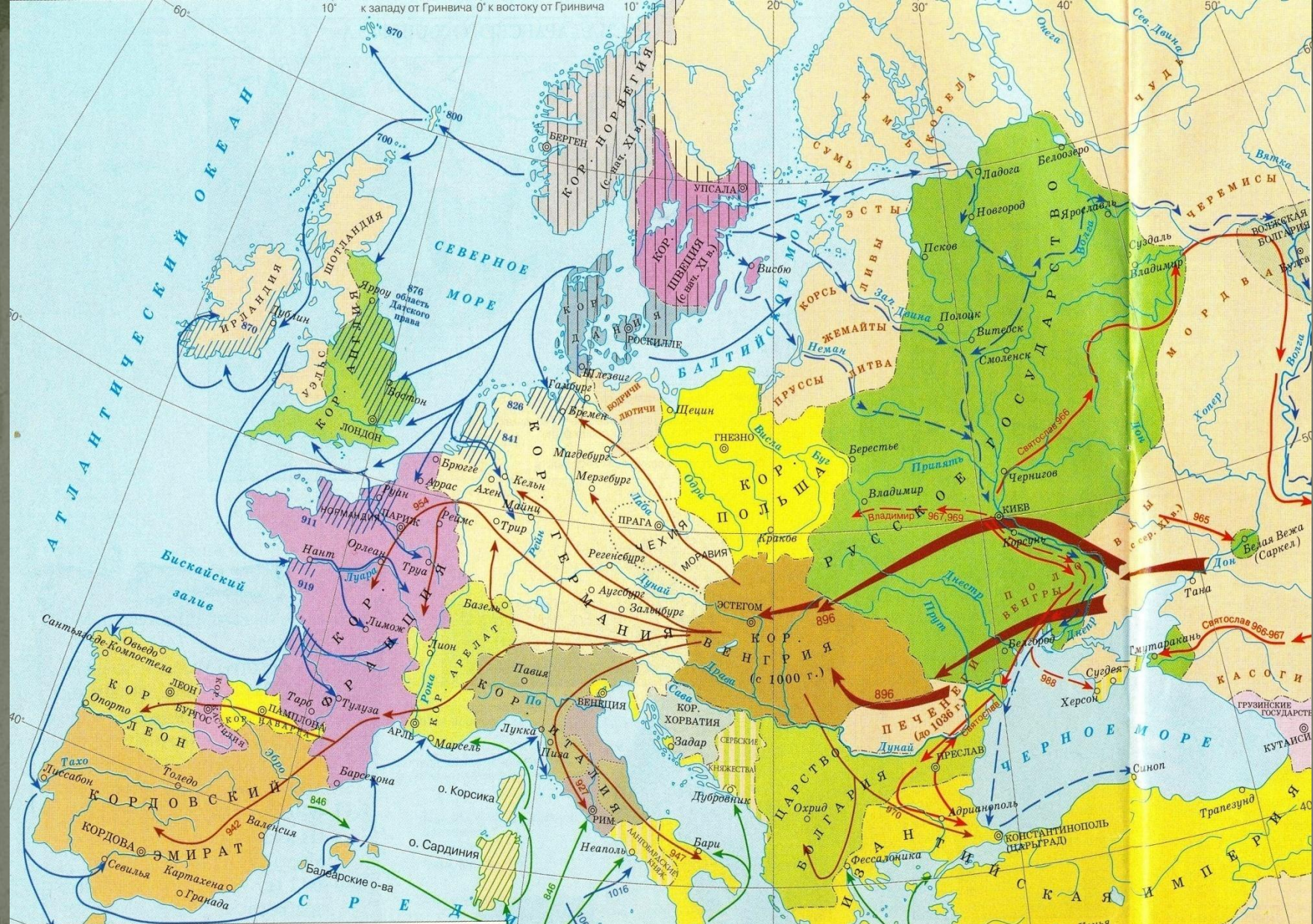
Направления набегов во второй половине IX—X вв.