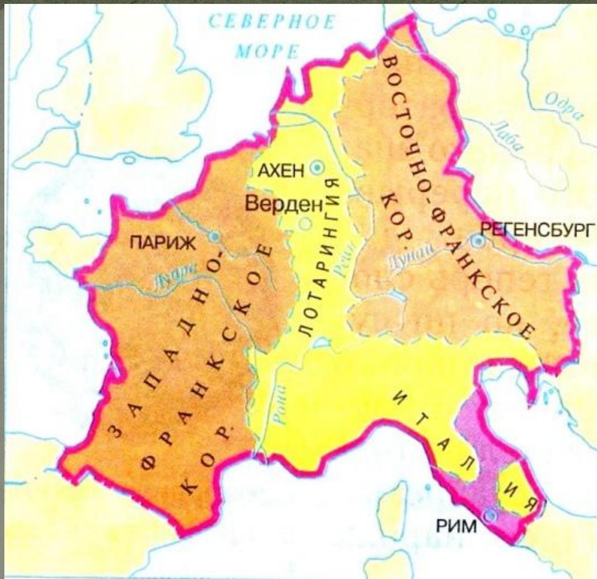
Раздел Франкской империи по Верденскому договору (843 г.)