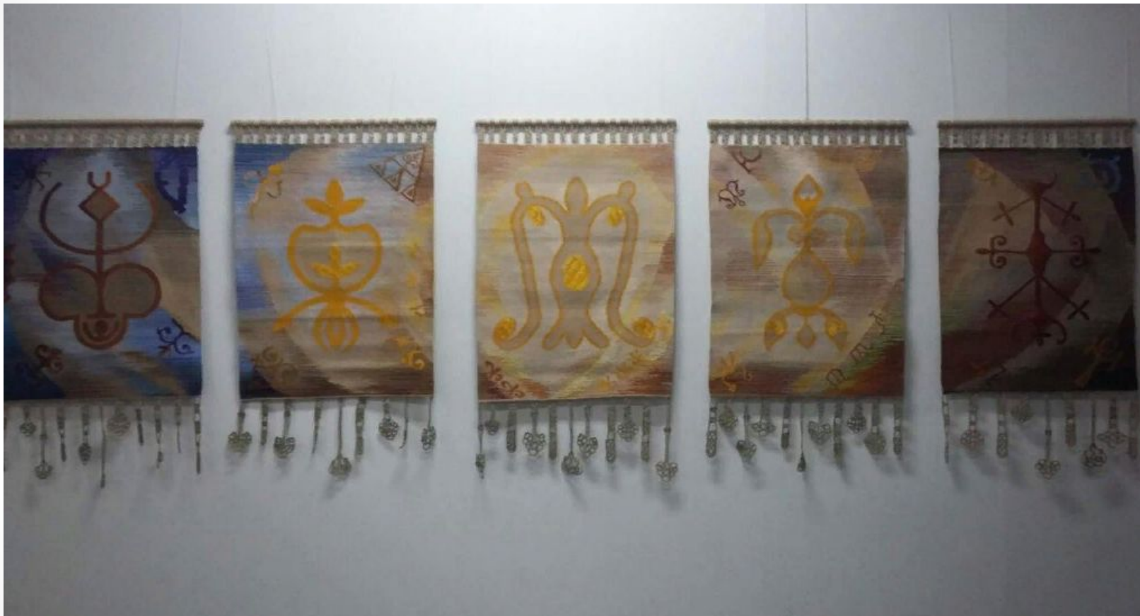
«Черкесские мадоны» 130x76, полиптих