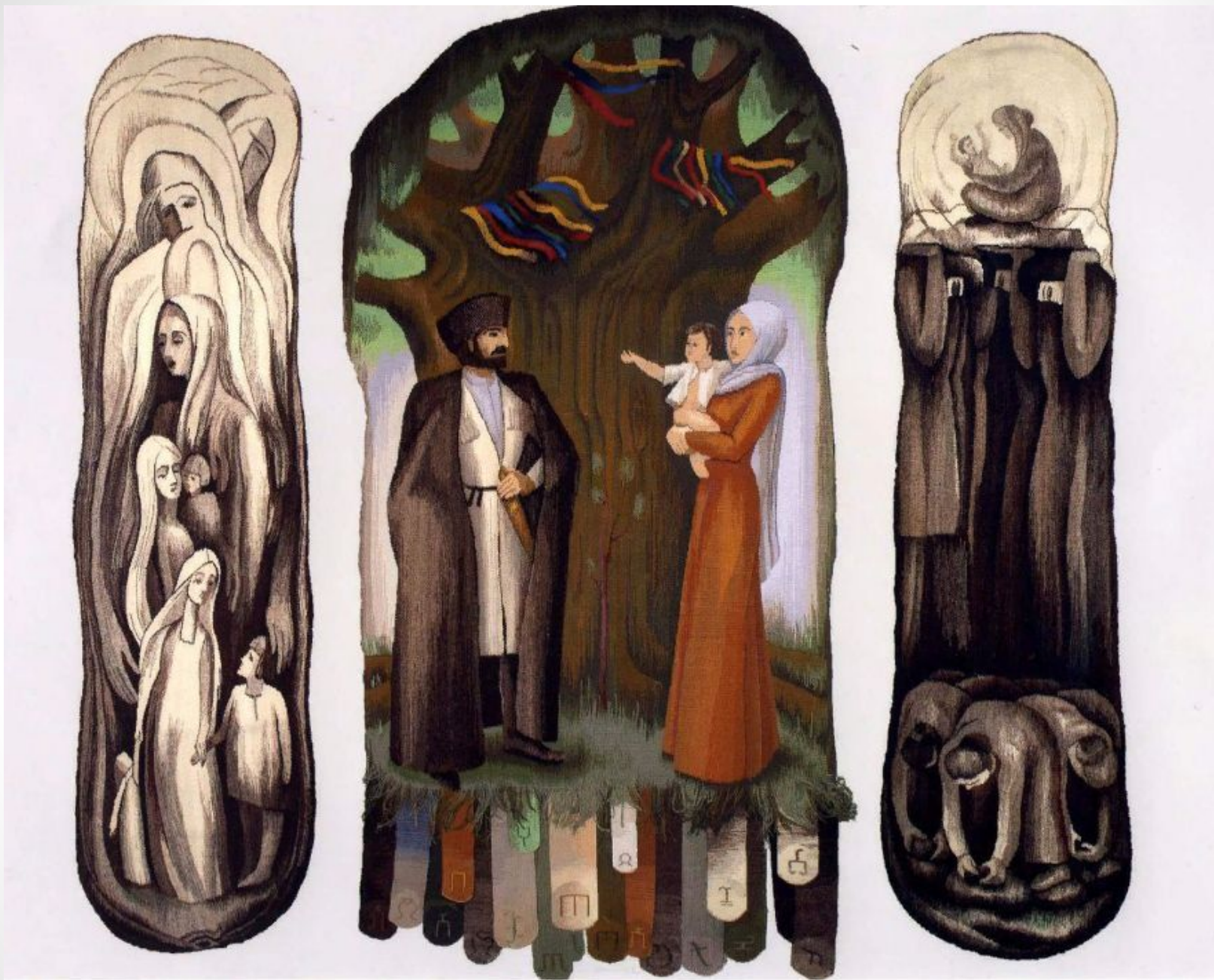
Триптих «Семья» 300x300