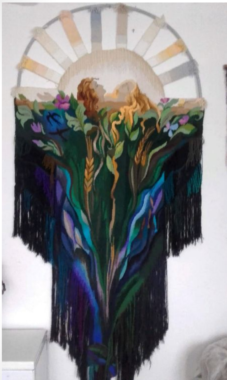
«Начало (5-й элемент)»