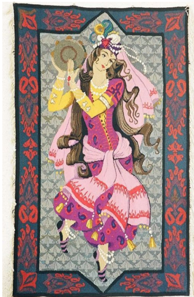
«Песни ночи: История Шахеризады»