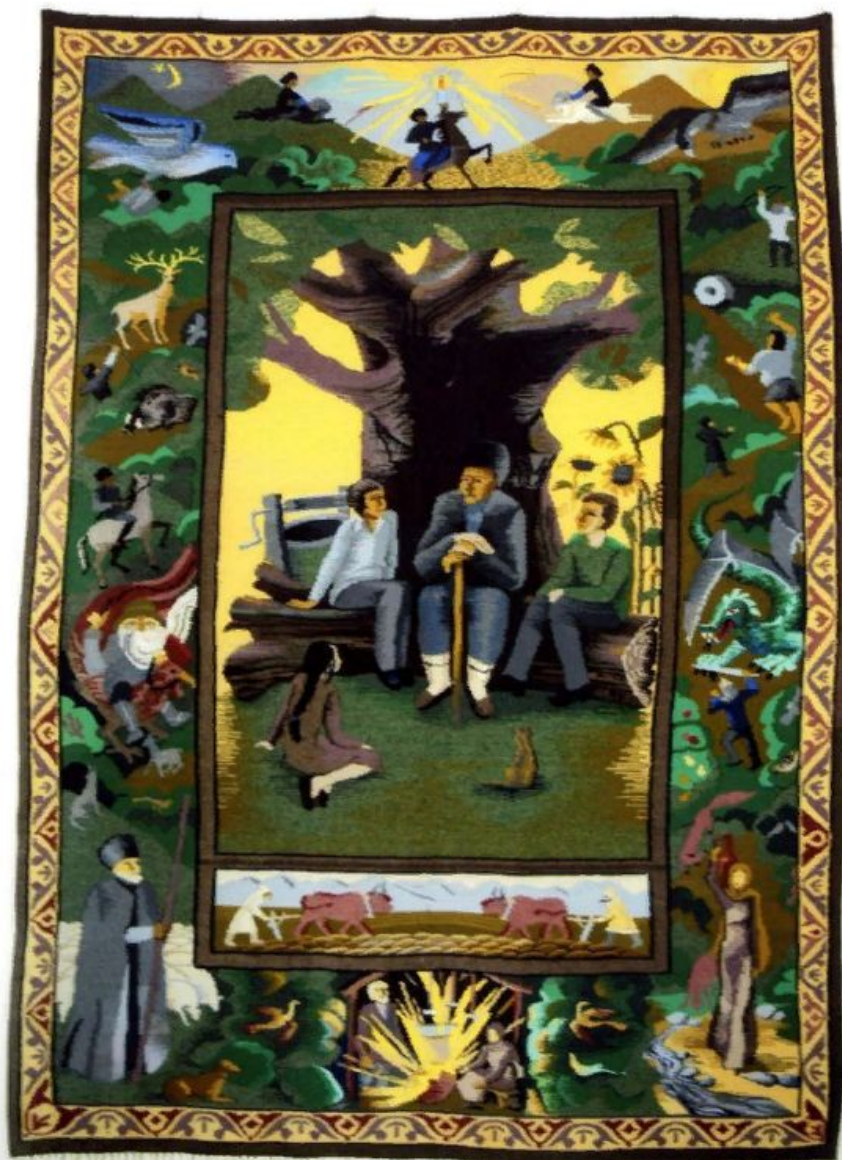
«Дедушкины истории» 200x150