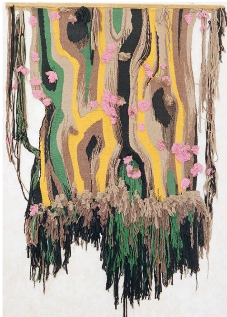
«Весна. Старое дерево»