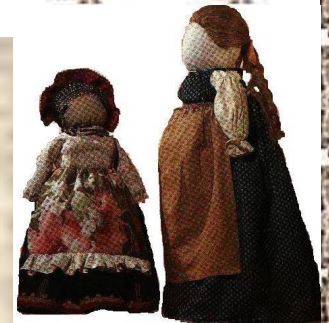
куклы 1934 года