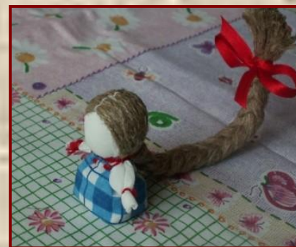
Кукла на Счастье