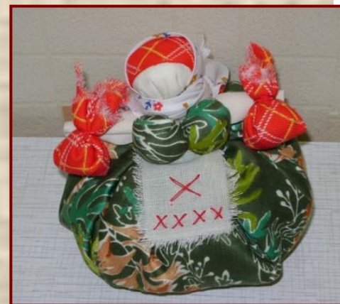
Кукла кубышка (травница)