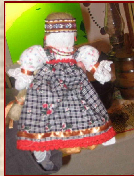
Куколка «на выхвалку» (экзамен для девочки по шитью и рукоделию)