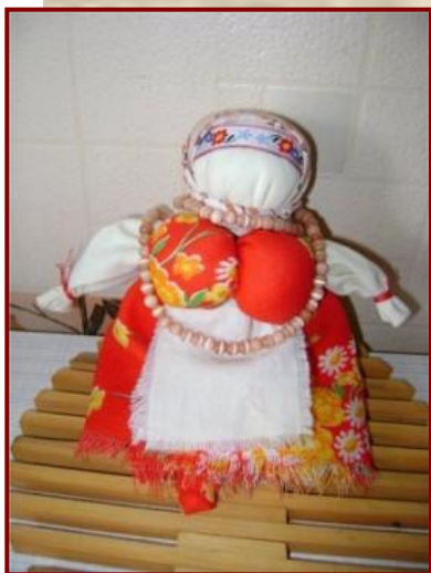
Кукла Вепская (Вепсская)

Игра в куклы поощрялась взрослыми, т.к. играя в них, ребенок учился вести хозяйство, обретал образ семьи. Кукла была не просто игрушкой, а символом продолжения рода, залогом семейного счастья.