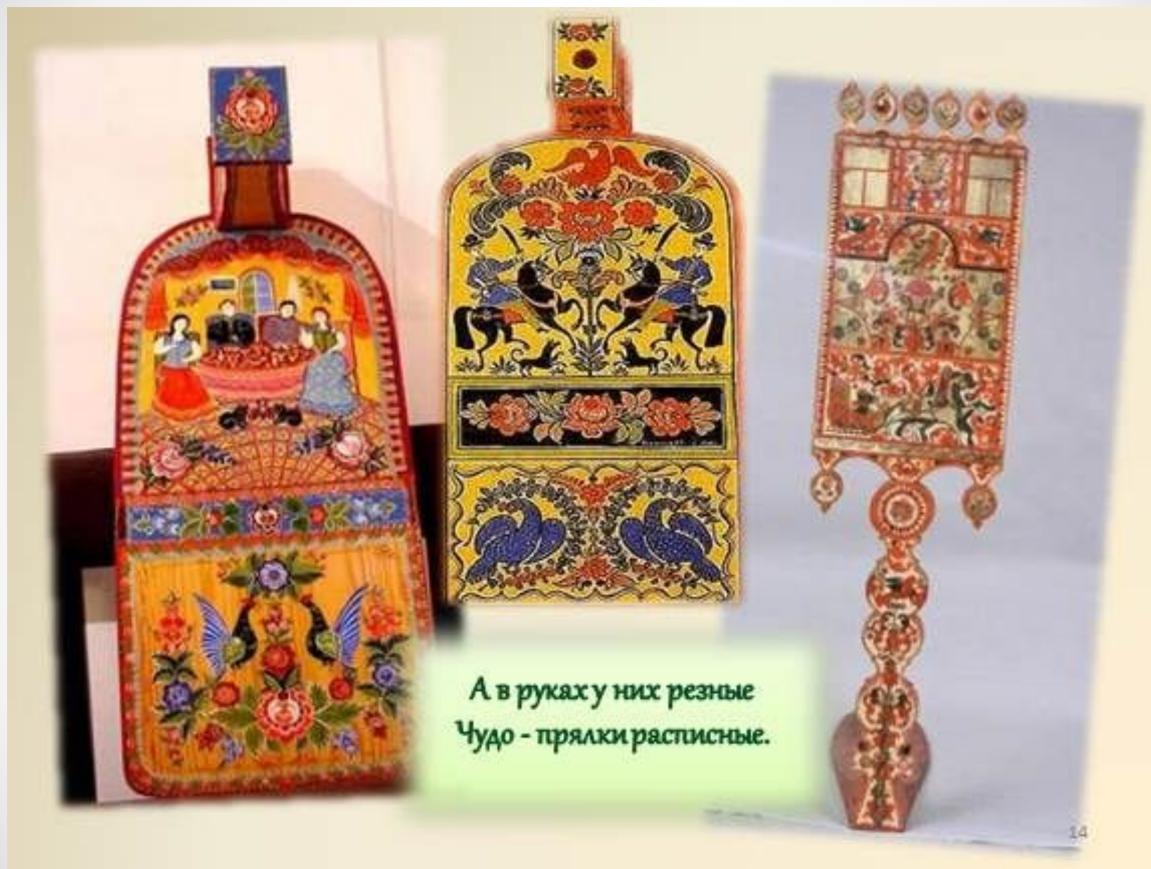
А в руках у них резные Чудо - прялки расписные.