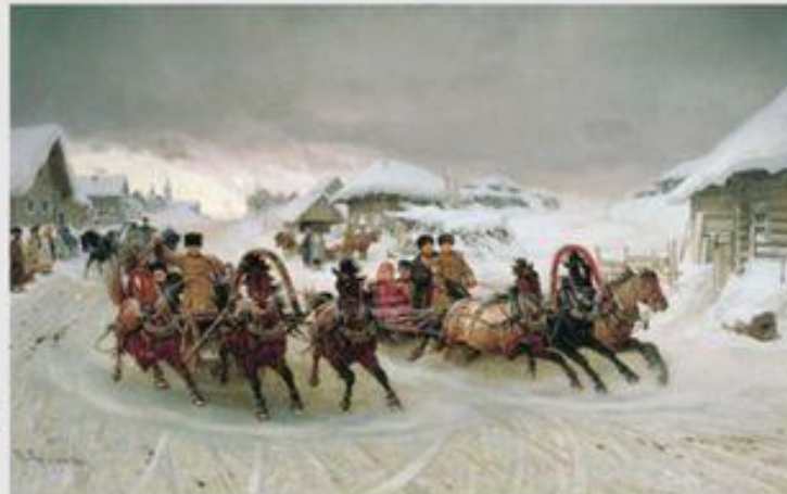
Русская тройка. П.Грузинский

возница, кучер на почтовых, ямских лошадях.