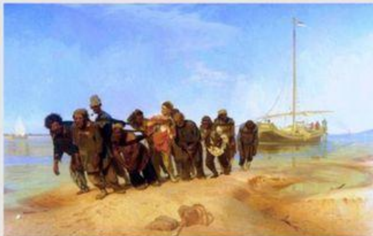
Бурлаки на Волге. И. Репин