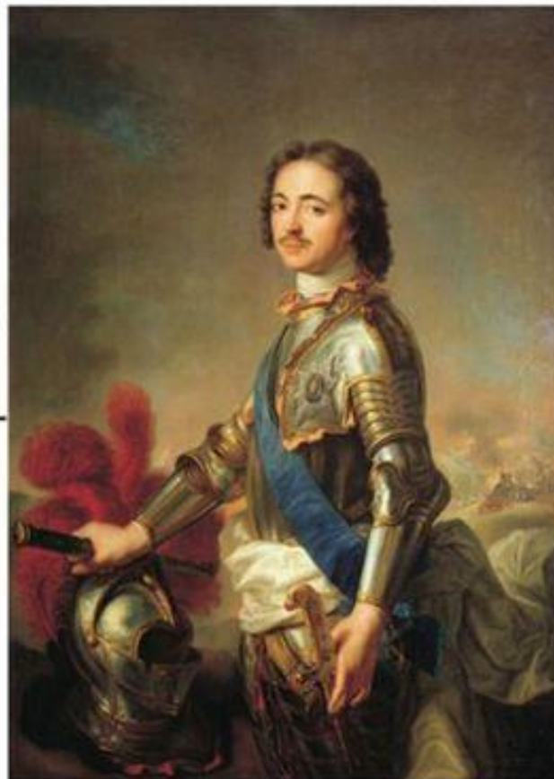
Пётр I в рыцарских доспехах. Ж.Натъе

8 июля (27 июня по старому стилю) 1709 года русская армия под командованием Петра I одержала победу над шведами в Полтавском сражении. В 1721 году Северная война закончилась полной победой Петра. России отошли старинные русские земли на берегах Балтии.