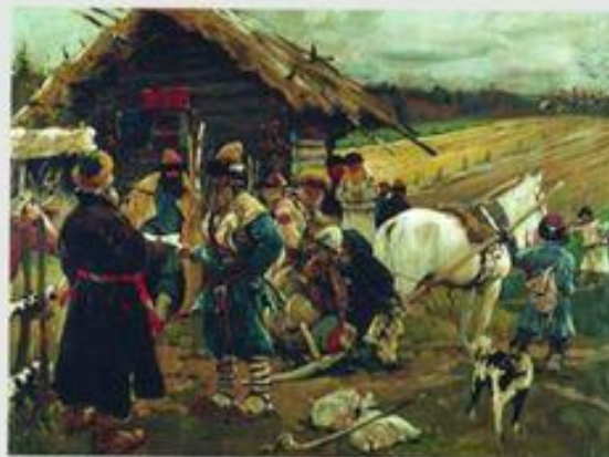
Юрьев день. С.Иванов