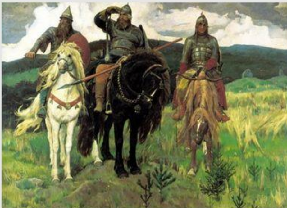
Богатыри. В. Васнецов