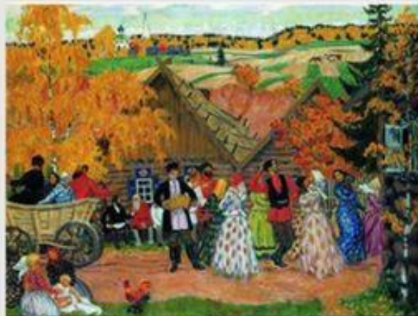
Осенний сельский праздник. Б. Кустодиев