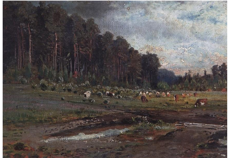
Алексей Саврасов. «Лосиный остров в Сокольниках», 1869