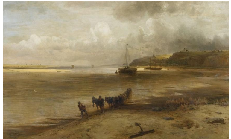
Алексей Саврасов. «Волга в окрестности Юрьевца», 1869