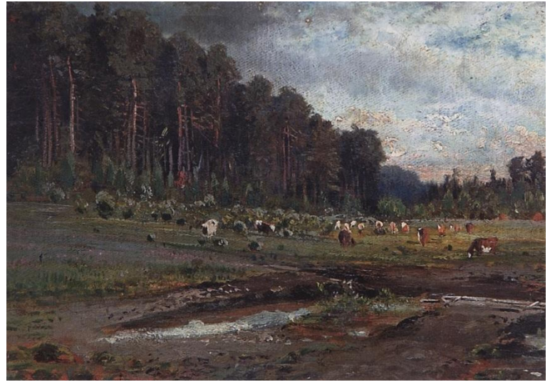
Алексей Саврасов. «Лосиный остров в Сокольниках», 1869