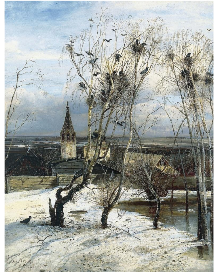
Алексей Саврасов. «Грачи прилетели», 1871

В 1871 году произошло трагическое событие в семье Саврасова — умерла его дочь. Это наложило отпечаток на творчество мастера: в его полотнах явственно чувствуются боль и печаль, а иногда и неприкрытая тоска. В конце 70-х годов Саврасов тяжело заболел, последующие годы до смерти были тяжелыми: художник мало работал, испытывал нужду, подавал прошения о денежных ссудах и получал отказы. Умер Саврасов в московской больнице для бедных, 26 сентября 1897 года.