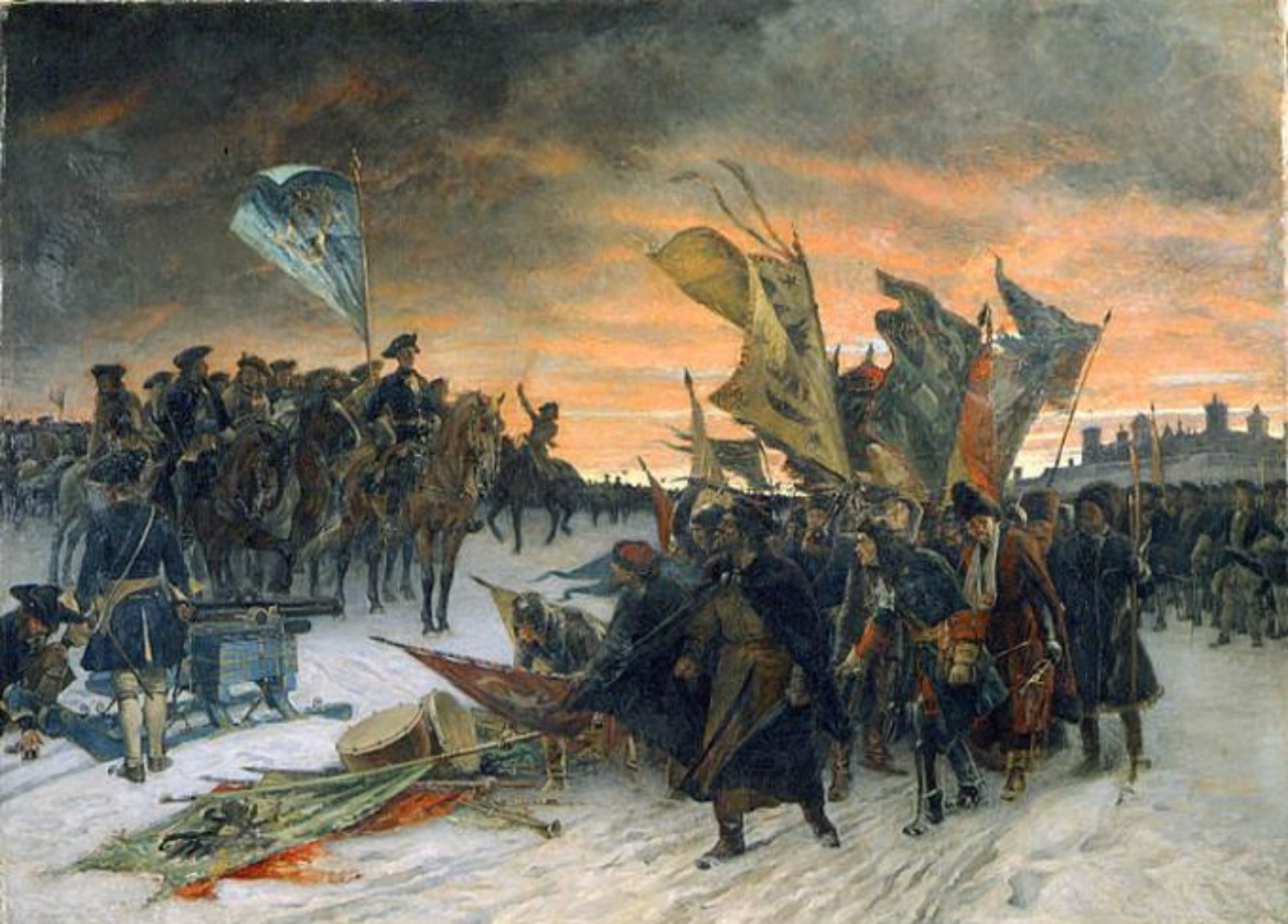
Победа шведов в битве при Нарве Худ. Густав Седерстрём