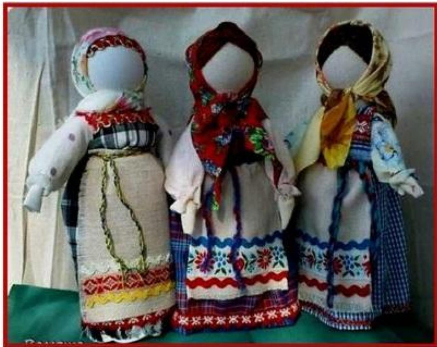
Игровая кукла на ложке