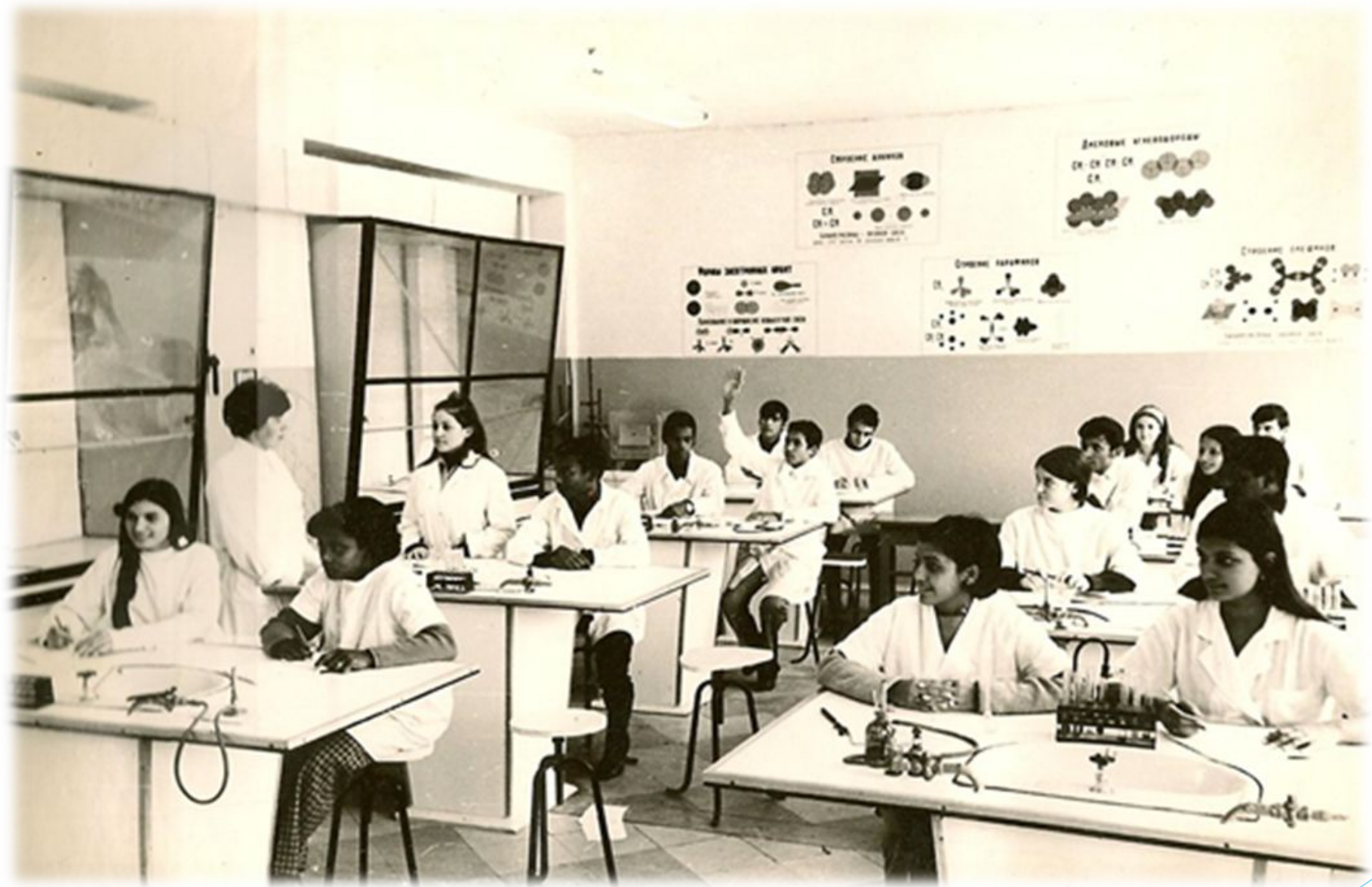
Лабораторное занятие по органическому синтезу в группе ЗАН