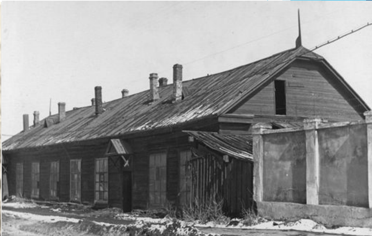
В этом деревянном бараке работал техникум с 1943 по 1946 год