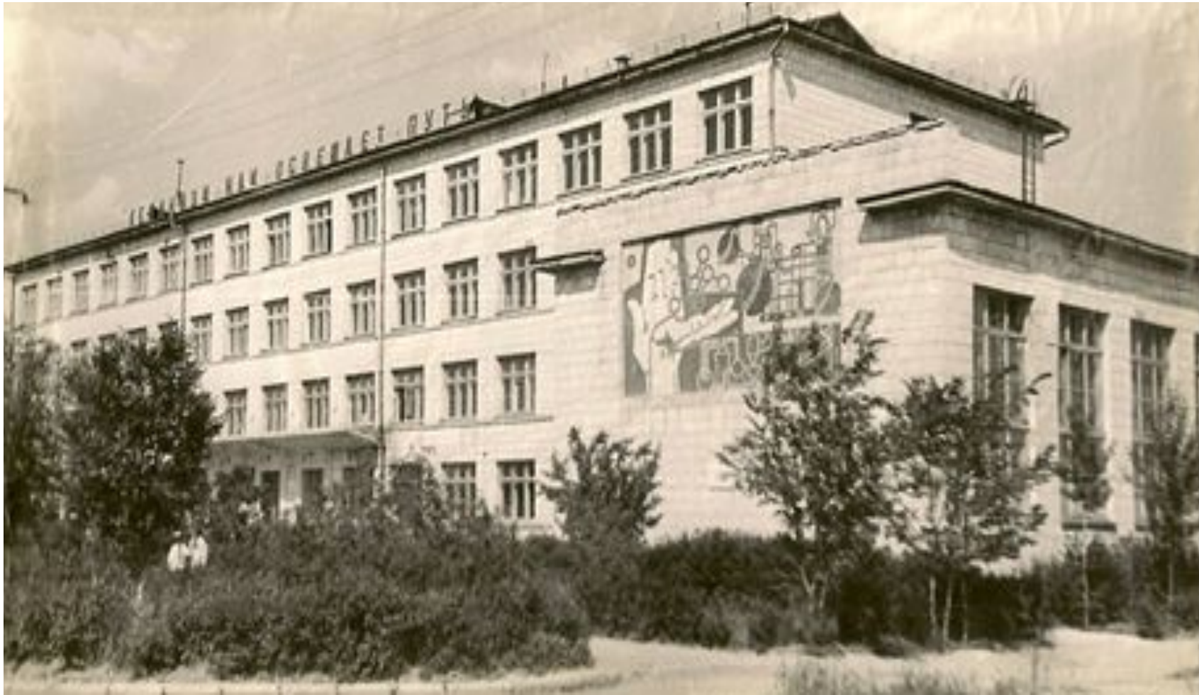
Здание учебного корпуса техникума

В 1964 году новый учебный год учащиеся встречали в здании учебного корпуса на улице 64 Армии, 14 в Кировском районе города Волгограда.