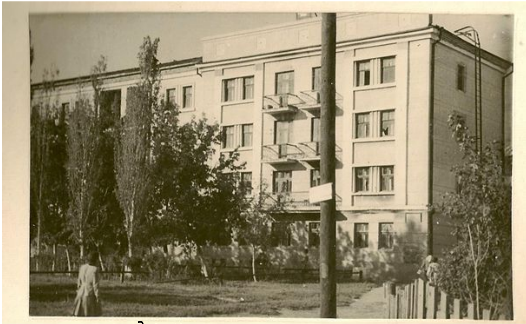
Здание сохранилось и в настоящее время

В 1946 году техникум переехал в новое четырехэтажное здание в Кировском районе, по улице Армавирской, дом № 15.