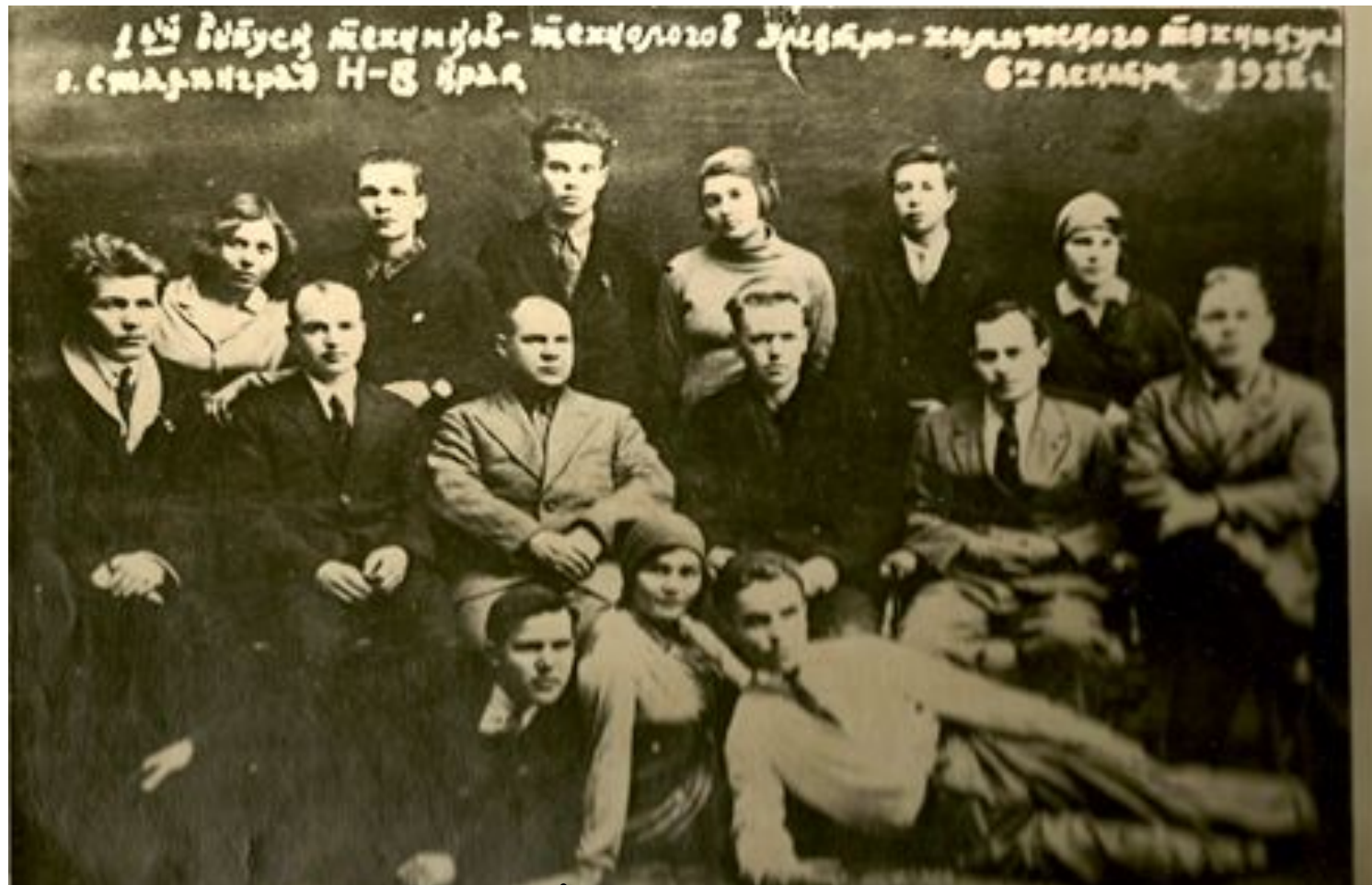
1932 год. Первый выпуск техников-технологов

Формируется преподавательский состав и основные направления для подготовки специалистов по специальностям: техник-технолог и техник-электрохимик. В 1932 году техникум в первый раз выпустил техников-технологов.