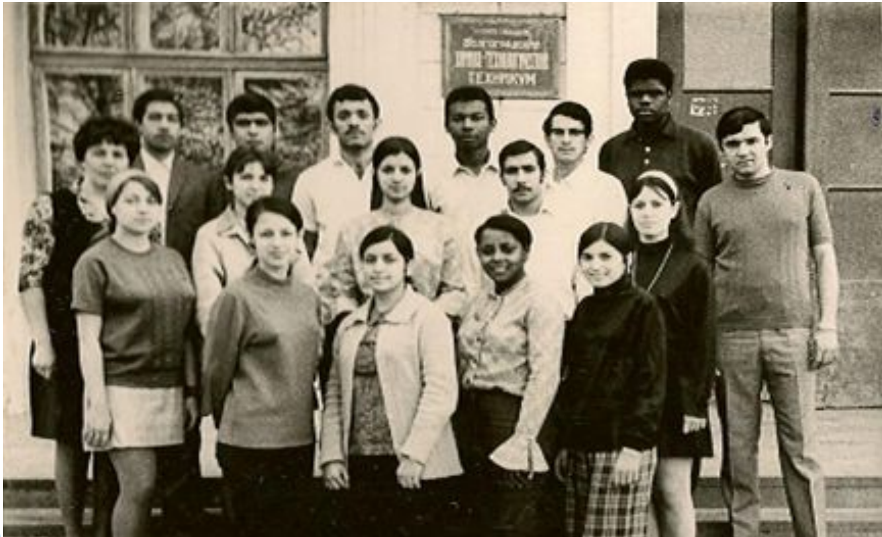
Группа иностранных студентов перед учебным корпусом техникума

В 1971 году был осуществлен набор абитуриентов из стран Азии, Африки и Латинской Америки.