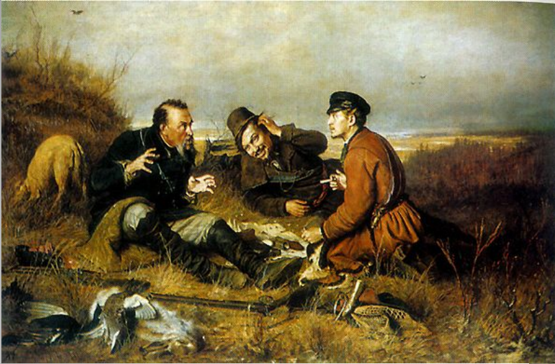
«Охотники на привале» В.Г. Перов