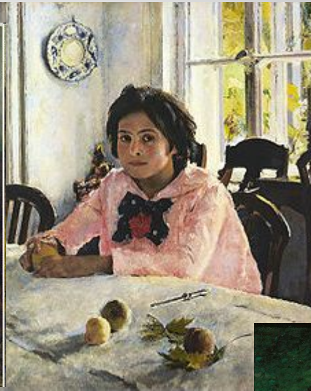
«Девочка с персиками» В. Серов