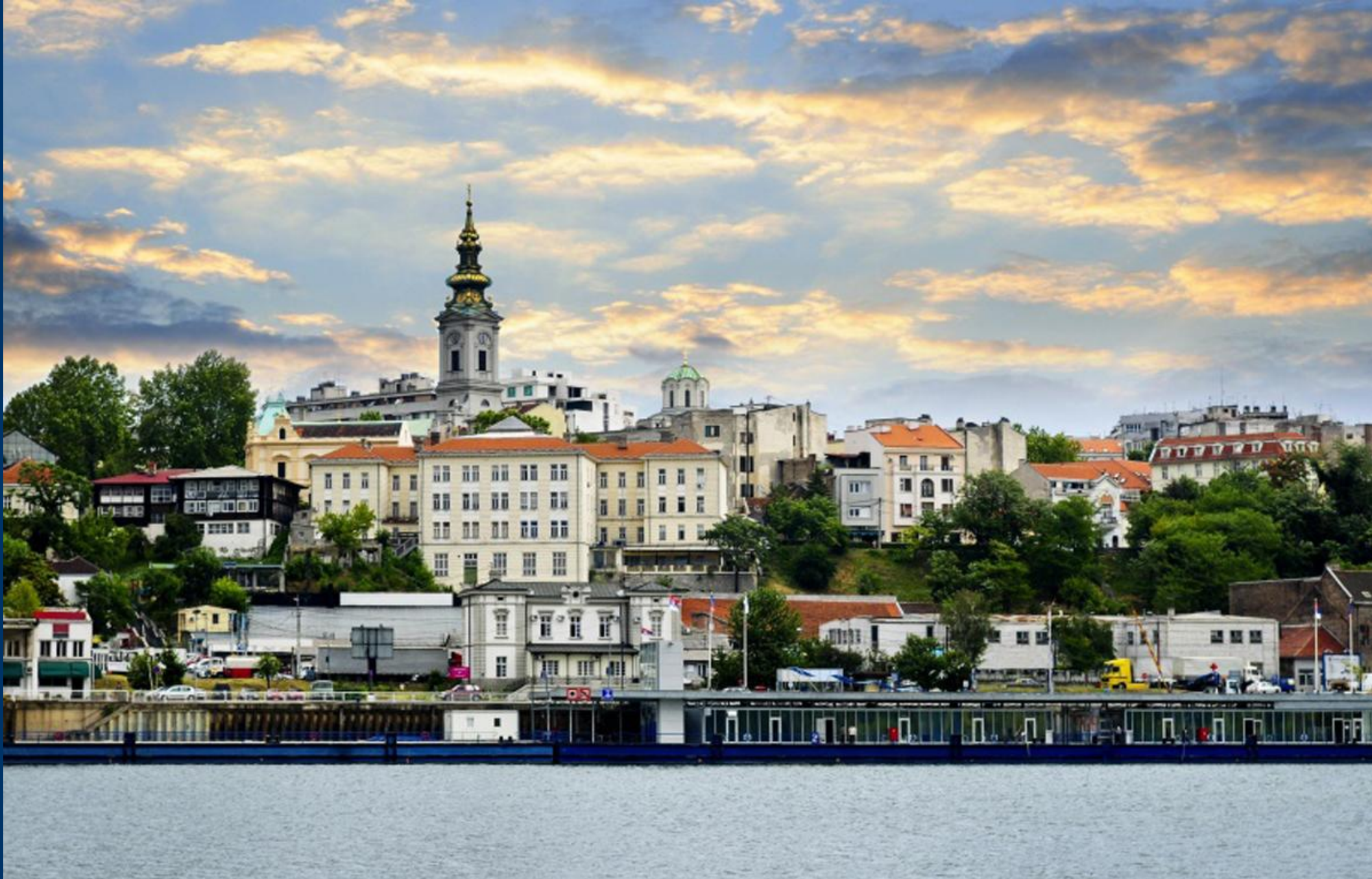
Модерни поглед на Београд са реке Саве