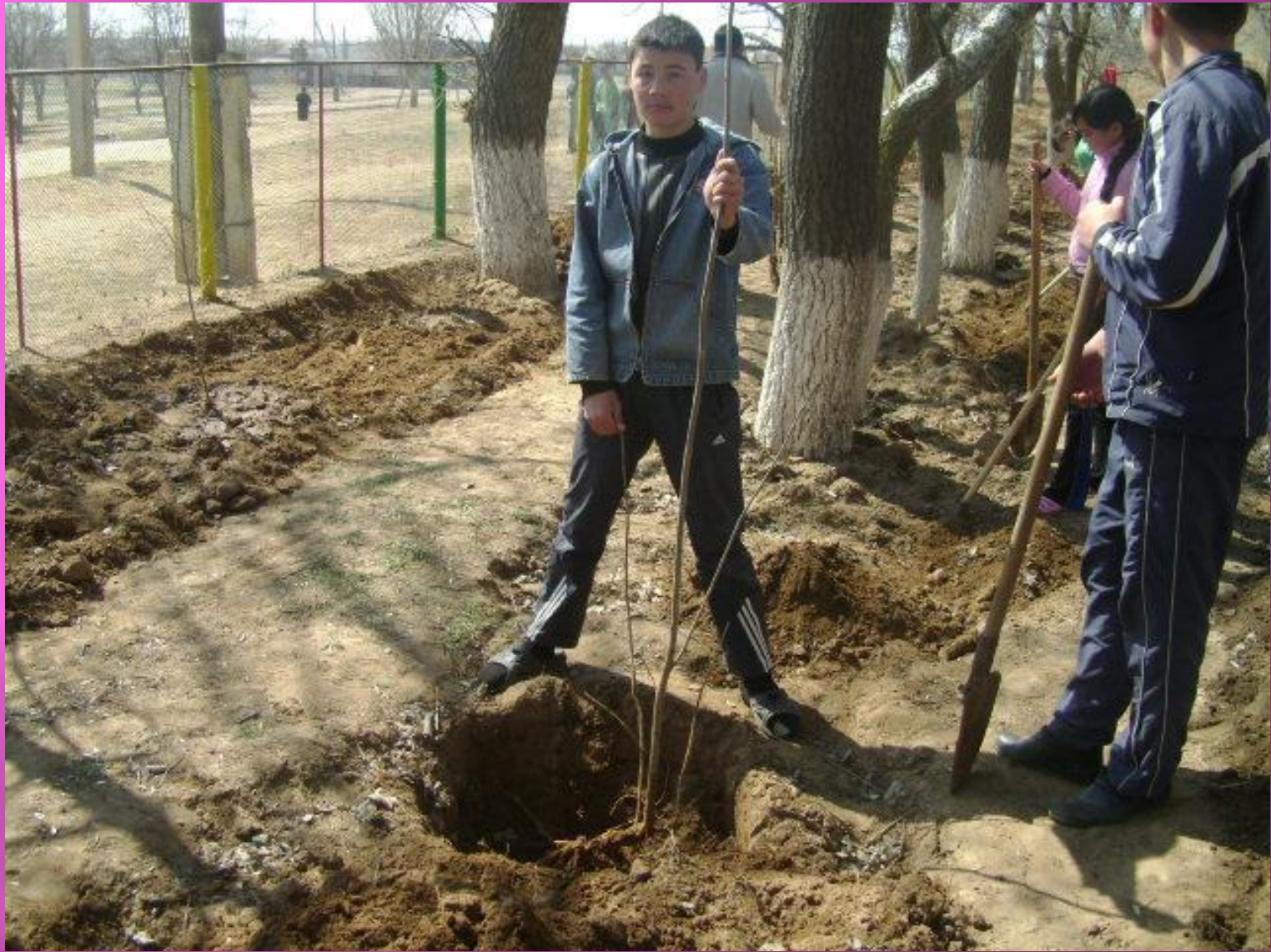
Акция «Посади дерево»