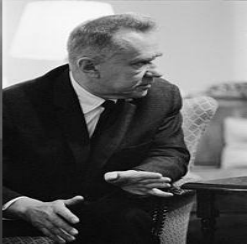
Алексей Николаевич Косыгин (1904 — 1980)

Вознесенский Николай Алексеевич, возглавлял в годы войны Госплан СССР. Его книга является одним из лучших пособий по экономике мобилизационного периода.