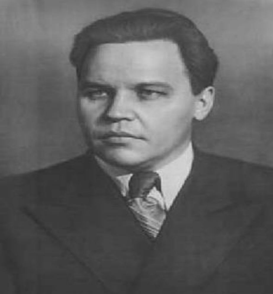
Николай Алексеевич Вознесенский (1903 — 1950)

Вознесенский Николай Алексеевич, возглавлял в годы войны Госплан СССР. Его книга является одним из лучших пособий по экономике мобилизационного периода.