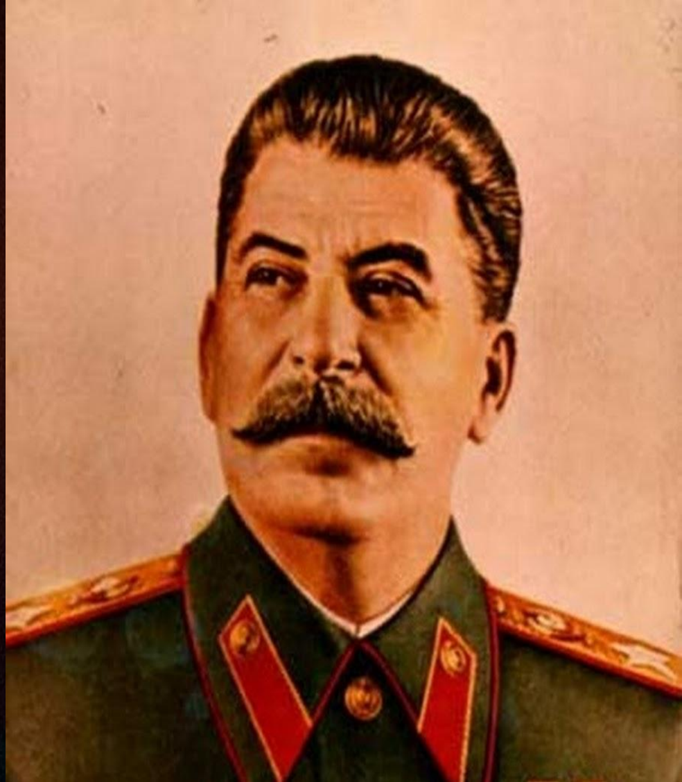
Сталин (Джугашвили) Иосиф Виссарионович (1879-1953)