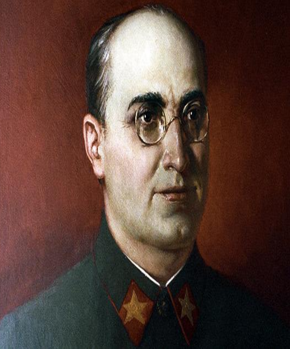
Берия Лаврентий Павлович (1899—1953)