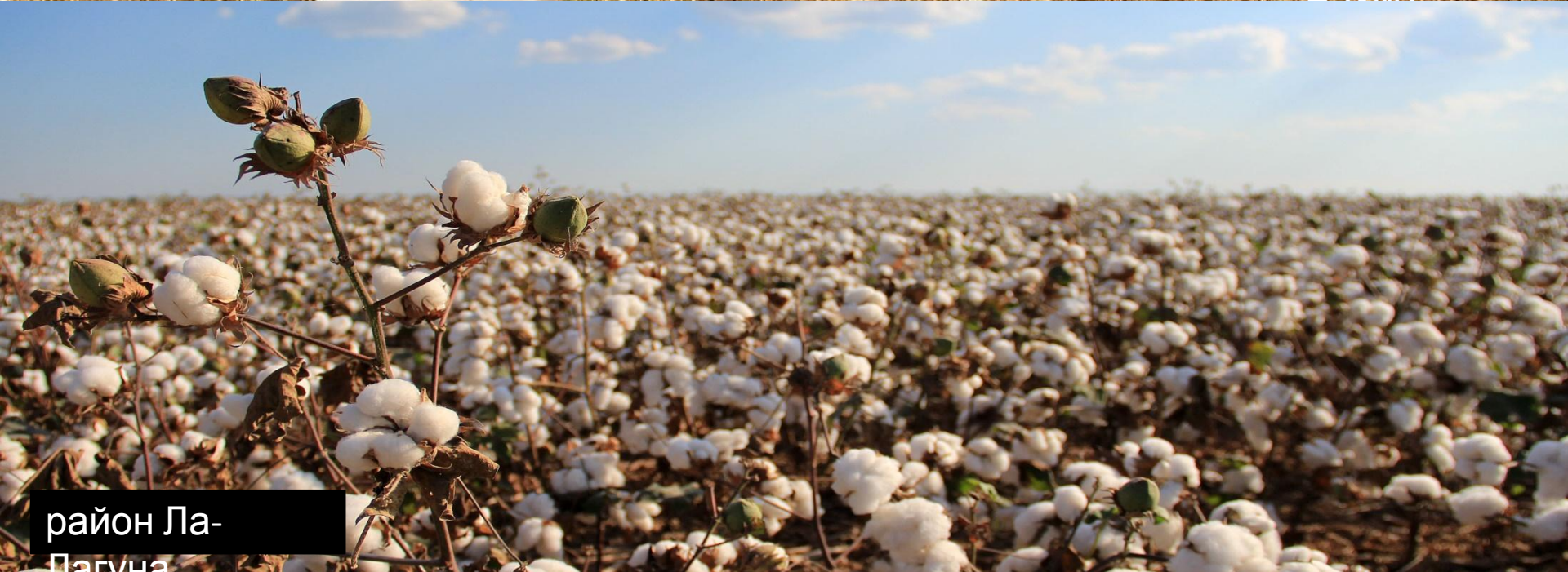
район Ла- Пагуна