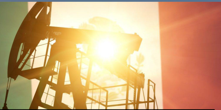
Нефтяная и газовая промышленность