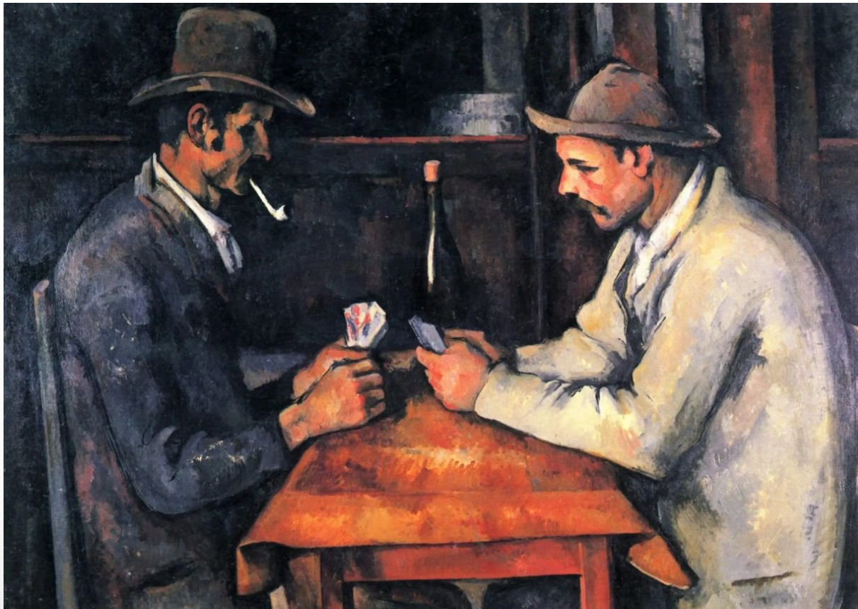
«Игроки в карты» 1893