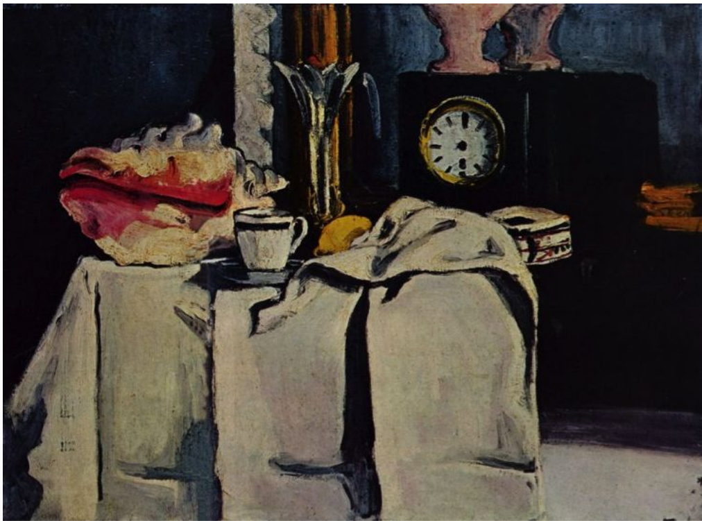
«Натюрморт с часами из черного мрамора» 1871г.