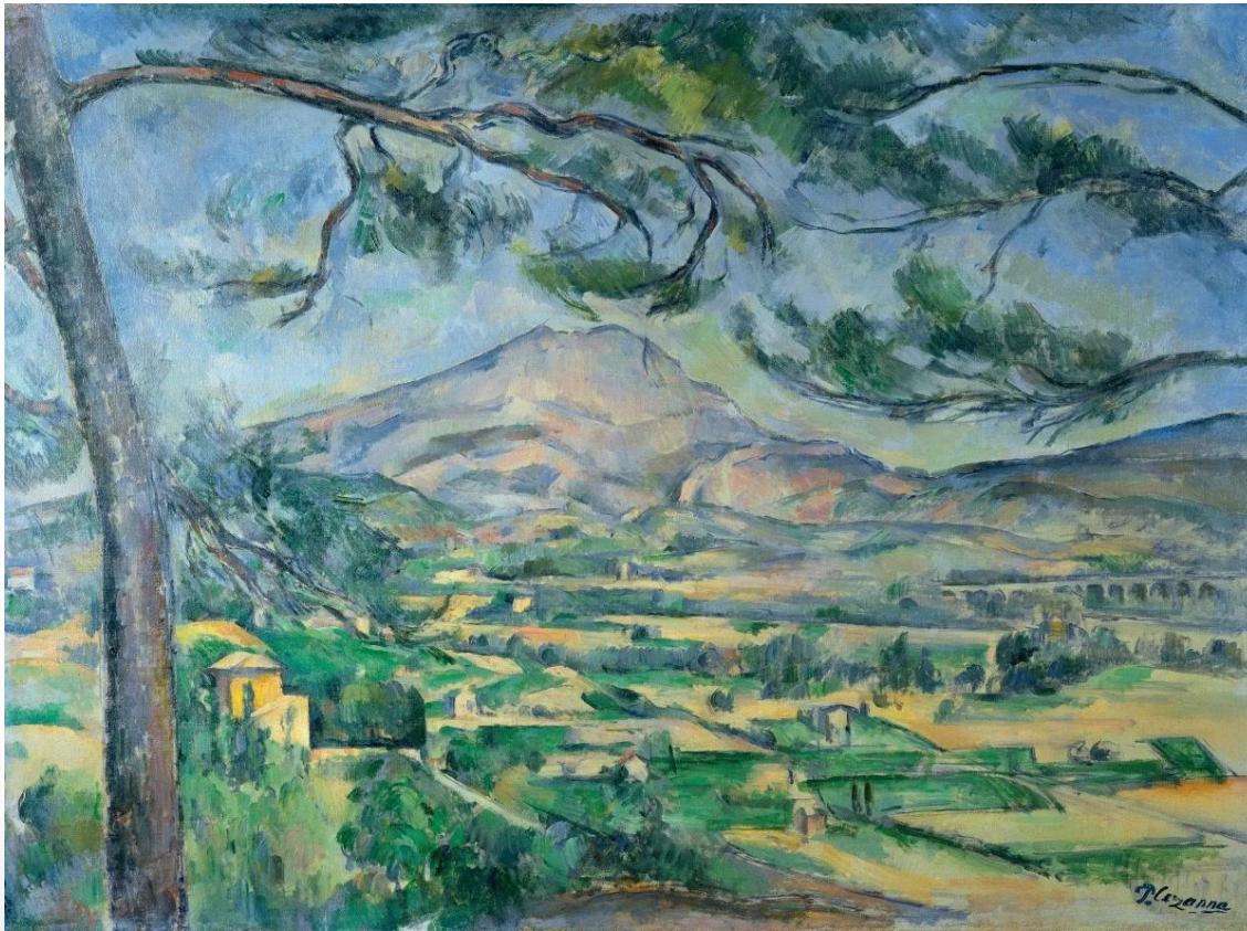
«Гора Сент- Виктуар» 1887г.