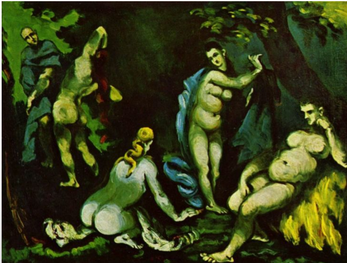
«Искушение св. Антония»