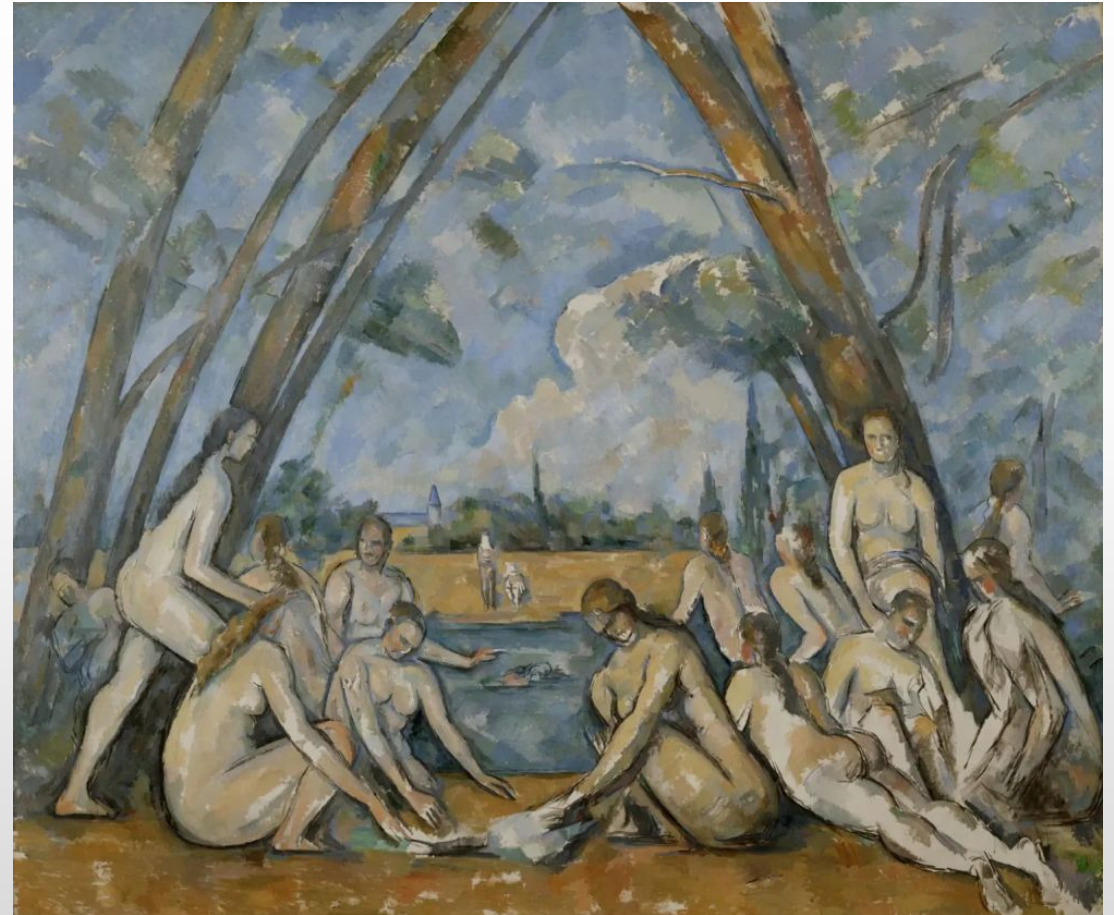
«Большие купальщицы» 1905