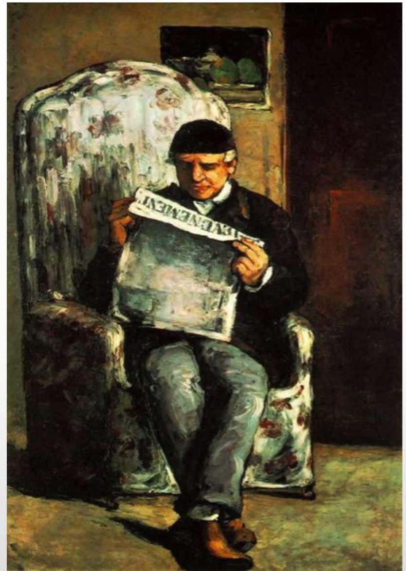
«Портрет Луи-Огюста» 1866г.