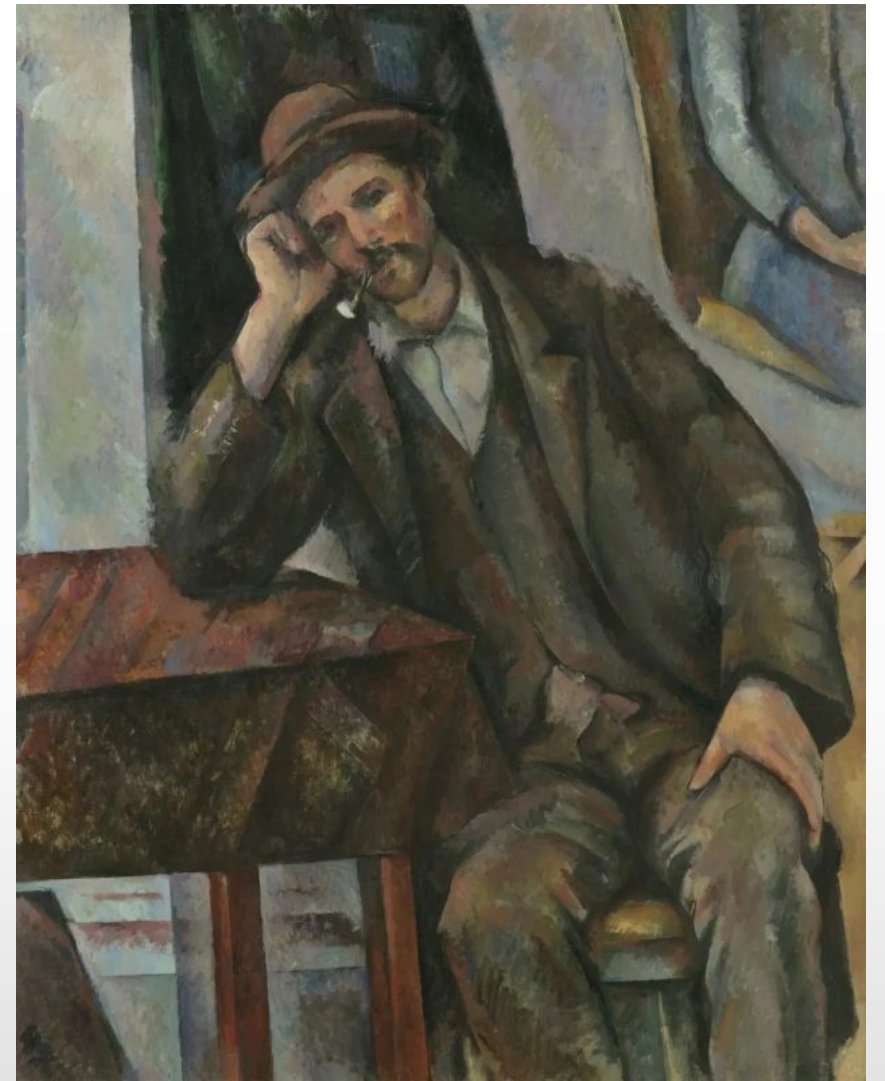
«Мужчина, курящий трубку» 1896