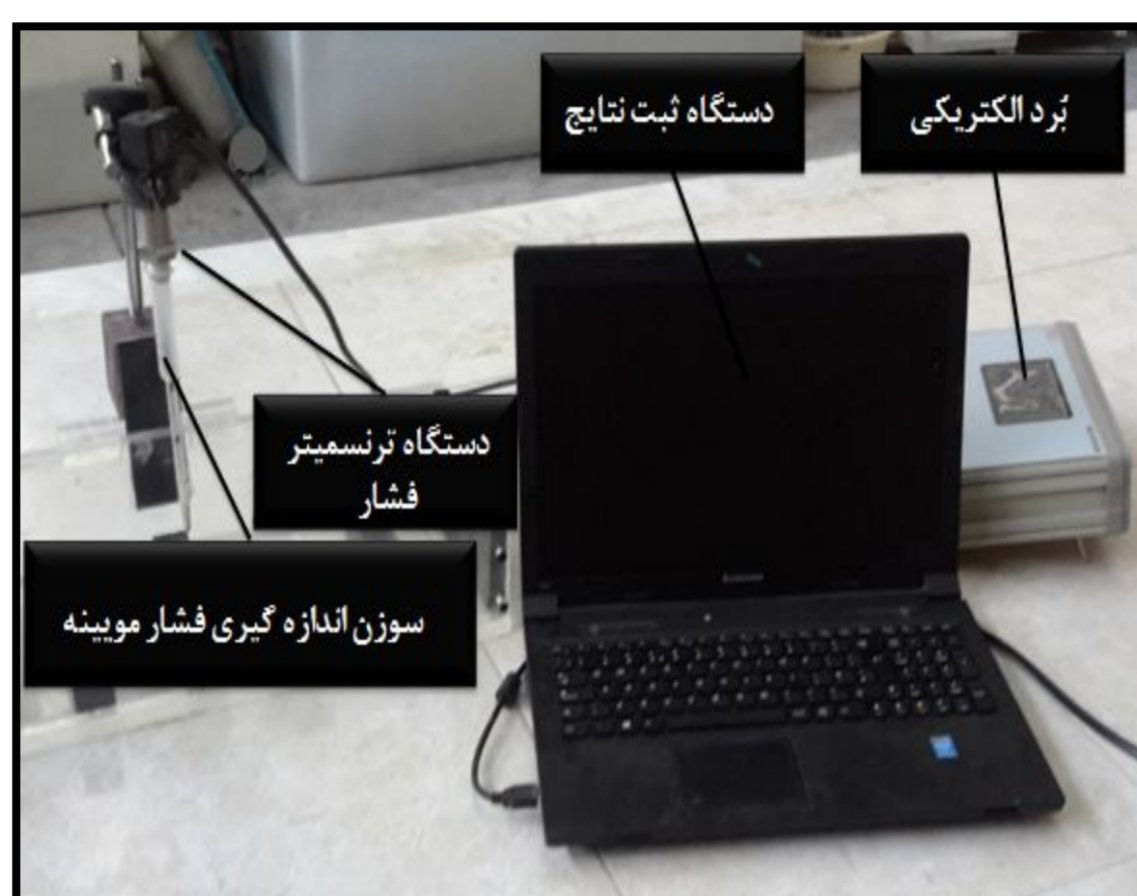
شکل 1 اجزای مختلف دستگاه