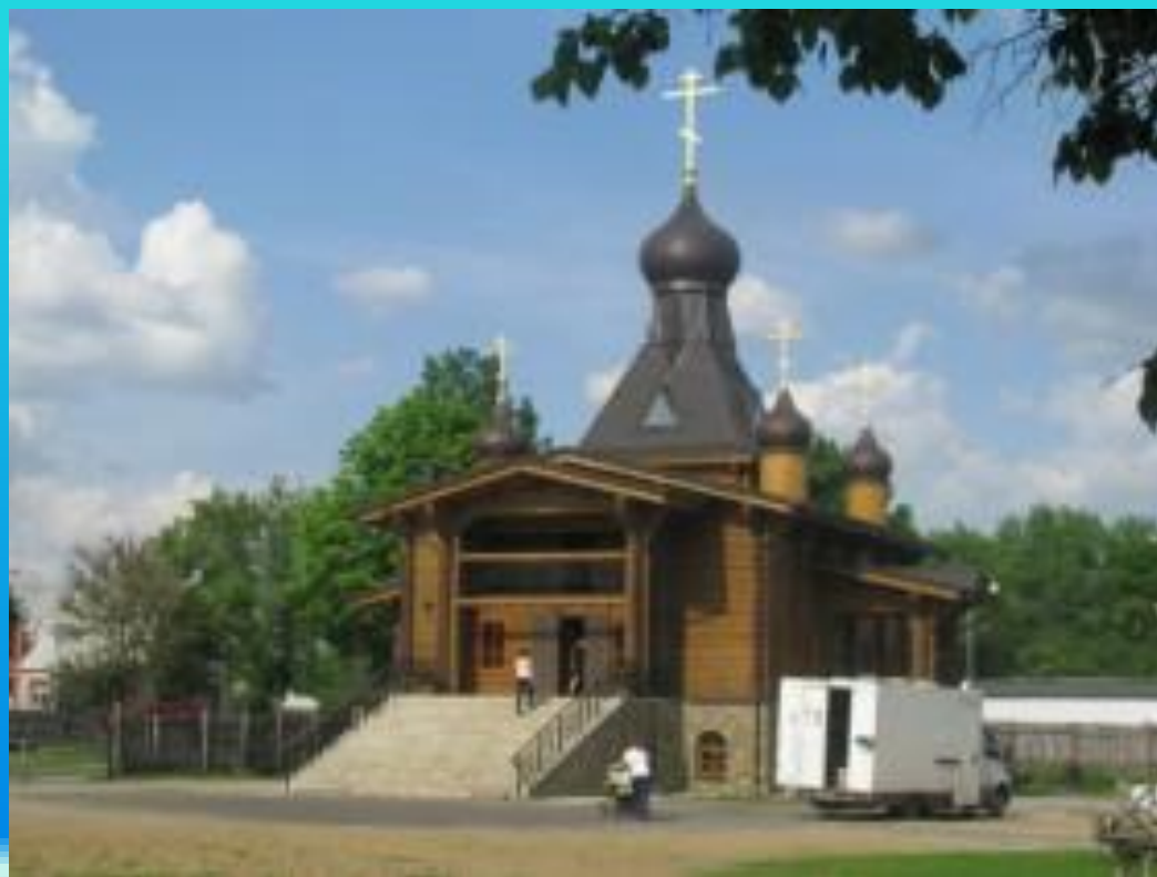
Храм на улице Союзная