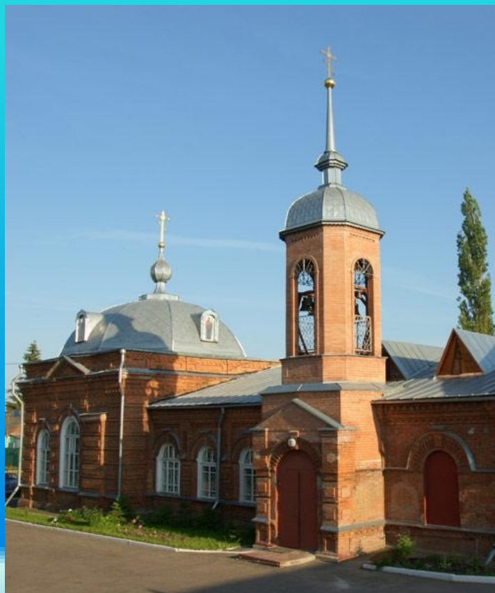
Храм на улице Полевая