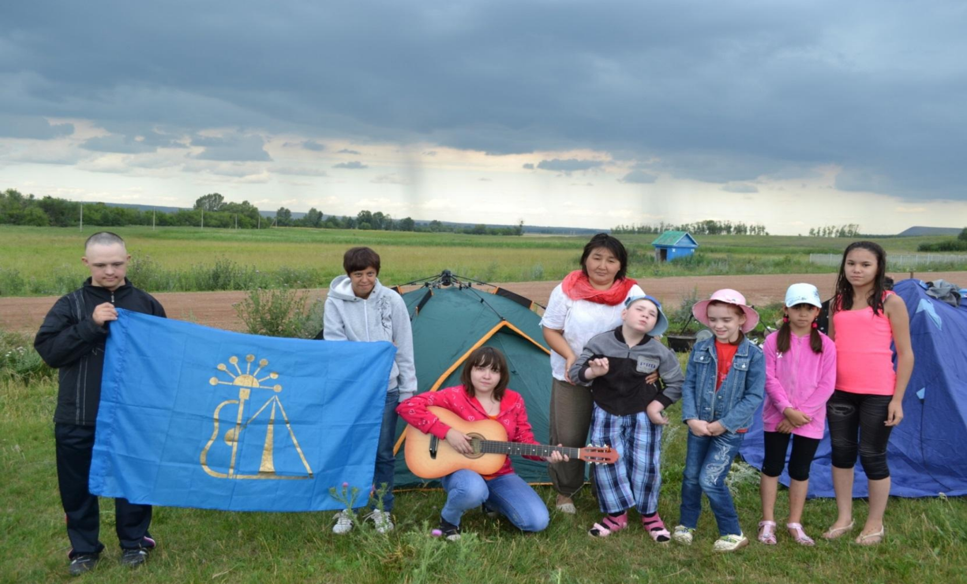
Экскурсионная поездка с детьми-инвалидами