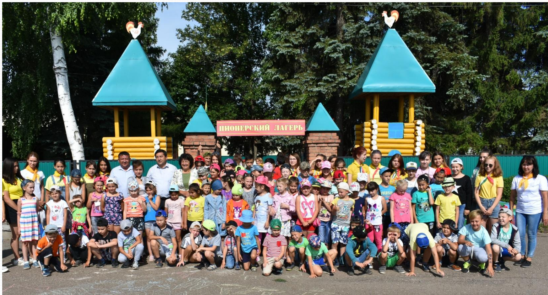
Лагерь Дома пионеров и школьников