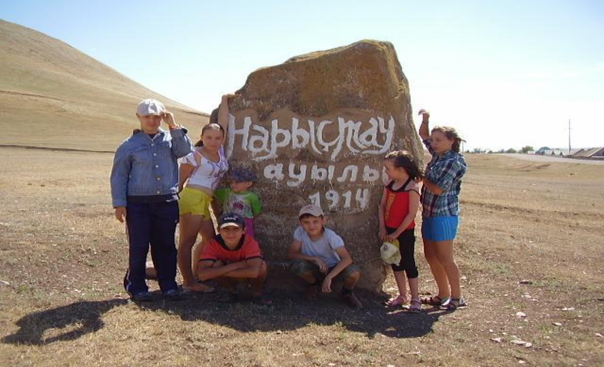
Экскурсионная поездка с детьми-инвалидами д. Нарыстау Миякинский район