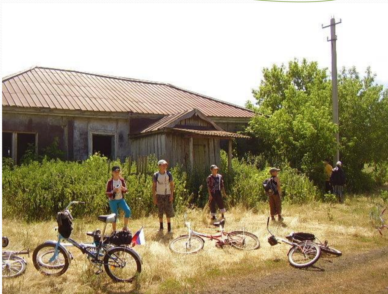
Смена «Большая память малых деревень»