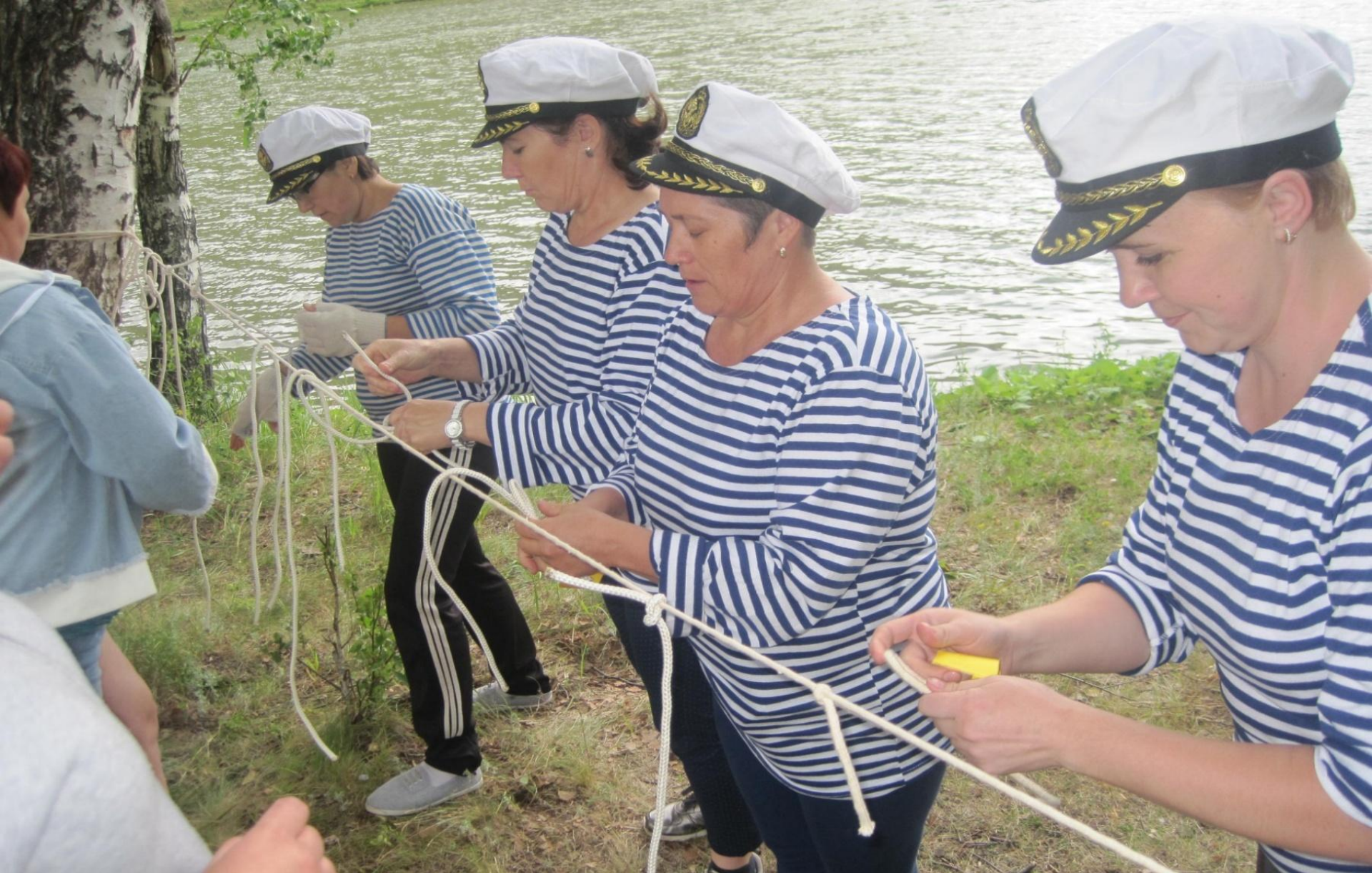
Районный турслет учителей