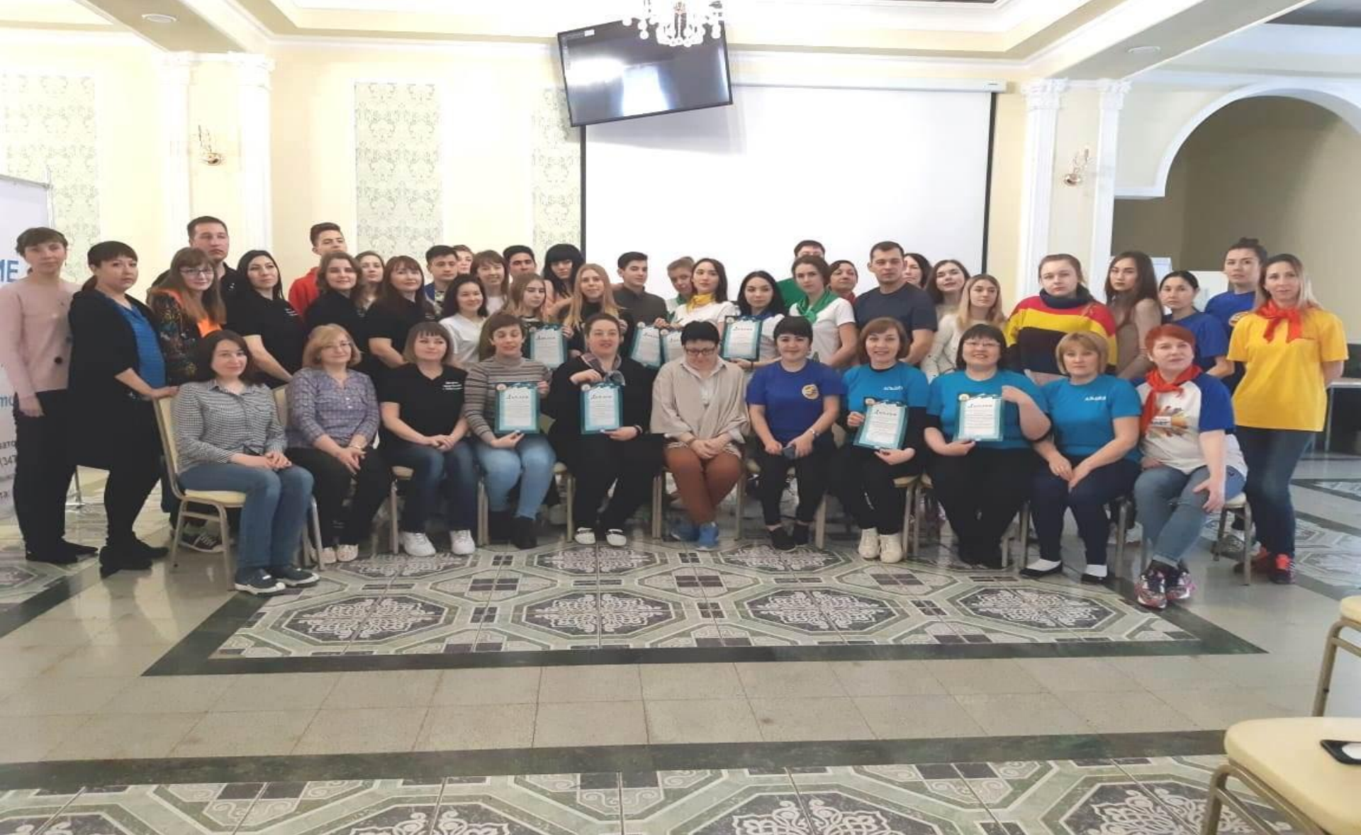
Подготовка кадров, V республиканский форум педагогических отрядов