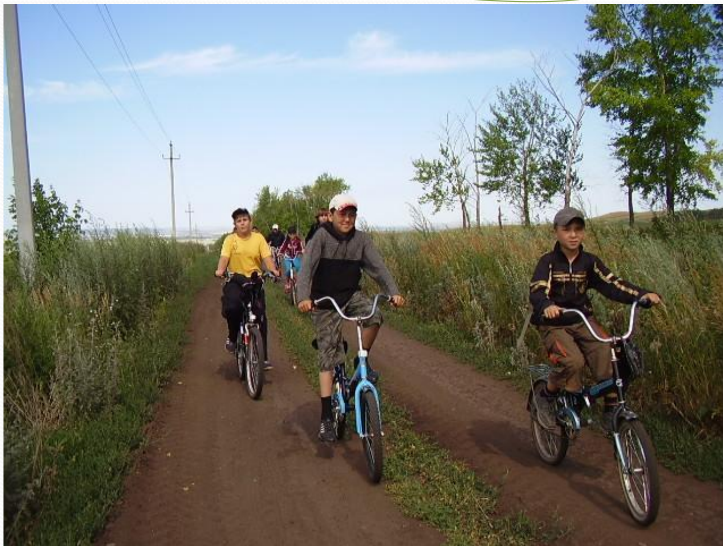
Профильный лагерь туристско-краеведческой направленности «Истоки»