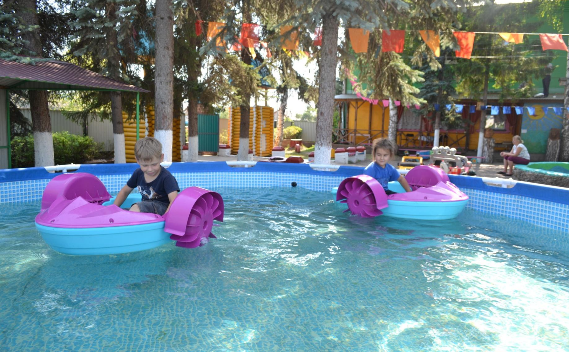
Игровая площадка «Солнышко»