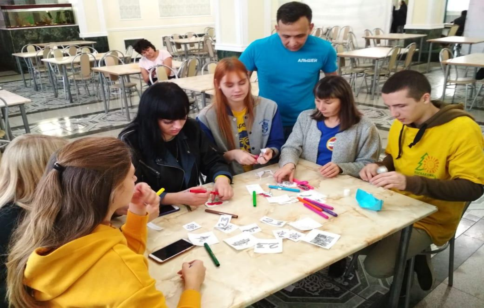
Подготовка кадров, III республиканский фестиваль педагогических отрядов