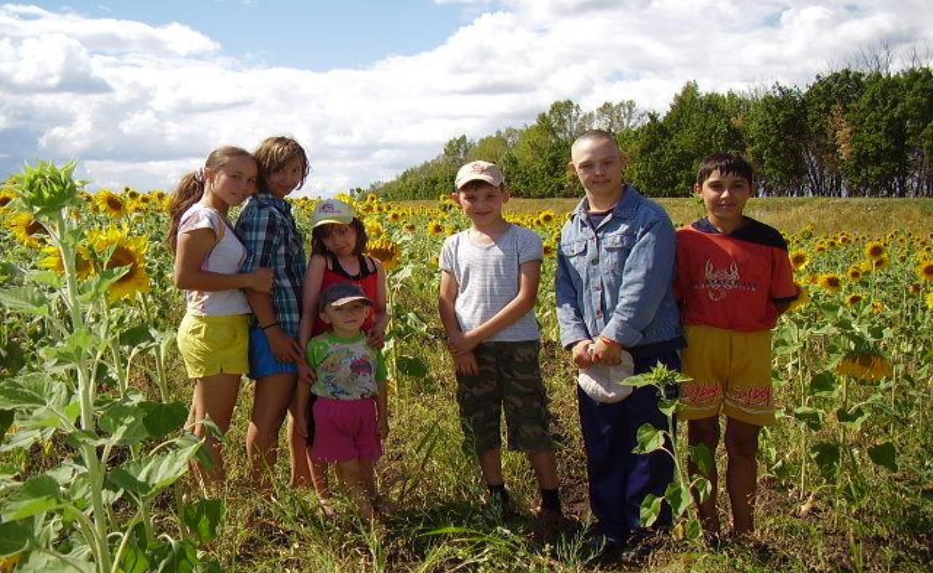
Экскурсионная поездка с детьми-инвалидами