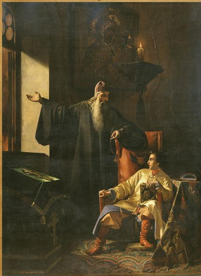
Иван IV и протопоп Сильвестр во время большого московского пожара 24 июня 1547 года.

Иван IV стал править самостоятельно. Но борьба боярских группировок продолжалась. Это привело к Московскому восстанию 1547 года. Поводом послужил небывалый пожар. По Москве поползли слухи, будто город спалили Глинские. Иван IV бежал из Москвы в село Воробьево, а дворы Глинских были сожжены и разграблены. Едва опасность миновала, царь приказал арестовать главных заговорщиков и казнить их.