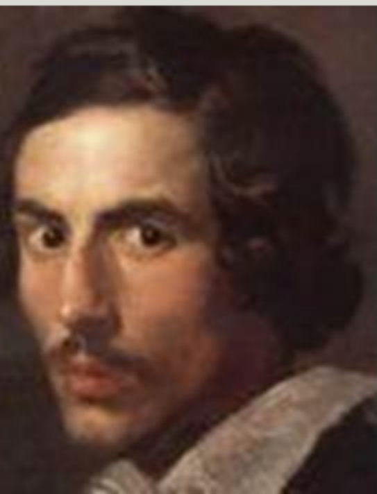
Джованни Лоренцо Бернини

В его основании согласно легенде могила святого Петра, ученика Христа, первого епископа Рима, главы христианской церкви. Предание гласит, что именно здесь, на арене цирка, в царствование Нерона апостол был казнен. Здесь же в 330 году н. э. император Константин, провозгласивший христианство государственной религией Римской империи, воздвиг один из первых храмов новой веры.