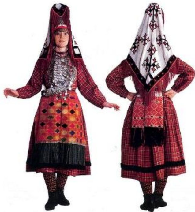
Южная удмуртка в праздничном костюме

Южно-удмуртский костюмный комплекс сформировался среди населения, жившего на стыке лесной и степной зон, где значительно сильнее ощущалось влияние степных скотоводческих культур. В этом комплексе сохранились древние культурные элементы, берущие начало с ананьинской эпохи (VIII - III вв. до н. э.), когда местные племена находились под влиянием скифо-сарматской культуры. В более позднее время на южноудмуртский костюм оказали влияние тюрки, вначале - болгары, затем - татары и башкиры. Территория распространения комплекса — Алнашский, Граховский, Завьяловский, Малопургинский, Можгинский, Киясовский, Кизнерский (Бемыжский куст) районы Удмуртской Республики, Агрызский, Менделеевский районы Республики Татарстан.