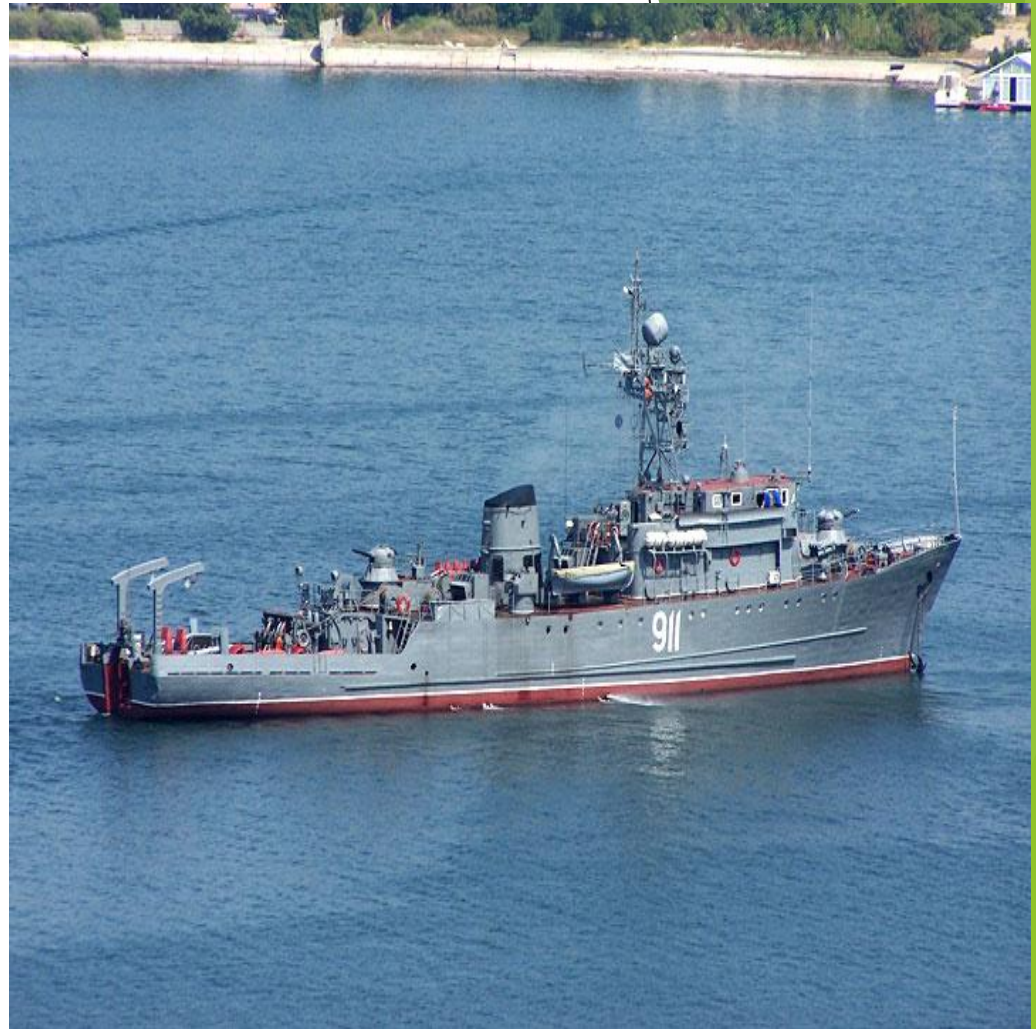
Морской траулер носит имя Ивана Голубца