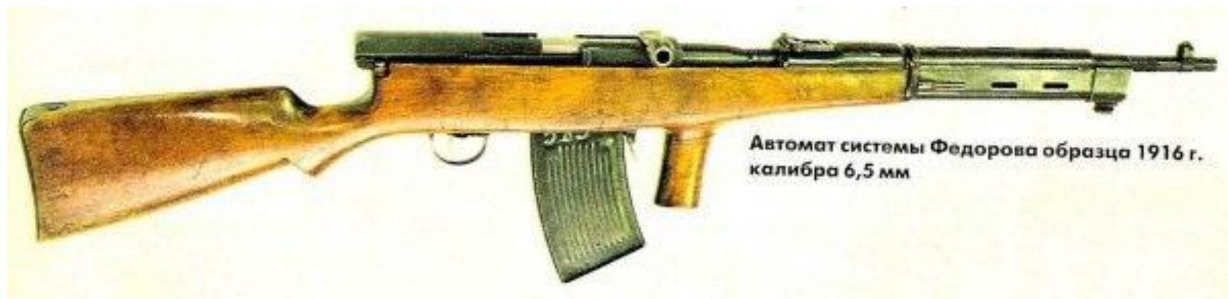
Автомат системы Федорова образца 1916 г. калибра 6,5 мм