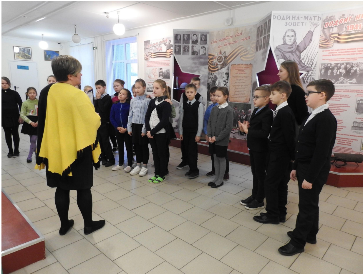
Макет и ученики