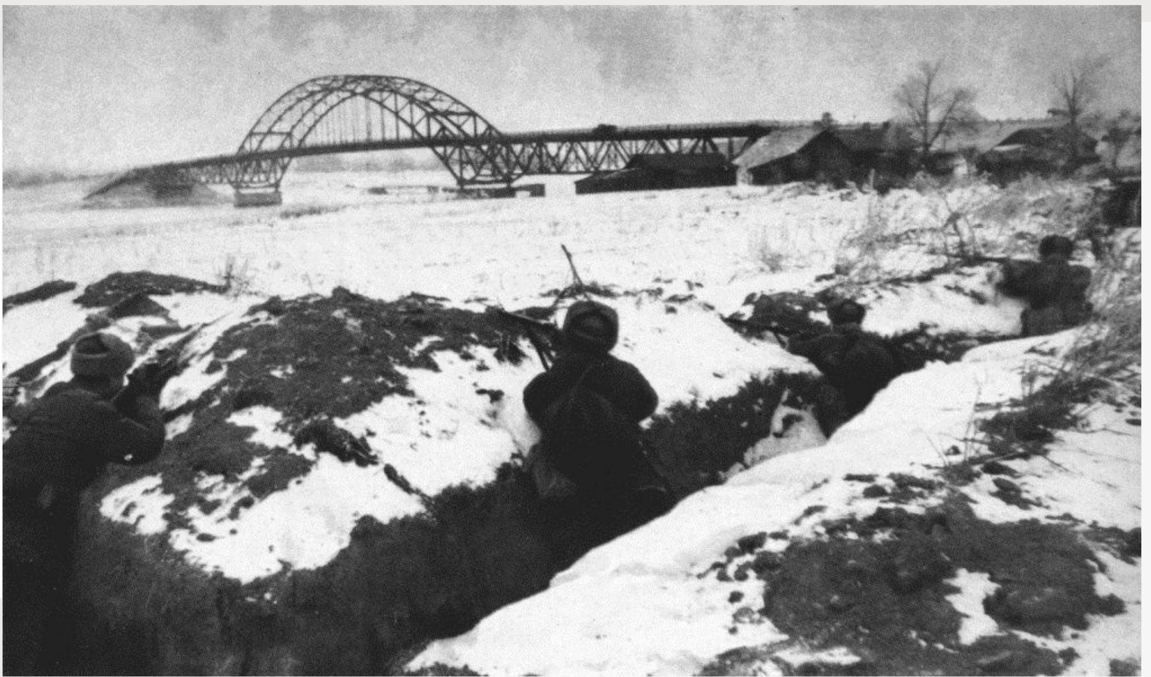
Окопы у моста Ленинградского шоссе