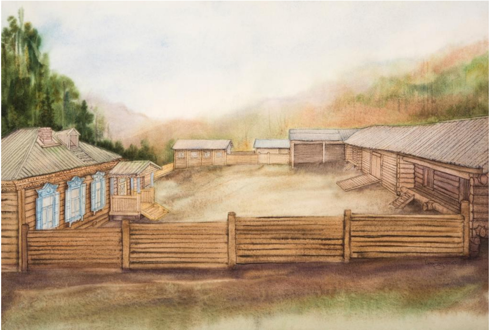
Русский старожильский комплекс