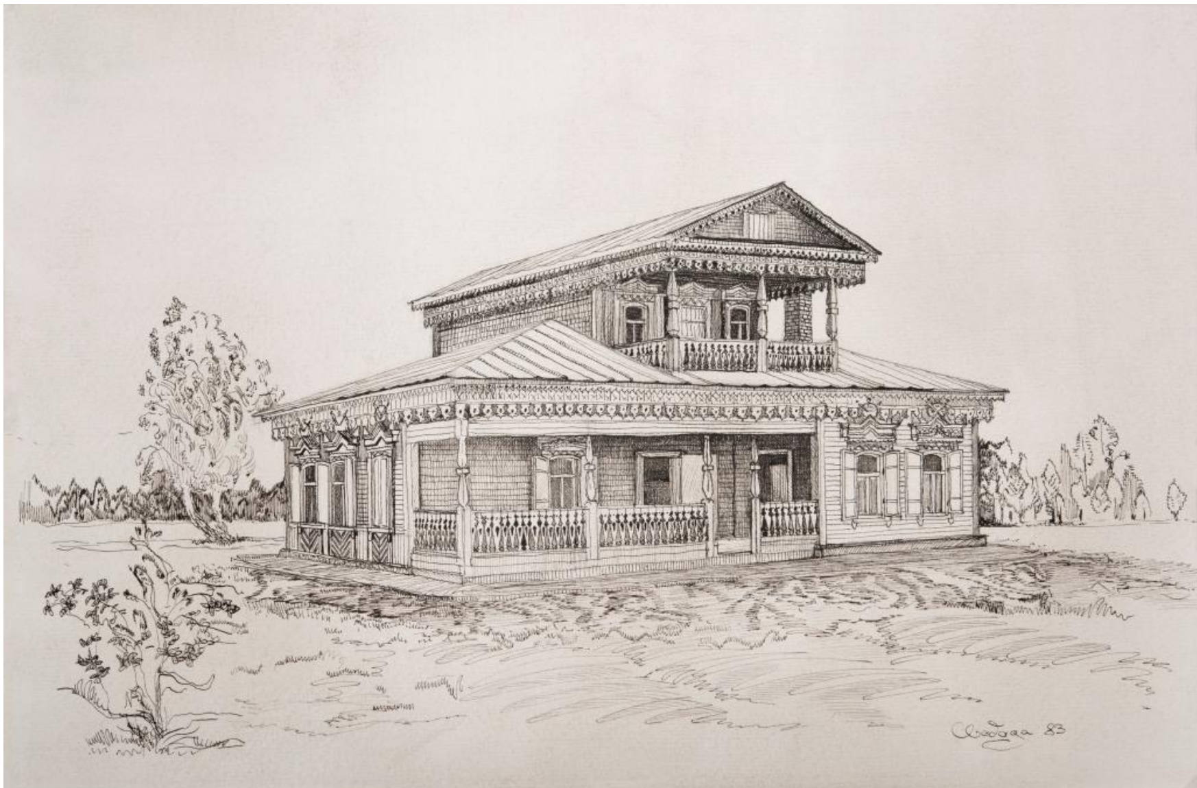
Двухэтажный жилой дом