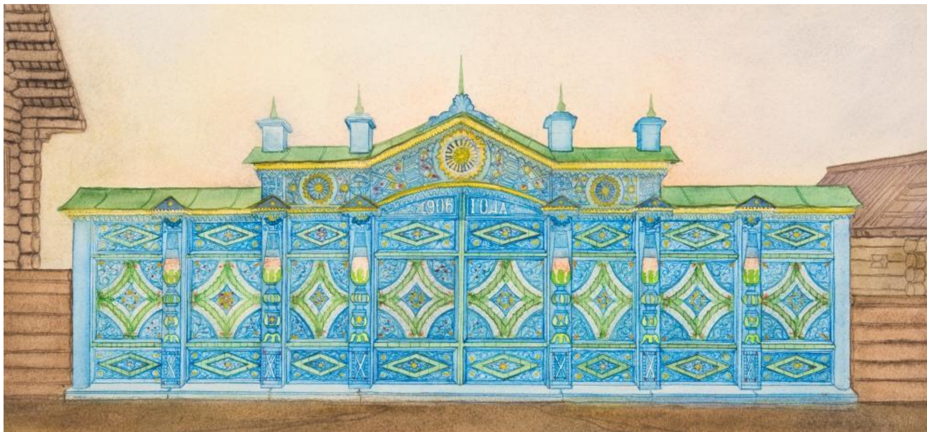
Въездные ворота из с. Новая Брянь