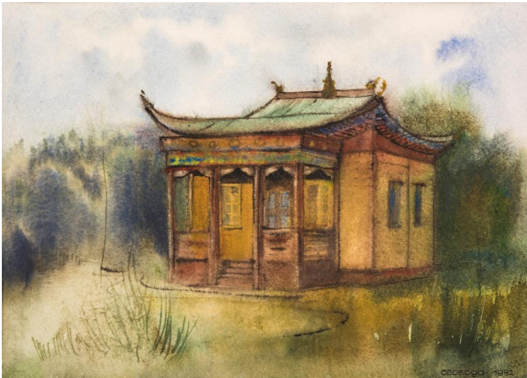
Дуган «Деважин» из Тамчинского дацана