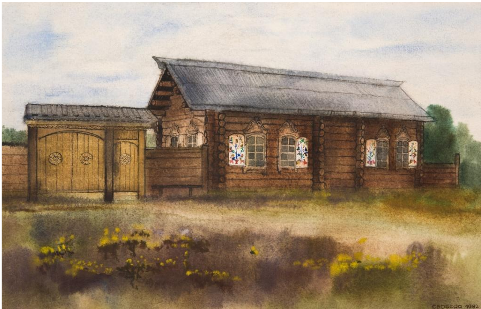
Дом зажиточного старообрядца Зайцева