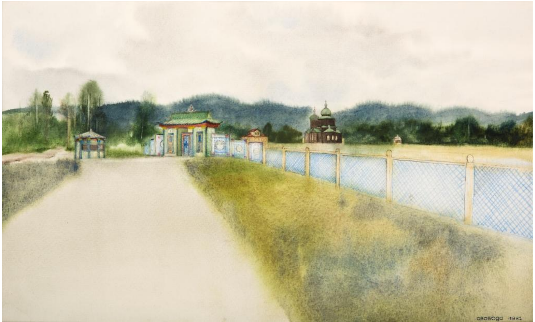
Вид на музей