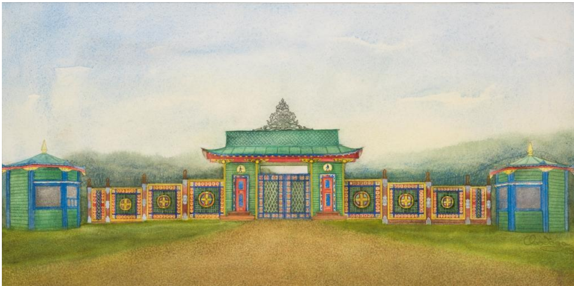
Центральные въездные ворота музея