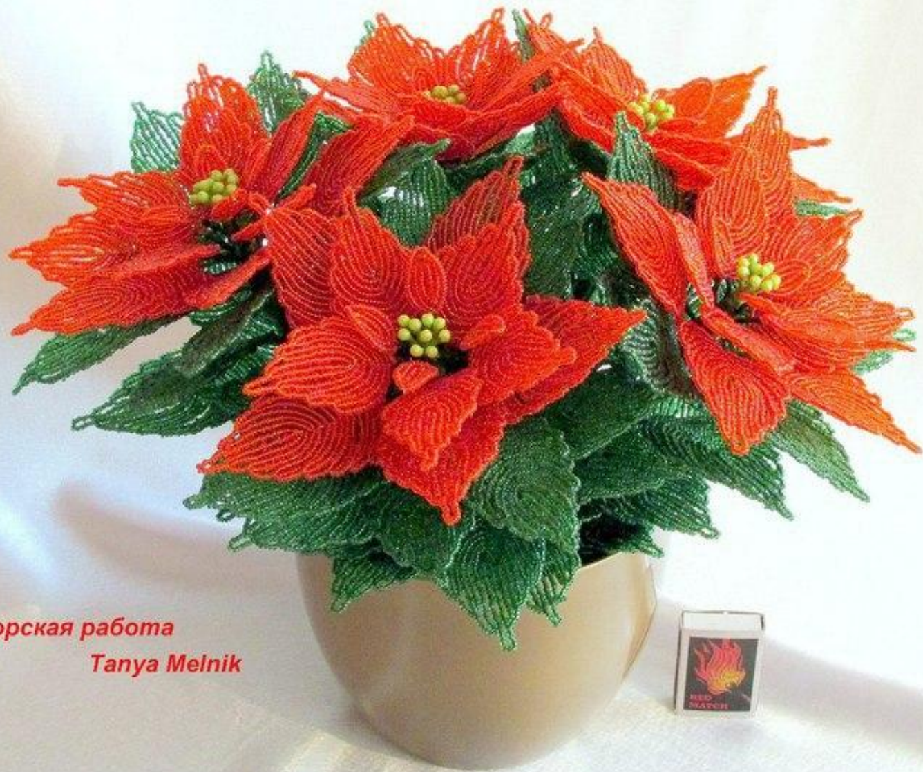
Авторская работа Tanya Melnik