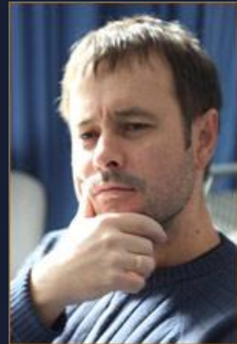
Композитор – Антон Ангриф