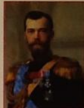
Николай II Александрович Романов (1868–1918)