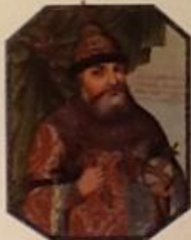
Михаил Фёдорович Романов (1596–1645)