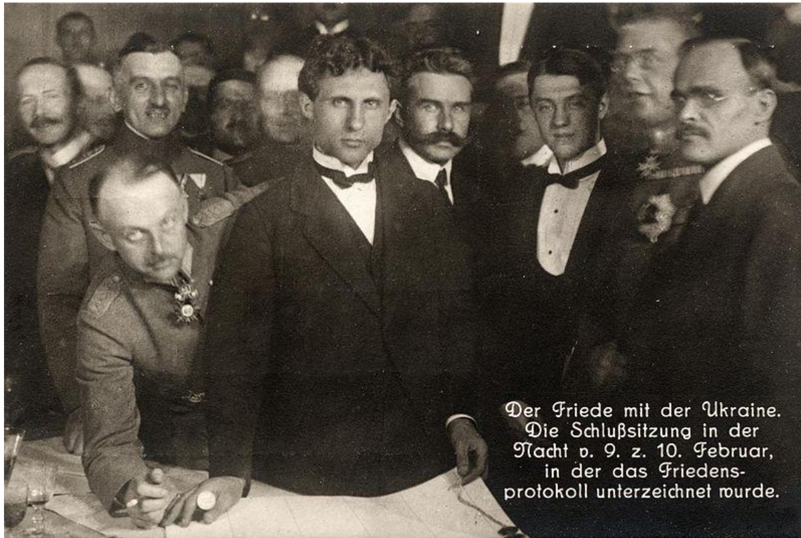
Der Friede mit der Ukraine. Die Schlußsitzung in der Nacht v. 9. z. 10. Februar, in der das Friedens- protokoll unterzeichnet wurde.