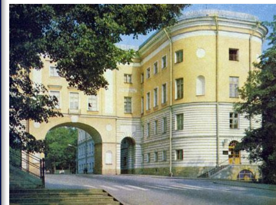
Экскурсовод в Царскомсельском лицее