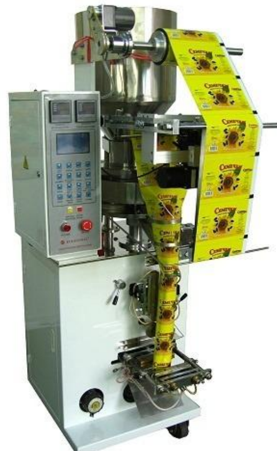
Автоматический фасовочно-упаковочный аппарат