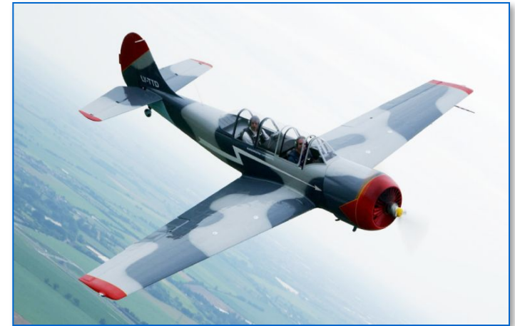
ЯК-52: тренировочный самолёт