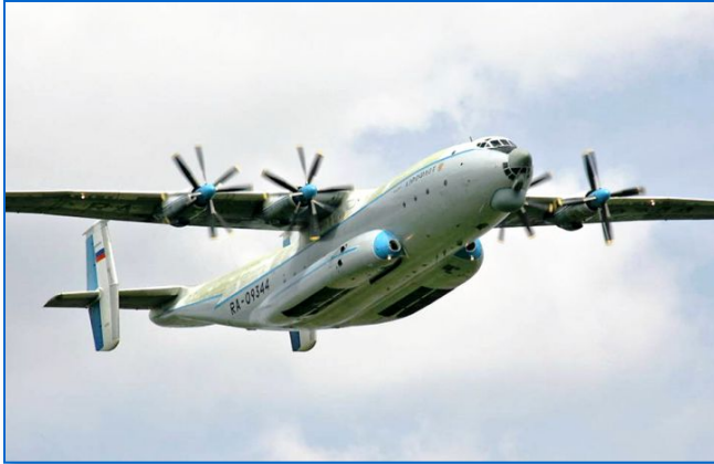
Ан-22: для перевозки грузов