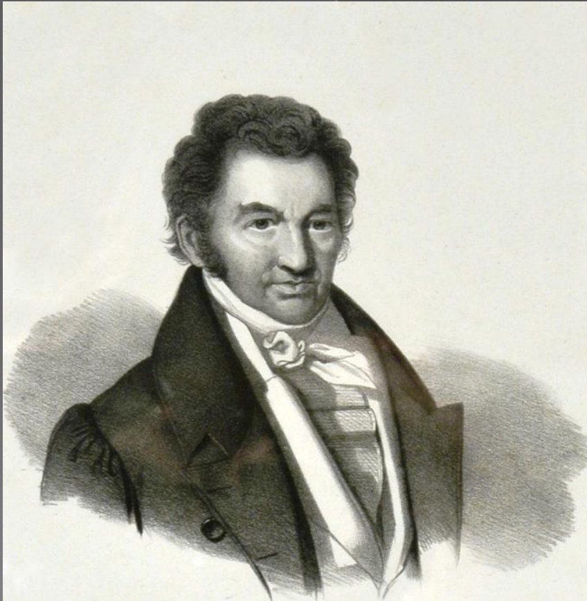
Якоби (1775 – 1858)