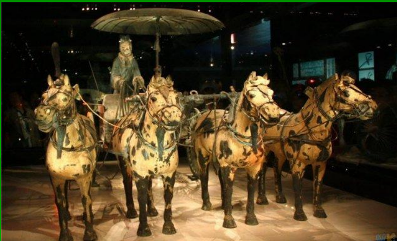
Погребальная колесница Цинь Шихуана

Цинь Шихуан искал бессмертия себе и потомкам, но после его смерти династия кончилась