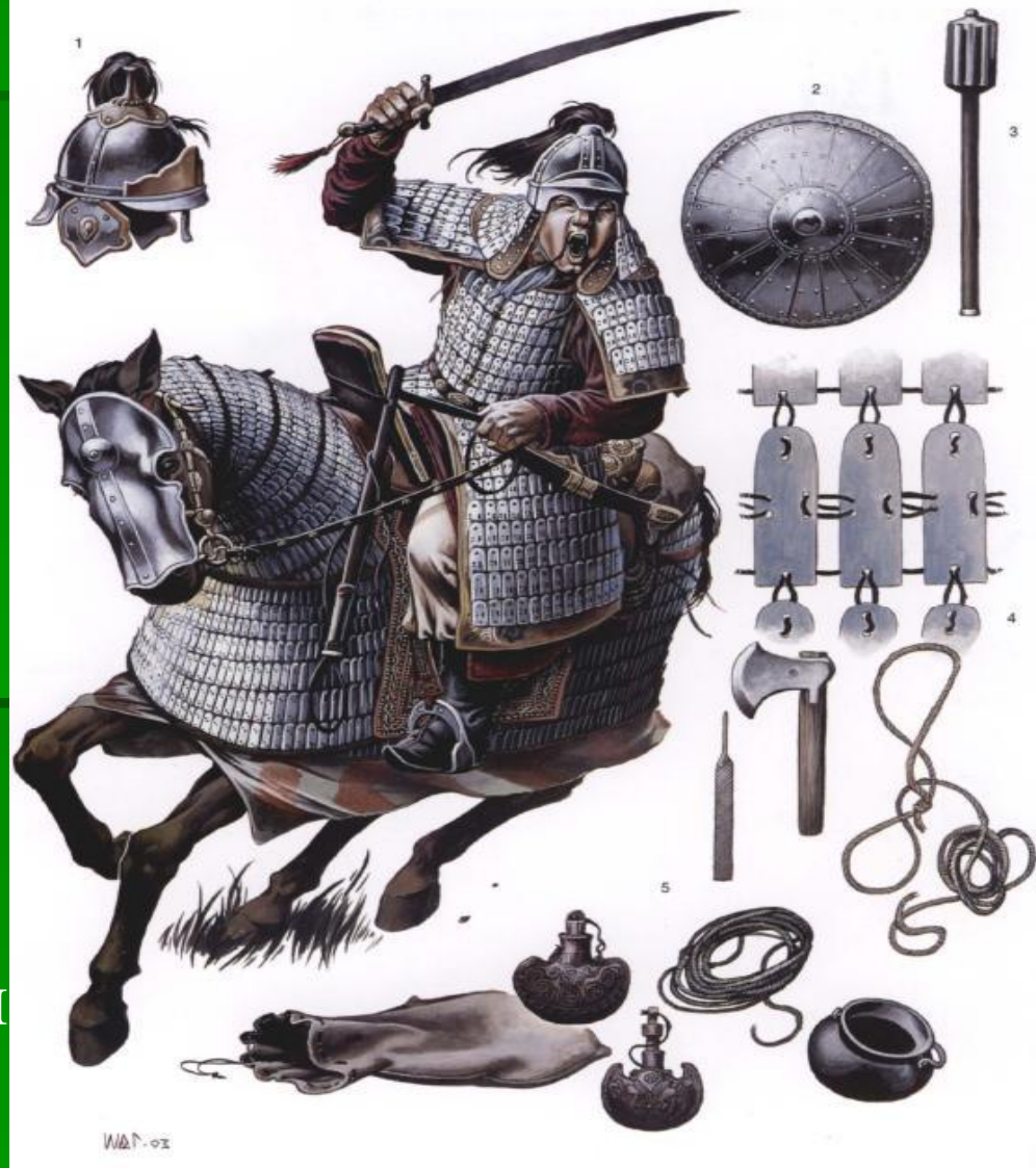
Конный воин Цинь Шихуана