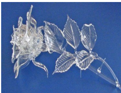
Художественно- декоративные изделия