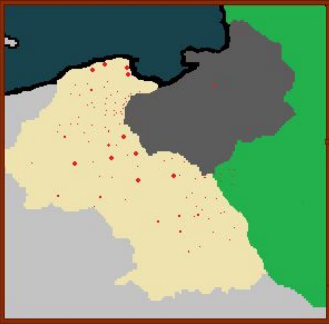
Карта уничтоженных поселений с польским населением