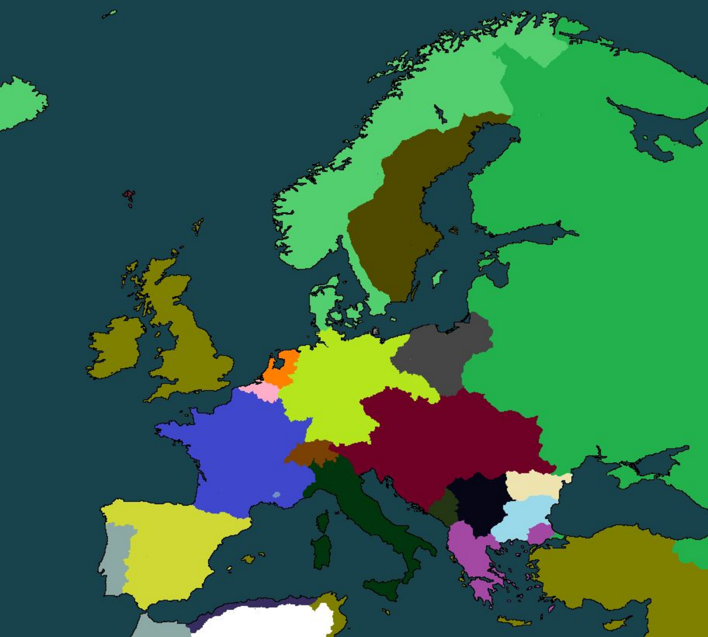
Карта после раздела Польши