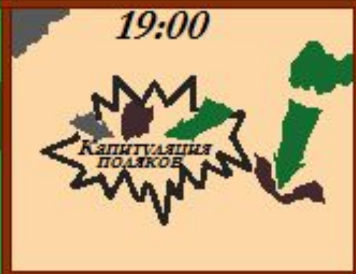
Сражение при Миндальшторфе