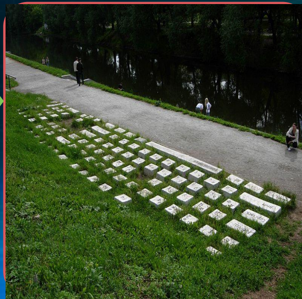
Набережная реки Исеть