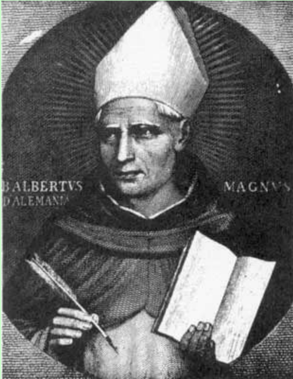
Альберт Великий (1200 — 1280)