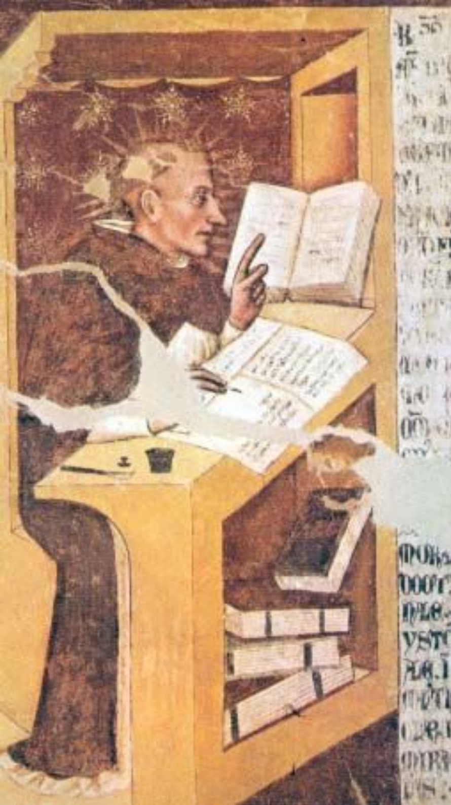
Венсан де Бове (1190 - 1264)