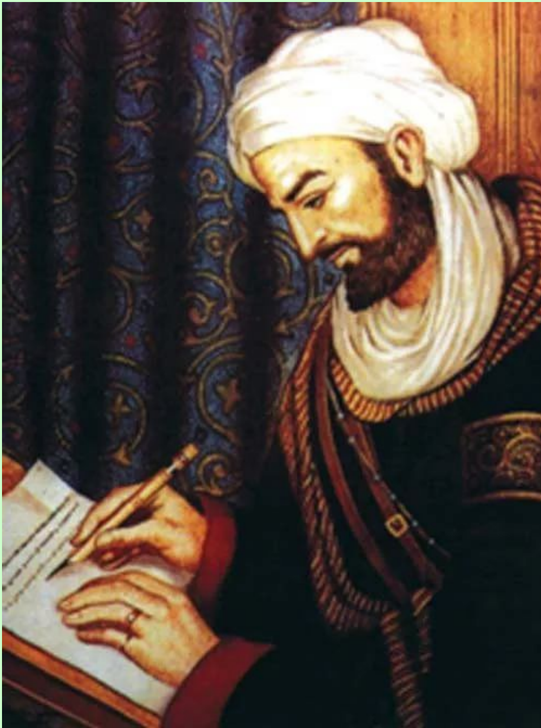
Ибн-Сина (980 - 1037)