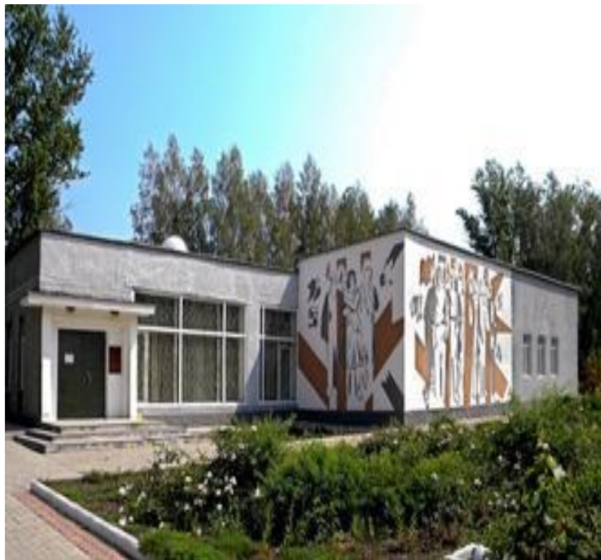
Музей-заповедник «Большой дуб»