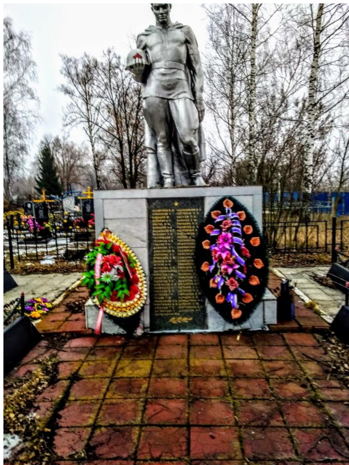
Памятник «Неизвестному солдату»