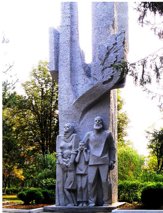
Памятник «Последни минуты»